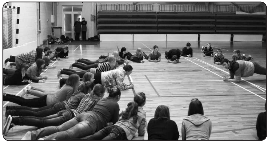
Viena no aktivitātēm projekta dienā «Veselīgs dzīvesveids»

Valkas novada Bērnu un jauniešu centrs «Mice» nodrošina iespēju mācīties sporta dejas, darboties folkloras kopā, spēlēt teātri. Tā telpās darbojas