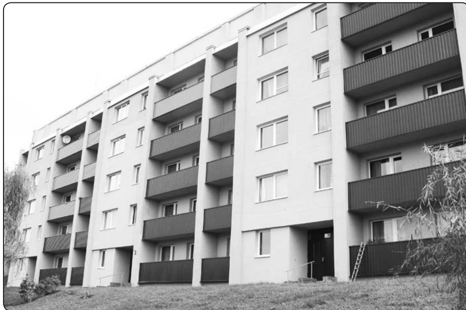
Renovētā ēka skaisti iederas pilsētas vidē, un iedzīvotāji jūtas komfortabli pat aukstajās ziemas dienās

Atzišos, sākotnēji biju nedaudz skeptiski noskaņots pret «Valkas Būvnieks». Taču praksē viņi mani pārliecināja, un tagad varu pilnīgi godīgi teikt, ka ar būvnieku darbu esmu ļoti apmierināts. Protams, sīkas problēmas ir, taču tās visas kopīgi risinām