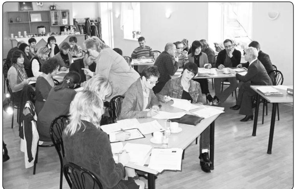
Ikvienam dalībniekam zināšanas, kas iegūtas semināros, lieti noder ikdienas darbā

Projekta kopējās apstiprinātās izmaksas ir Ls 10 898,92, kas ir 100% ESF finansējums. Projekta ieviešanas laiks ir 01.08.2011. – 30.04.2012. ❖