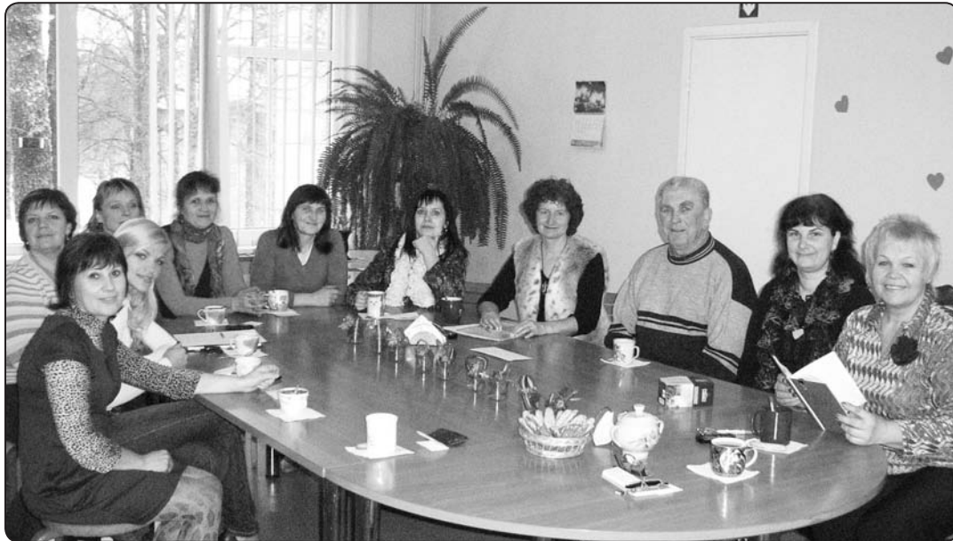
Bērnu nama darbinieki cenšas ielikt sirdi un izdomu, lai audzēkņu ikdienu un svētkus padarītu krāsainākus

svinēs savu 18.dzimšanas dienu. Svētku sagatavošanā aktīvi piedalās brīvdienu skolām sabraukušie jaunieši, jo ir iecere šajā reizē izveidot ne tikai atskatu uz noieto ceļa posmu fotogalerijās, bet arī izstādīt dažādos pulciņos tapušos bērnu darbus un apkopot sportiskos sasniegumus. Pasākums norisināsies ar devīzi «Mani raibie 18», kurā aicināsim pašus bērnus, dibinātājus un visilglaičīgākos darbiniekus no bagātā atmiņu klāsta izcelt dienas gaišmā spilgtākos brīžus. Ciemos gaidām gan tos, kuri lemj par mūsu ikdienu, gan tuvākos kaimiņus, gan draugus. ❖