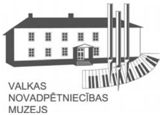
VALKAS NOVADPĒTNIECĪBAS MUZEJS

Valkas novadpētniecības muzejs 2012.gadā organizē Valkas novada mākslinieku darbu 13.izstādi «No mākslinieka jūtām uz skatītāja izjūtām».