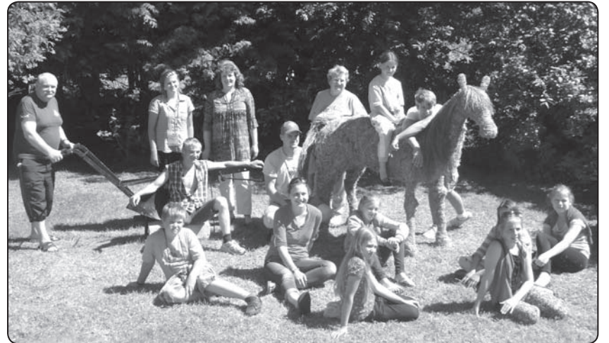
Noturēties dzīves seglos ir pats svarīgākais! Mazpulcēni izgatavojuši brīnumskaidu zirgu, kas kārķēniešus un viesus priecēs visu vasaru