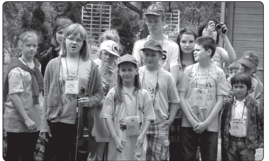
Mājinieki – Kārķu mazpulcēni sagaida un pavada viesus, cerot uz tikšanos citu gadu

Bērniem iemācīt darbu un svinēt svētkus ir ļoti vērtīgs un svētīgs darbs. «Mums ir ļoti svarīgi nodot stafeti jaunajai paaudzei, lai tradīcijām ir pēctecība. Šis projekts ir sevi attaisnojis, tas pierāda – laukos dzīve ir interesanta,» visas komandas vārdā saka un vērtē nometnes