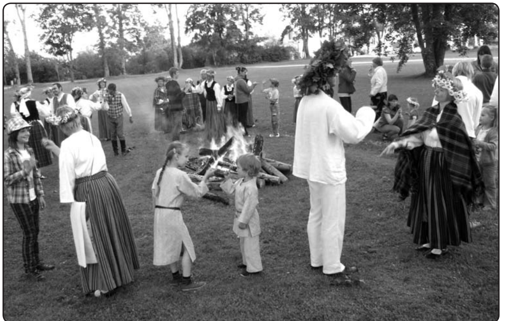
Valcēnieši atzīst – mācīties senas rotaļas un deju soļus ir interesanti ne tikai tālajiem viesiem no Gatčinas, bet arī mājniekiem