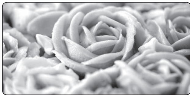
Rožu lietus uz Sandas tortes, kas atnesa godpilno 3.vietu valsts mēroga konkursā