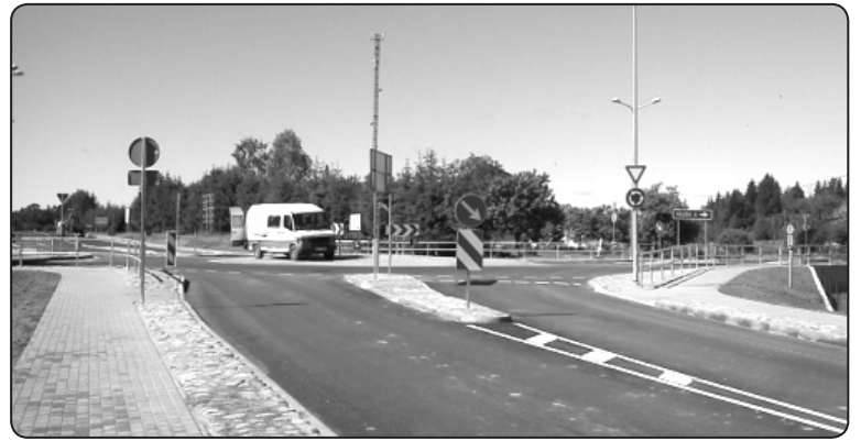
Rekonstruējot Rīgas – Zemgales ielu krustojumu, tika uzlabota satiksmes drošība un arī ielas segums

Jūnija beigās tika nodots ekspluatācijā Rīgas – Zemgales ielu krustojums un ar šīs aktivitātes pabeigšanu ir noslēgusies Eiropas Savienības Eiropas Reģionālās attīstības fonda (ERAF) projekta «Tranzīta maršruta ielu rekonstrukcija Valkas pilsētā» ieviešana.