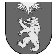
Valkas novada dome