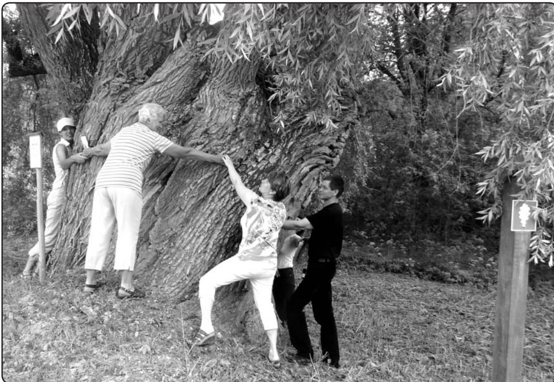
«Esam gatavi saudzēt, sargāt un mīlēt mūsu novada dabas bagātības,» saka žūrijas komisija apņēmot un samīļojot Naglu dižvītoli, kurš aug ceļa «Ziemeļu stīga» šogad rekonstruējamā un asfaltējamā posma malā Kārķu pagastā.

Prasmīgu dabas apstākļu un cilvēka čakluma sadarbību apliecina arī dižsaimniecības kviešu mūris vai 19 dažādu šķirņu kartupeļu lauks kā