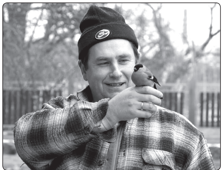
Pat mazais sarkankrūtītis (svilpis) zina, kam var uzticēties. Daiņa viens no vaļaspriekiem ir putnu vērošana.