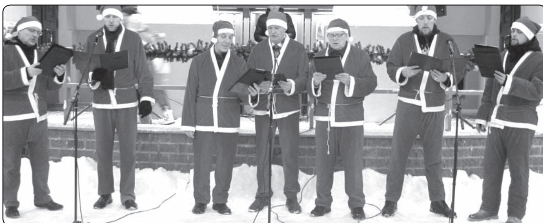
Egles iedegšana ienes svētku prieku pilsētā.