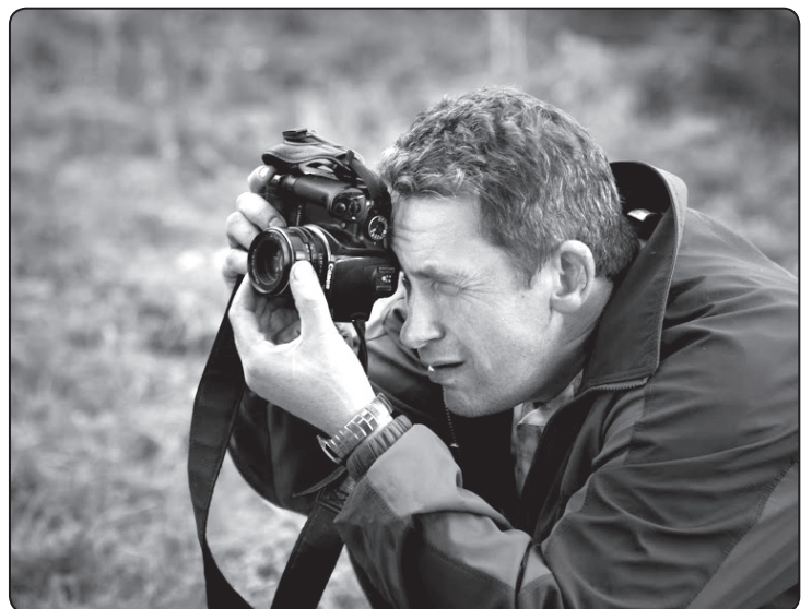
Mirkli, jēl apstāties!