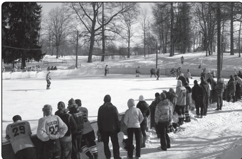
Vijciema kauss hokejā – ir tradicionāls un iecienīts pasākums pagastā.

Veiksmīgi noritējusi piedalīšanās biedrības «Lauku partnerība Ziemeļgauja» izsludinātajā vietējās stratēģijas projektu konkursā, īstenojot projektu «Aktīva brīvā laika pavadīšanas iespēju pilnveidošana Vijciemā». Lauku atbalsta dienestā projekta iesniegumu apstiprināja pagājušajā gada 1.jūnijā, kā rezultātā iegūts finansējums sporta inventāra iegādei Ls 18948,46 apmērā. Tā kā biedrībai ir piešķirts sabiedriskā labuma statuss, tad līdzfinansējums projektā nebija