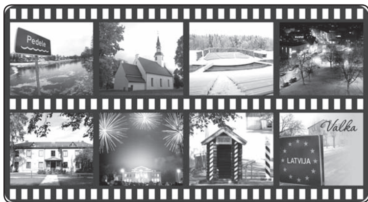
TIB aicina iegādāties jaunus suvenīrus – arī magnētu ar Valkas pilsētas fotokolāžu!