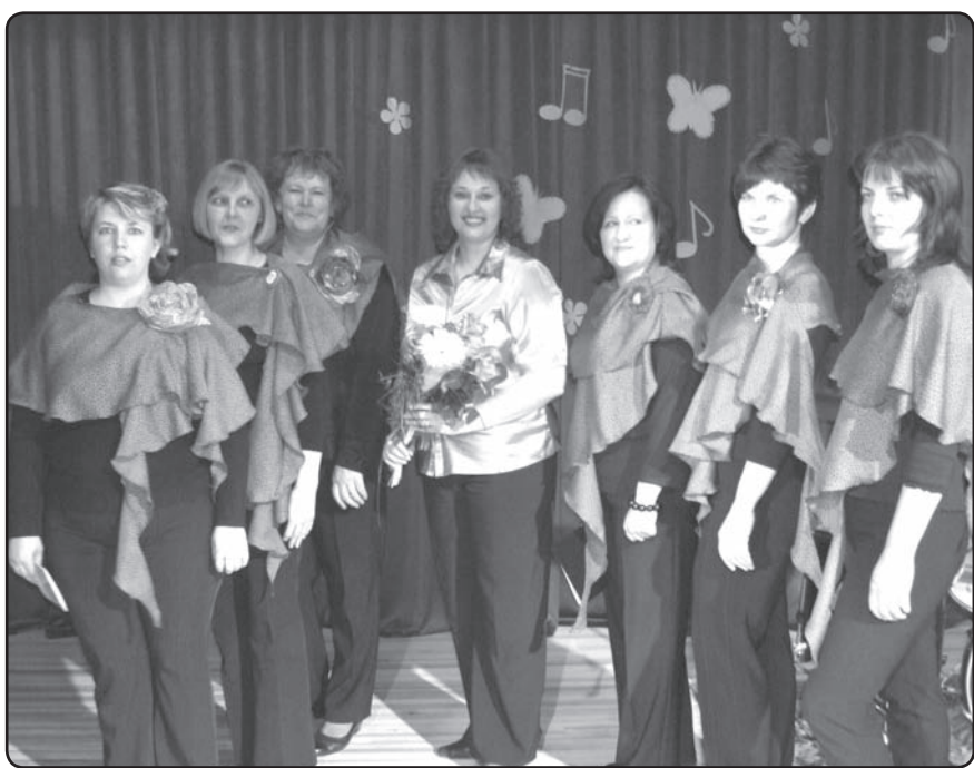
Vokāla ansambļa skatē zvārtavietes parādīja, ka veiksmīgi spēj novadīt novada mēroga pasākumu.

Plašāka informācija un citu iestāžu un nodaļu paveiktie darbi būs izlasāmi Valkas novada pašvaldības publiskajā pārskatā.