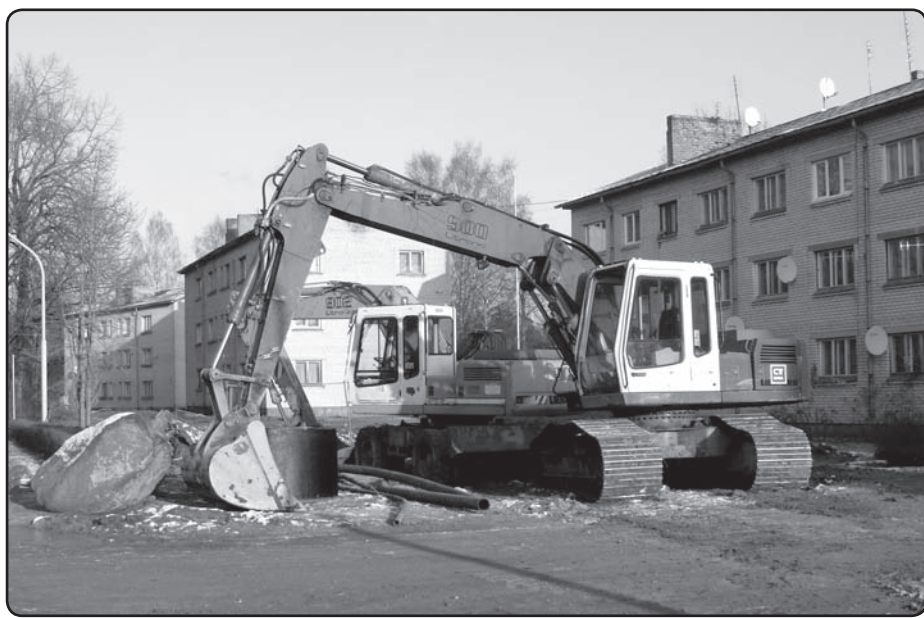
Projekts «Kārķu ciema ūdenssaimniecības attīstība» attaisnojis mērķi – pabeigti 1.kārtā ielānotie darbi.