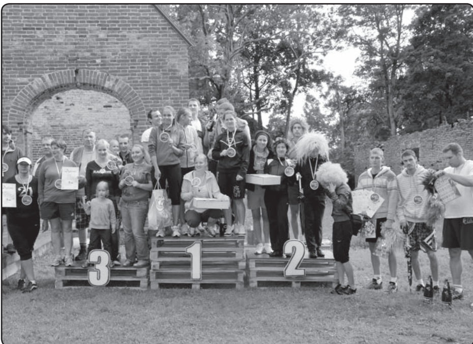
Tradicionālās Valkas pagasta vasaras sporta spēļu pulcē visu paaudžu aktīva dzīves veida piekritējus.