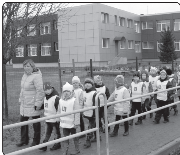
PII «Pasaciņa» saime ir patiesi gandarīta – tagad var ievērot visus drošības pasākumus, organizējot pastaigas ārpus teritorijas.