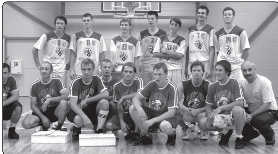
Vijciema sporta zālē regulāri notiek dažādas sporta sacensības. Vijciemiešu draudzības spēle ar Valkas volejbola kluba komandu.