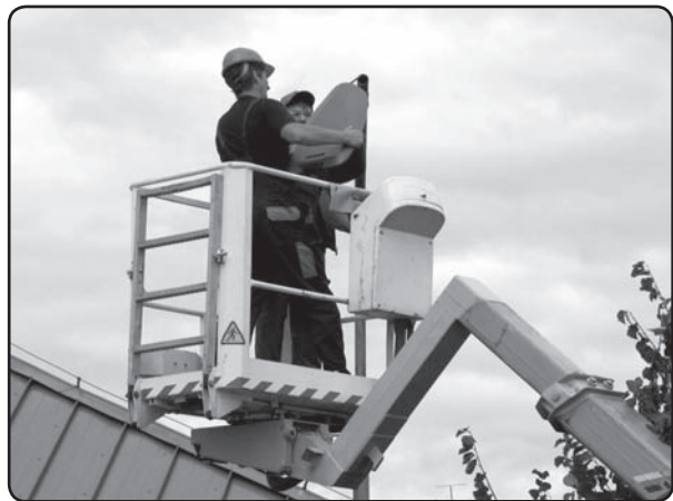
Jaunās un ekonomiskās LED lampas Valkas pilsētā dos ievērojamu energopatēriņa ietaupījumu.