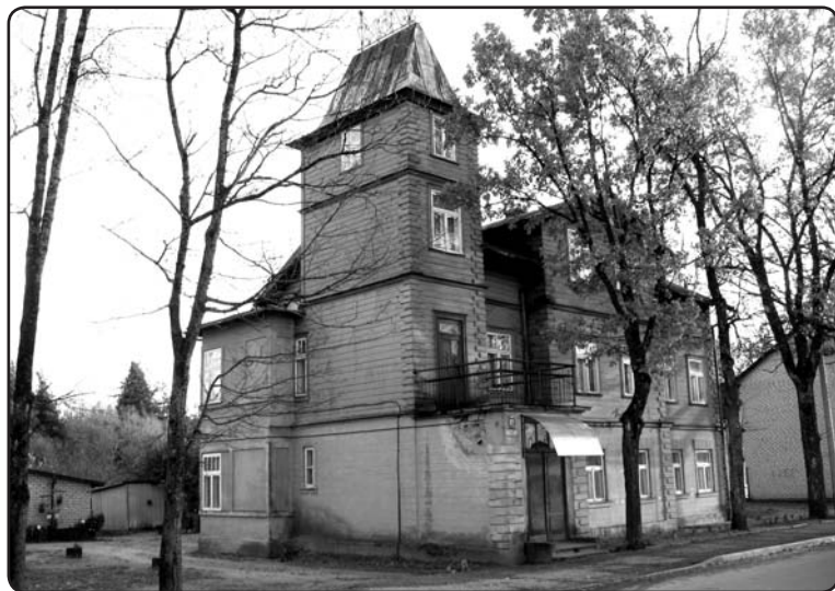
Ēka Rīgas ielā Nr. 27, kur A.Rudītis 1920.gadā izvietoja savu fotodarbnīcu. Valka, 2008.gads.

Antona Rudīša fotouzņēmumiem ir kultūrvēsturiska nozīme. Valkas novadpētniecības muzeja krājumā ir aptuveni 200 pastkartes, fotogrāfijas u. c. materiāli, kas saistīti ar šo fotogrāfu. A.Rudīša pastkaršu un fotogrāfiju kolekcijā ietilpst vērtīgi eksemplāri, kas vēsta gan par valcēniešu sadzīvi, ikdienu