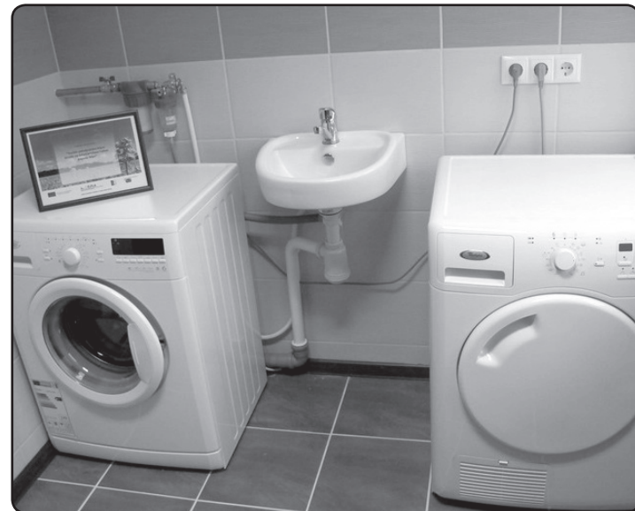
Iegādātā sadzīves tehnika atvieglo un padara ērtāku Sēļu iedzīvotāju ikdienu.

Projekts atbilst biedrības «Lauku partnerība