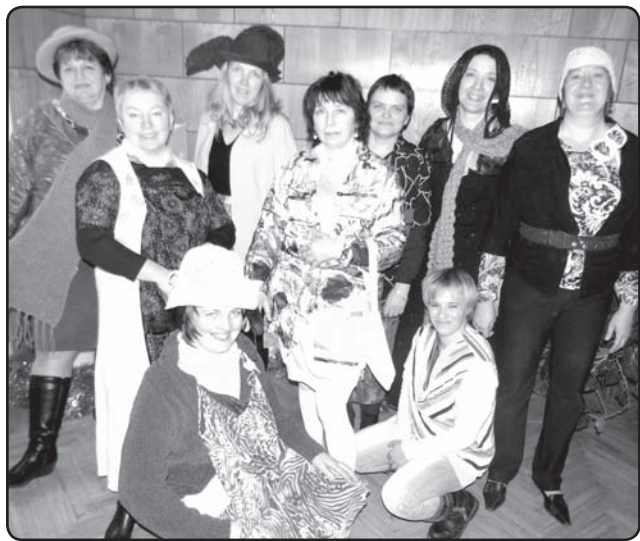
Sociālā dienesta darbinieki ir vienota komanda gan svētkos, gan ikdienā.

• Sociālajiem pabalstiem izlietoti 287 956 LVL – pabalstus saņēmušas 1429 ģimenes (2866 personas), t.sk.: 796 personas – pabalstu GMI nodrošināšanai – 166 732 LVL, 1242 personas – pabalstu dzīvoklim (mājoklim) – 64 951 LVL, 340 personas – pabalstu ēdināšanai izglītības iestādēs – 32 325 LVL, 24 personas – pabalstu aprūpei mājās – 5140 LVL.