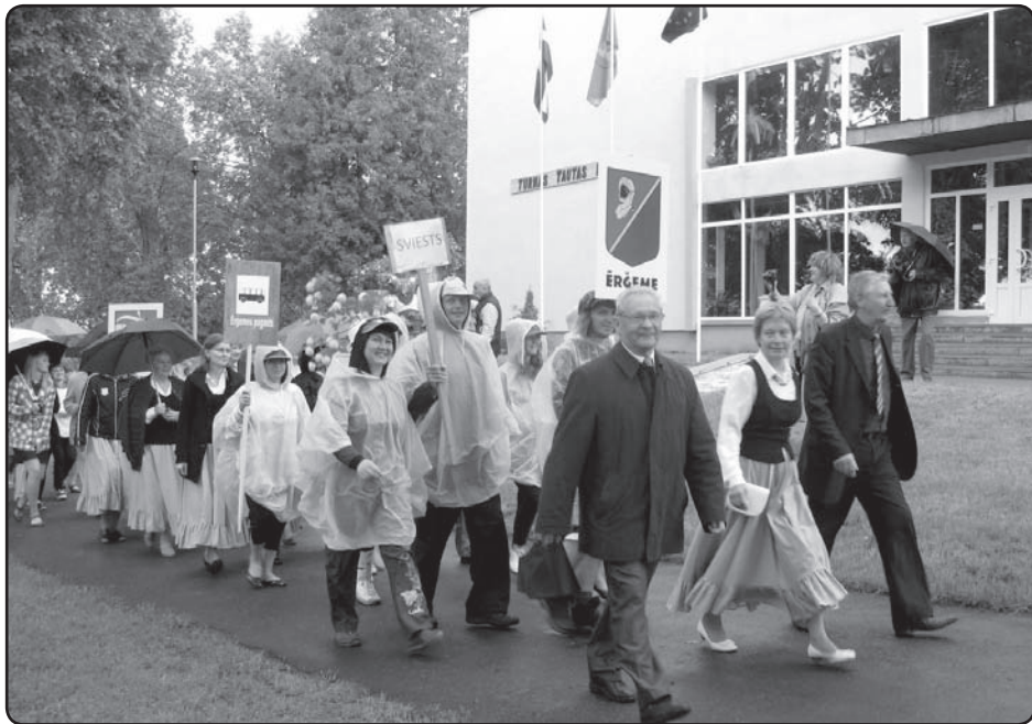
3. Valkas novada svētkos kopīgā parādē dodas novada vadība un svētku dalībnieki.