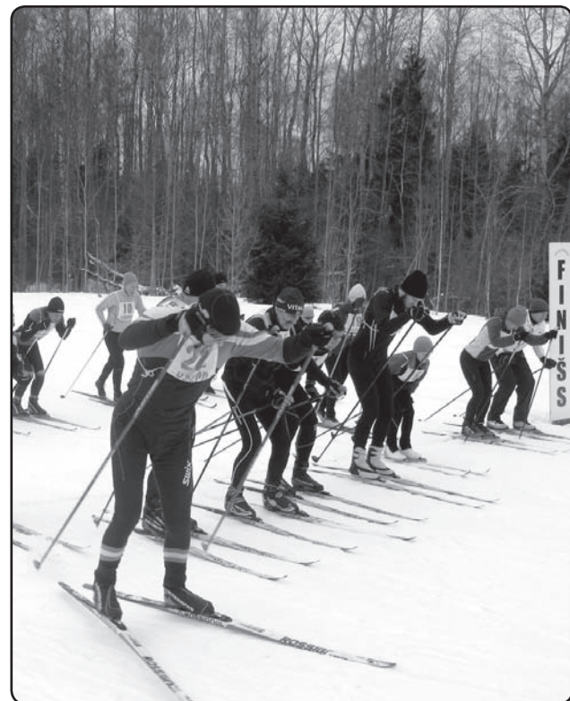
Viens no tradicionālajiem sporta pasākumiem ziemā ir Valkas novada sacensības distanču slēpošanā.