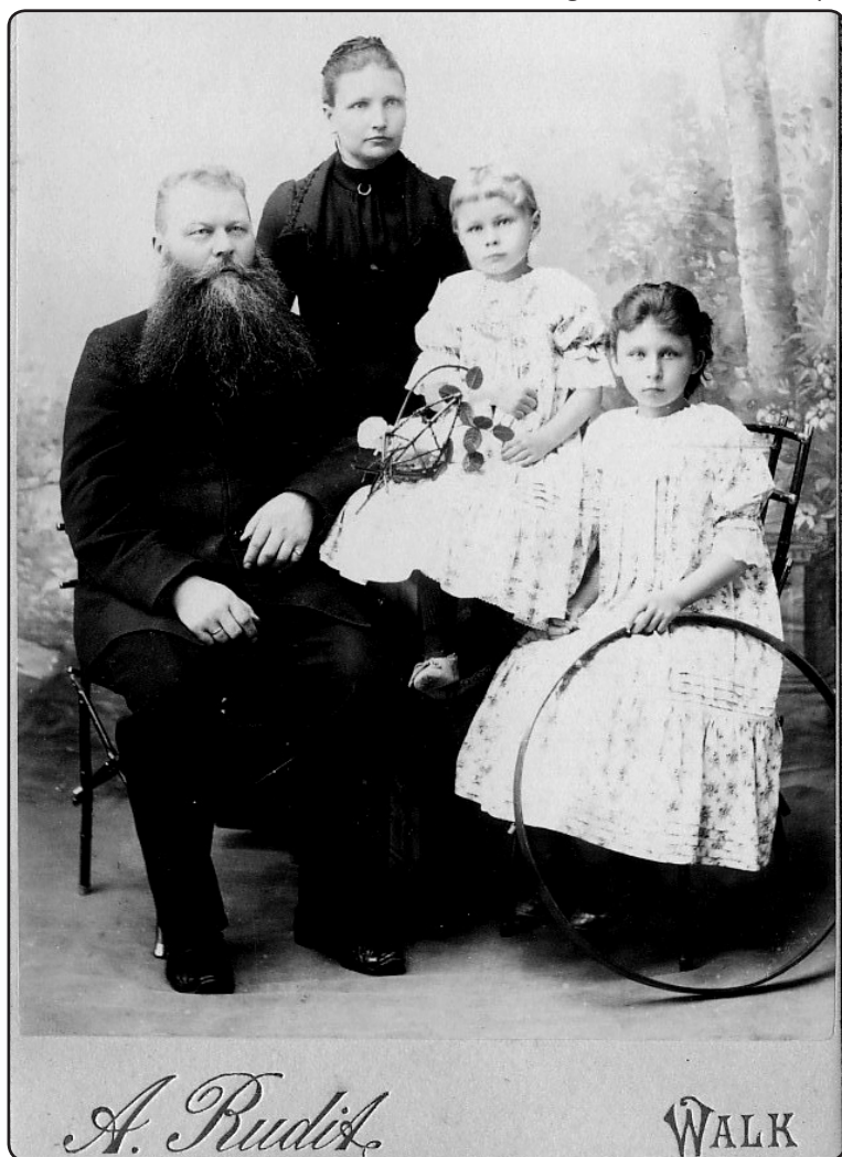
Nezināma ģimene. Valka, apt. 1895. – 1903.g. un svētkiem, gan par pilsētas apbūvi 19. gadsimta beigās un 20.gadsimta 1. ceturksnī.

Unikāli ir Antona Rudīša fotouzņēmumi Valkā no Lugažu draudzes baznīcas torņa ar skatu uz Rīgas un Raiņa ielu krustojumu drīz pēc pilsētas sadalīšanas 1921.gadā un arī pēc 5 gadiem. Viņš iespējams ir pirmais fotogrāfs, kurš uzkāpis Lugažu draudzes baznīcas tornī fotografēt pilsētu no šī punkta, ko vēlākajos gados fotogrāfi izvēlās kā vienu no raksturīgākajiem Valkas skatiem. ❖