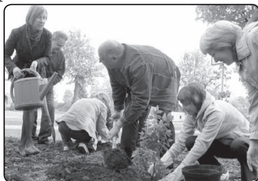
Akcijas «Kad Valkā ienāk ceriņi» noslēgumā Lugažu laukumā tika iestādīti 10 ceriņu šķirnes President stādi.