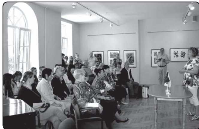
Gatčinā pilsētas mākslas skolas audzēkņi darbi valcēniešus pārsteidza ar spēcīgu zīmēšanas tehniku.