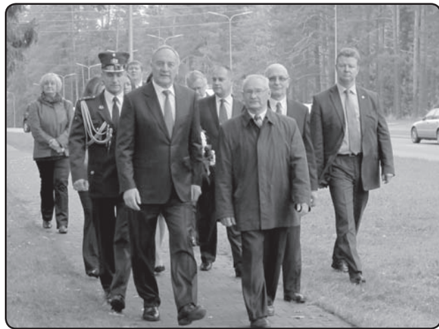
Viens no gada nozīmīgākajiem notikumiem bija Latvijas Valsts prezidenta Andra Bērziņa vizīte Valkā.

• Uzņemtas Latvijas un ārvalstu delegācijas : 4.aprīlī – Tartu Universitātes studenti, 25.maijā – Aizputes novada domes speciālisti, 24.augustā – Jelgavas novada domes deputāti, 24.srptembrī – Valmieras, Strenču, Cēsu un Amatas novadu speciālisti (energoefektivitātes projekti), 4.oktobrī – Latvijas Valsts prezidenta A.Bērziņa vizīte, 8.oktobrī – Polijas skolēni, 18.oktobrī – dāņu skolēni, no 14. līdz 16.novembrim – Osthannaras (Zviedrija) pašvaldības speciālisti, 25.novembrī – Ukrainas žurnālisti. ❖