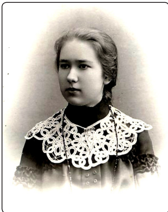
Nezināmas jauniņas vizītkaršs. Valka, apt. 1903.g.

precīzi zināms, ka viņš ar «Atpūtu» sadarbojies kā līdzstrādnieks 1926. un 1927.gadā. Tādējādi ir fiksēti nozīmīgi sabiedriskie un politiskie notikumi Valkā, piemēram, Valsts Prezidenta Kārļa Ulmaņa vizīte Valkā uz Ziemeļlatvijas 1. zemnieku dienām 1927.gadā.