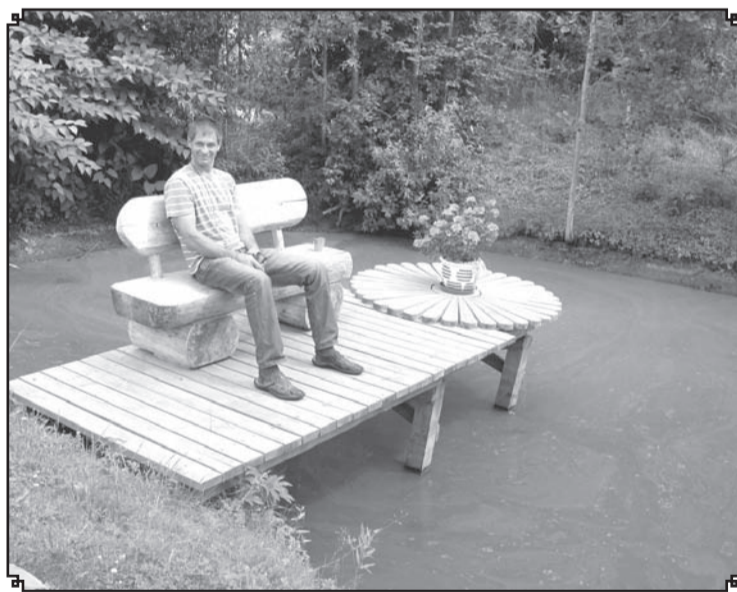
Pieredzējušo komisiju patiesi pārsteidza dīķa vidū ierīkotā atpūtas vieta – masīvkoka sols ar atzveltni