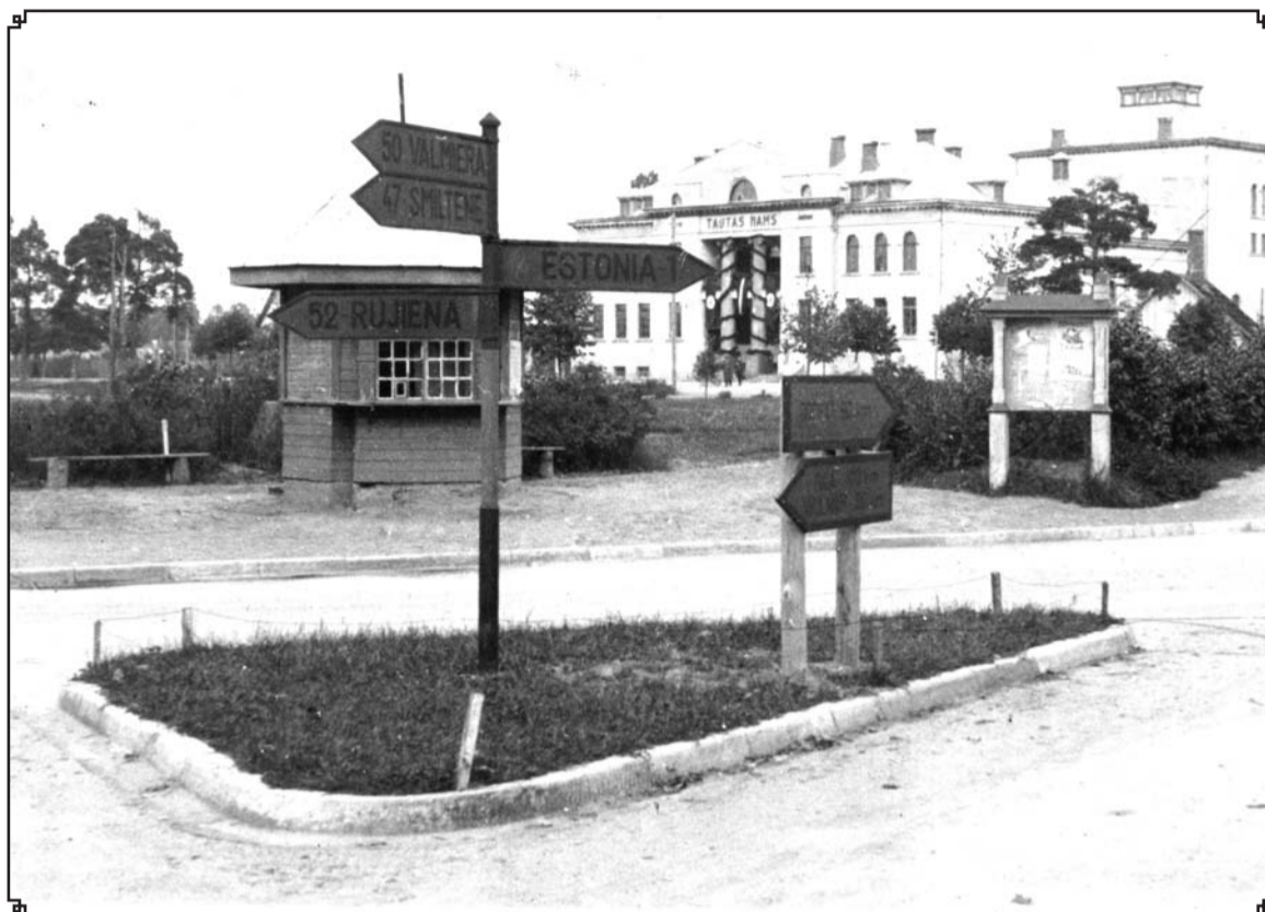
Tūrisma informācijas vitrīna «Veicināt tūrismu!» Valkā Rīgas, Beverīnas un Semināra ielu krustojumā. Apt. 1939./1940.g.