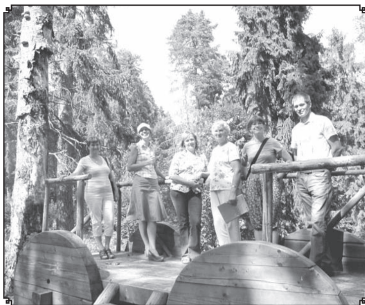
Konkursta komisija iepazīst Lustīndruvas taku Kārķu pagastā