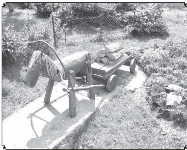
Apkārtējā vidē labi iederas tieši no dabas materiāliem veidotas dārza skulptūras