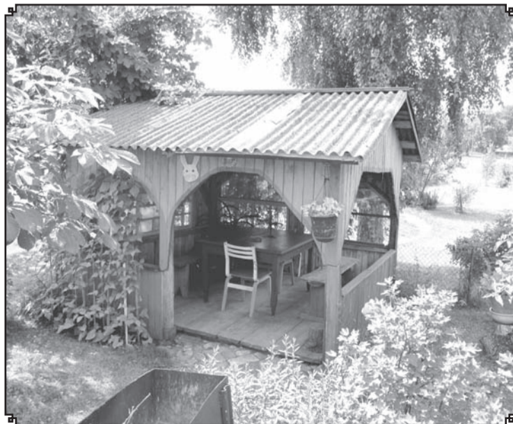
Daudzās sētās bija jaukas atpūtas vietas, un māju saimnieki tām bija raduši visdažādākos risinājumus