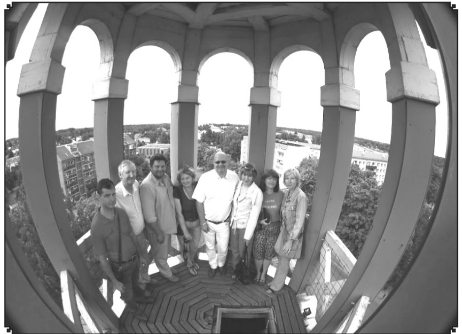
Domes priekšsēdētājs, kopā ar tūrisma nozares pārstāvjiem, izmanto iespēju – paraudzīties uz Valku no putna lidojuma.

kas neprasa lielu finansiālu ieguldījumu, bet tikai rīcību. Pavisam drīz tiks uzstādīti arī 5 bērnu rotaļu laukumi gan laukos, gan pilsētā. Sakārtosim arī futbola laukumu pie Valkas pamatskolas, darbs jau notiek pie futbola vārtu uzstādīšanas Rūjienas ielas mikrorajonā. Ar daudz mazākām izmaksām, nekā sākotnēji tika plānots, sāksim darbu pie pludmales volejbola stadiona izveides kalnā aiz Valkas ģimnāzijas.