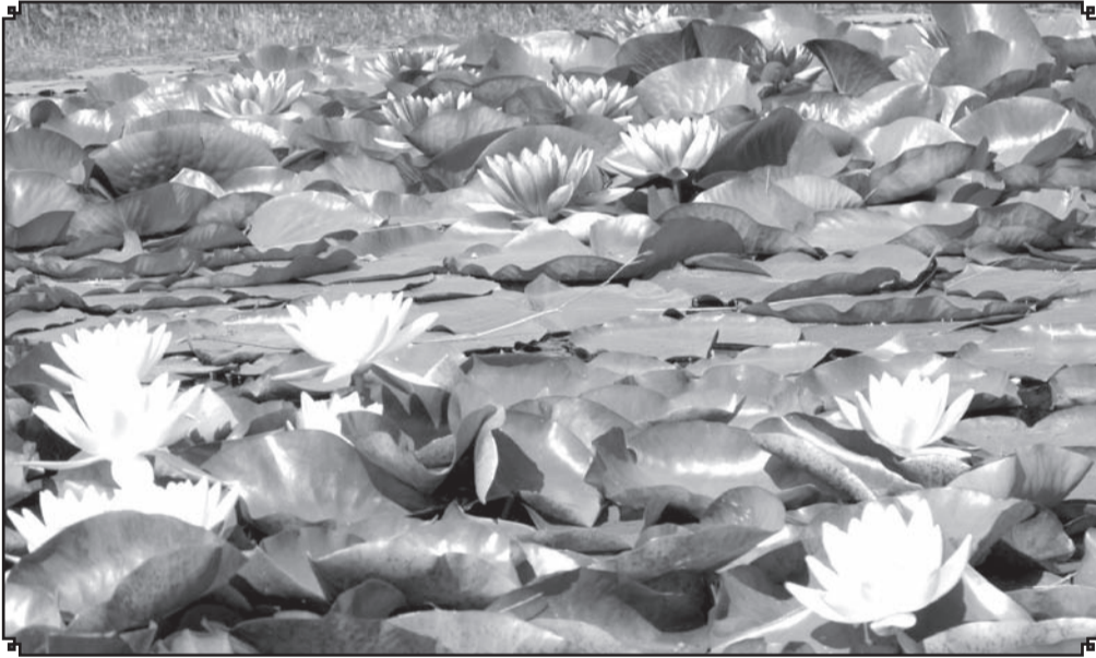
Nav jābrauc uz Vecpiebalgu – dažādu krāsu ūdensrozēs tiek audzētas arī mūsu novadā.

Mūsu novadā ir daudz skaistu sētu un tās kopj čakli cilvēki, ar kuriem varam lepoties. ❖