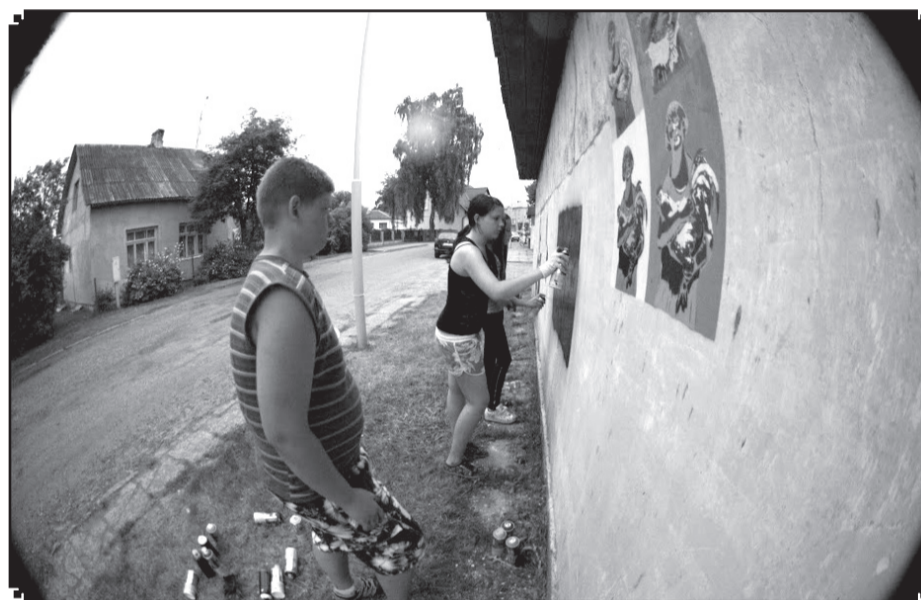
Grafiti tehnikā jauniešu apgleznotā siena ir košs akcents pilsētvidē, kas priecē ikvienu garāmgājēju.

«Apgleznšanai tika izvēlētas abu pilsētu celtnes, kas pilsētvidē izcēlās ar savām apskretušajām sienām. Jauniešiem meistarklase un dalība šajā radošajā procesā šķita ļoti aizraujoša – kopsadarbībā tapa ļoti nopietni – ideju nesoši monumentāli darbi, kas pārsteidzoši labi iekļaujas apkārtējā vidē, vizuāli to paspīlgtinot un bagāti-