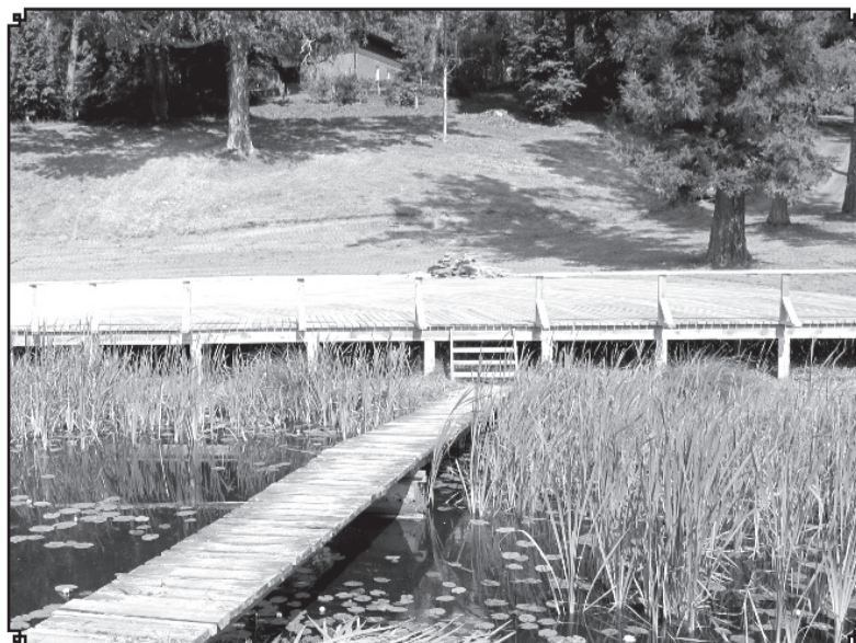
Turpmāk katru vasaru ērgemiešus priecēs labiekārtotā peldvieta, bet ziemā lieti noderēs turpat blakus izveidotais hokeja laukums

Lauku atbalsta dienesta Ziemeļvidzemes reģionālā lauksaimniecības pārvalde 07.03.2013. pieņēma lēmumu par projekta (Nr.12-09-LL03-L413201-000013) apstiprināšanu Eiropas lauksaimniecības fonda lauku attīstībai (ELFLA) Lauku attīstības programmas atklāta projektu iesniegumu konkursa pasākuma «Lauku ekonomikas dažādošana un dzīves kvalitātes veicināšana vietējo attīstības stratēģiju īstenošanas teritorijā» ietvaros. Projekts atbilst biedrības «Lauku partnerība Ziemeļgauja» vietējās attīstības stratēģijas 1.rīcībai «Brīvā laika pavadīšanai paredzētās infrastruktūras ierīkošana un pilnveidošana vietējiem iedzīvotājiem». ❖