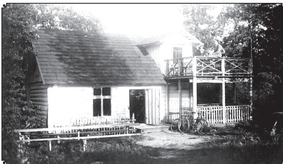
Valkas sporta biedrības tūristu mītne «Gaujaskalni». Valka, 1930.-to gadu 2.puse.