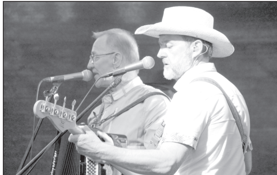
Svētkos apvienojas leģendārā grupa «Bumerangs» un Latvijā titulētākā kantri grupa «Sestā jūdze»