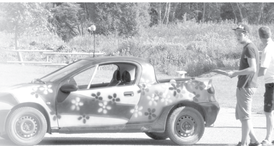
Vitas Keišas mākslinieciski apgleznotajā mašīnā ikviens vēlas izmēģināt veiksmi veiclības braucienā