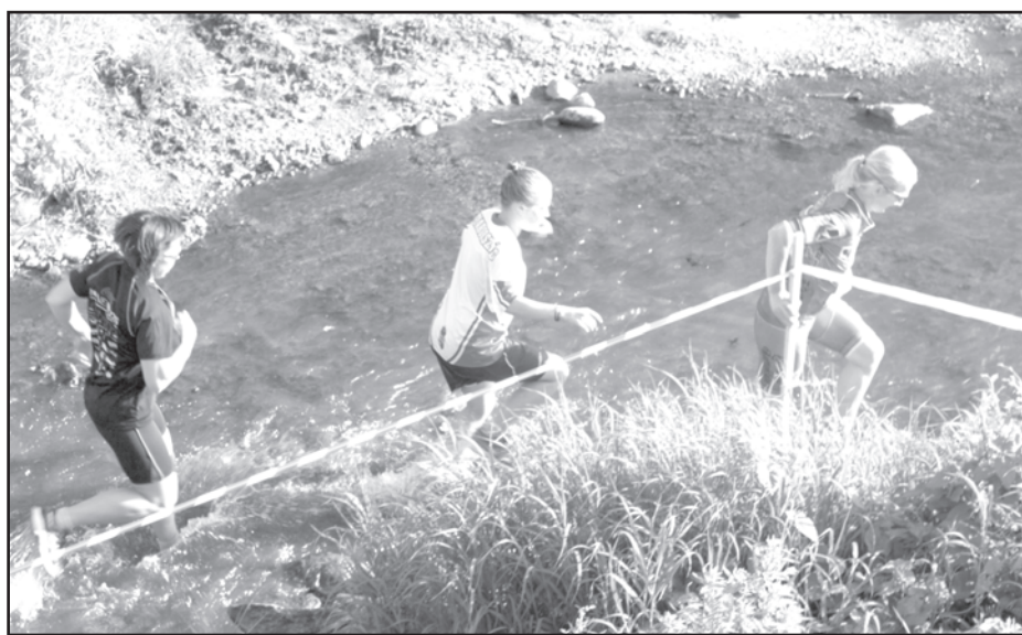
Spraigas emocijas un ovācijas sagādā viena no minitriatlona sastāvdaļām – skrējiens pa Ķires upi