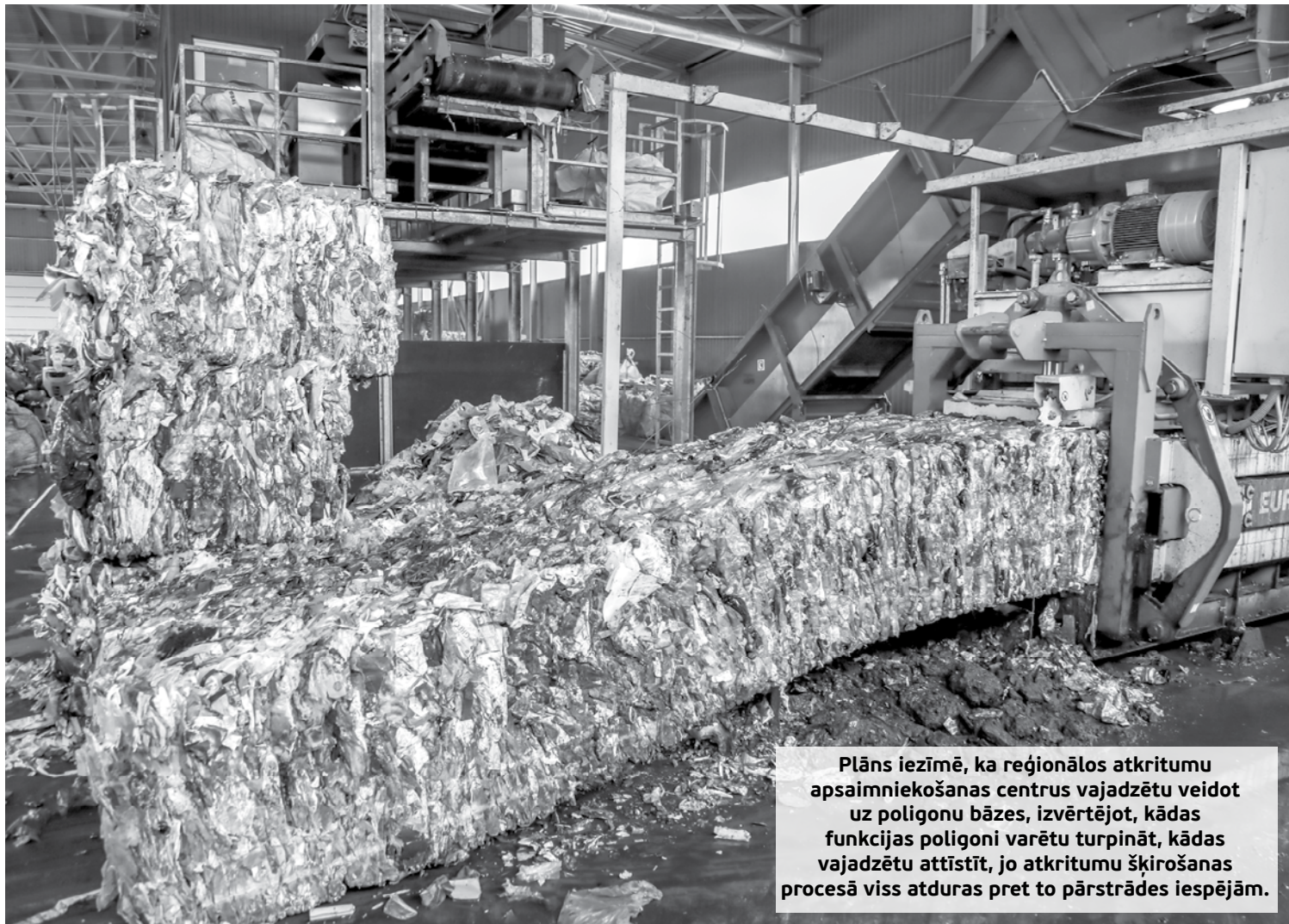
Plāns iezīmē, ka reģionālos atkritumu apsaimniekošanas centrus vajadzētu veidot uz poligonu bāzes, izvērtējot, kādas funkcijas poligoni varētu turpināt, kādas vajadzētu attīstīt, jo atkritumu šķirošanas procesā viss atduras pret to pārstrādes iespējām.

Lielas pārmaiņas gaidāmas teritorijās, tāpēc pašvaldībām izvērtēšanai un reģionālā atkritumu apsaimniekošanas plāna izstrādei dots gana ilgs laiks – līdz nākamā gada beigām, nevis šogad. Skaidrs, ka jaunajām pašvaldībām savā teritorijā būs jāapzina sava saimniecība vispirms, tikai tad var sākt plānot. Bet atkritumu plāna kontekstā ņemām vērā jaunās administratīvi teritoriālās reformas rezultātā radītās novadu robežas. Uz tā pamata izmantotas prognozes par iedzīvotāju skaitu, lai varētu paredzēt, cik liels atkritumu apjoms radīsies.