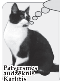
Patversmes audzēkņi Kārlītis

• 21.novembrī plkst. 22.00 Vijciema tautas namā balle, ielūdz «Jautrais bocmanis».