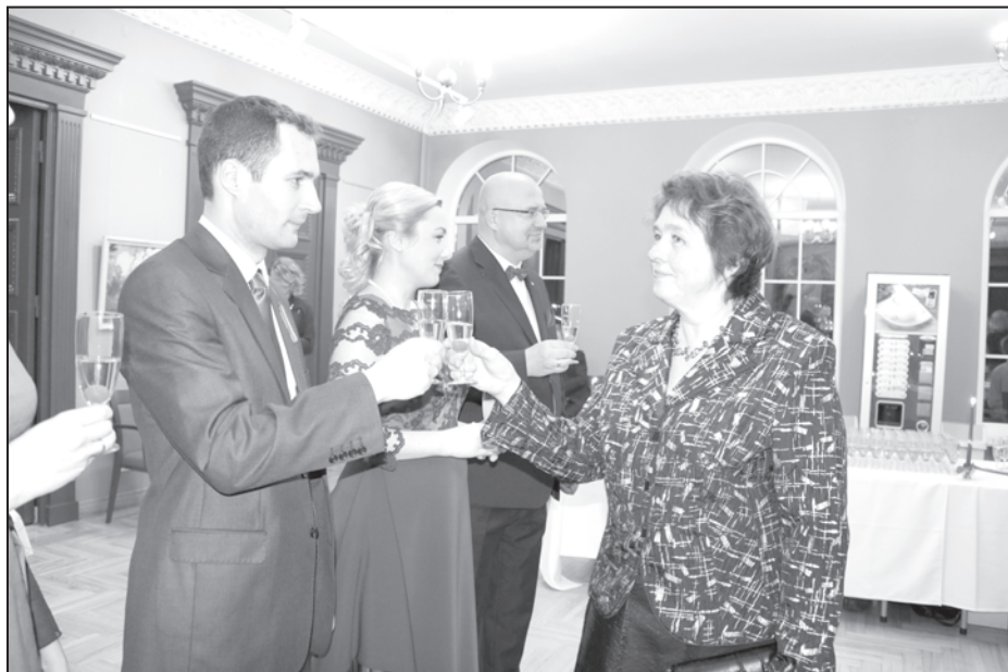
Arī šogad pasākuma neatņemama sastāvdaļa bija svētku tosts ar pašvaldības vadītājiem