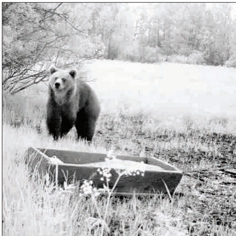
Novada simbols – lācis vēl neguļ.

Oktoobra nogalē un novembra sākumā vairāki Valkas novada iedzīvotāji – mednieki un bitenieki savām acīm pārliecinājās, ka Valkas novada simbols – lācis ir ne tikai novada simbols, bet patiešām pārrauga mūsu teritoriju. Nejauši lāci redzēt izdevās dzinējmedībās mednieku kluba «Kārķi» medniekiem, bet tā nedarbus piedzīvojuši bitenieki, kuriem Omuļos, netālu no Igaunijas robeža, novietoti bišu stropi. Pavasarī unikālu fotogrāfiju Kārķos izdevies iegūt arī medību klubam «Kamene», kas ir neapšaubāms apliecinājums par meža zvēriem, kuri ir ne tikai Sarkanajā grāmatā, bet arī Valkas novadā.