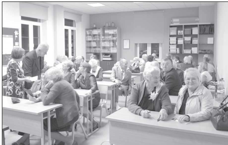
Absolventu tikšanās klasēs skolas jubilejā 3.oktobrī

Šogad Lāčplēša dienu – 11.novembrī – izvēlējamies par projektu dienu, galvenais uzdevums – izziņāt savu pilsētu. Šajā dienā mums bija citāda veida mācīšanās – skolā, Valkas novadpētniecības muzejā, Valkas māks-