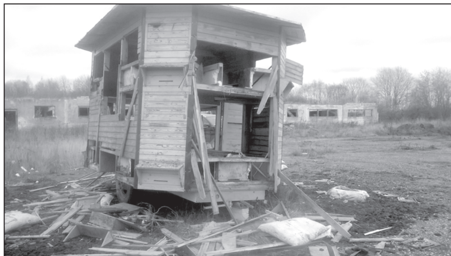
Lāča postījumi.