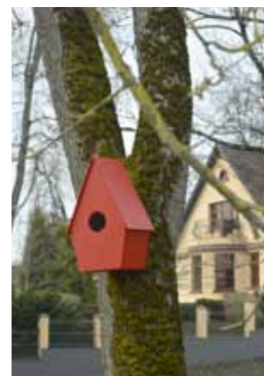
Kuldīgas Pilsētas dārzā aiz muzeja lielie putni var lūkoties, kurā būrītī vit ligzdu.