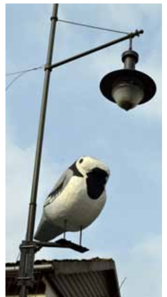
Liepājas ielas stabos salaidušies dažnedažādi putni: sarkankrūtīši, cielas, zilītes un zvirbulēni.