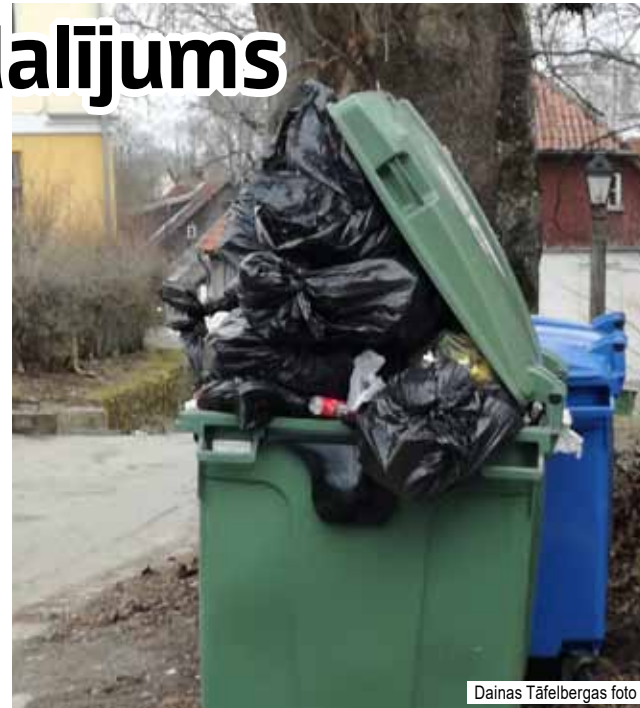
Attālinātā darba dēļ vairāk atkritumu tagad ir dzīvojamajā sektorā.

Pēc KKP speciālista vērojumiem, iedzīvo-