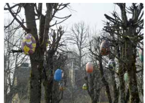
Pie Kuldīgas Mākslas un humanitāro zinību skolas Pētera ielas malā koku zaros vējā šūpojas mākslinieciski apdarinātas olas.