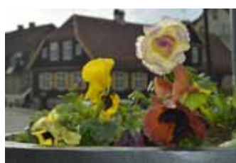
Pavasaris nāk! To apliecina atraitnišu stādījumi.