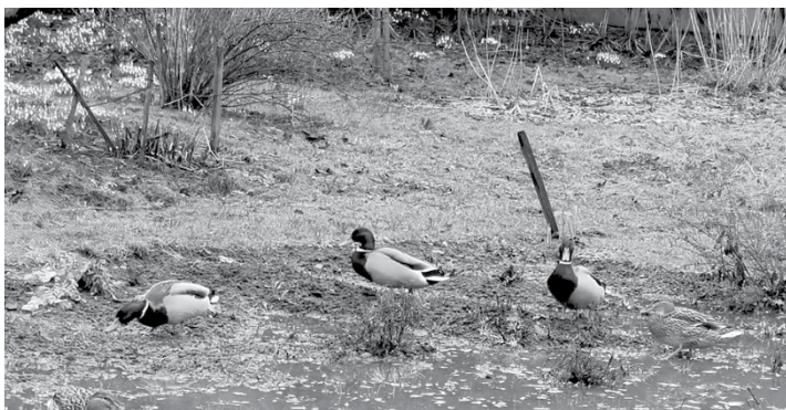
Šajā pavasarī puķu dobē pirmās uzdziedēja pīles.