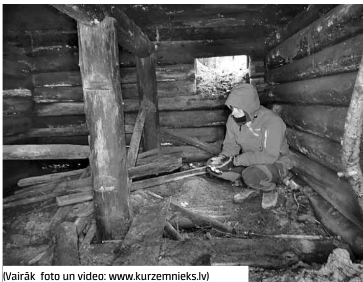
(Vairāk foto un video: www.kurzemnieks.lv )

23. janvārī sākās ceturta kauja, padomju spēkiem mēģinot izlauzties uz Liepāju un Saldu. Liepājas virzienā uzbrūkošajiem izdevās izveidot priekštilta nocietinājumus Bārtas un Vārtājas krastos, bet jau februāra sākumā vācu pretuzbrukums tos likvidēja, un 3. februārī kauja pierima. Pēc Kurzemes virspavēlniecības ziņām sarkanarmieši zaudējuši 541 tanku, ap 100 lidmašīnu un 45 000 kritušo.