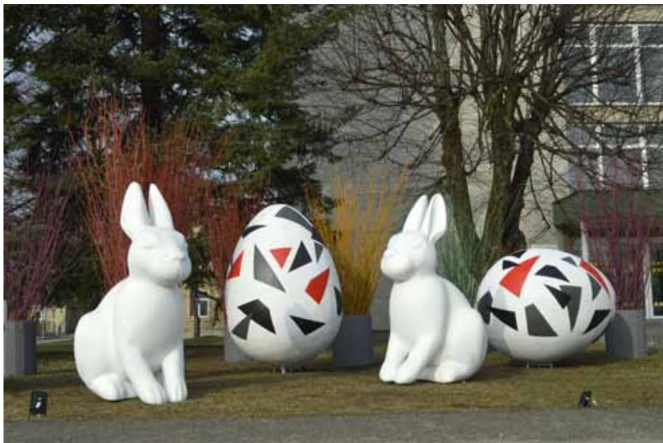
Pilsētas laukuma malā starp olām Kuldīgas karoga krāsās satupuši zaķi.

Tie, kuri vēlas rast svētku izjūtu, priecāties par pavasara tuvošanos, var doties pastaigā pa Kuldīgu.