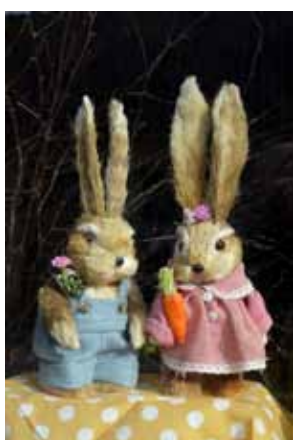
Suveniru veikalā zem Stendera skatlogā ir viss, kas piederas Lieldienu noskaņai.