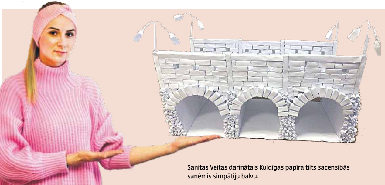
Sanitas Veitas darinātais Kuldīgas papīra tilts sacensībās saņēmis simpātiju balvu.

Šogad viss noticis attālināti un jaunieši strādājuši individuāli. No 50 papīra lapām ar līmes zīmuliem jāuzkonstruē tilts. Pēc tam fināla tiešraidē feisbukā organizatori to noslogojuši, lai pārbaudītu.