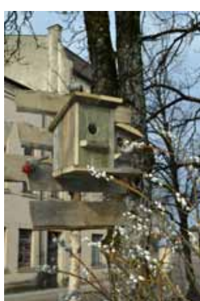
Arī būrišos pie Kuldīgas kultūras centra iemitinājušies putniņi.