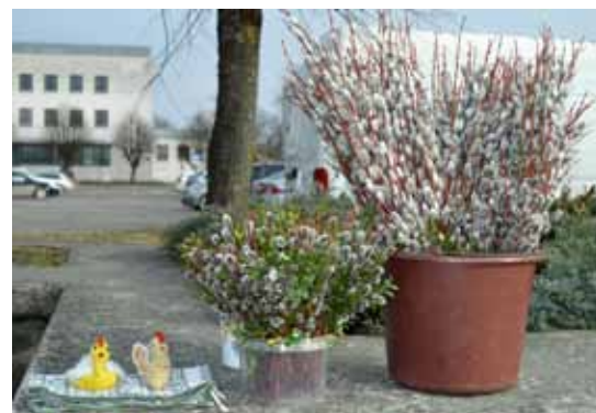
Rotāties Pūpolsvētdienai piedāvāja puķu tirdziņa pārdevēji.