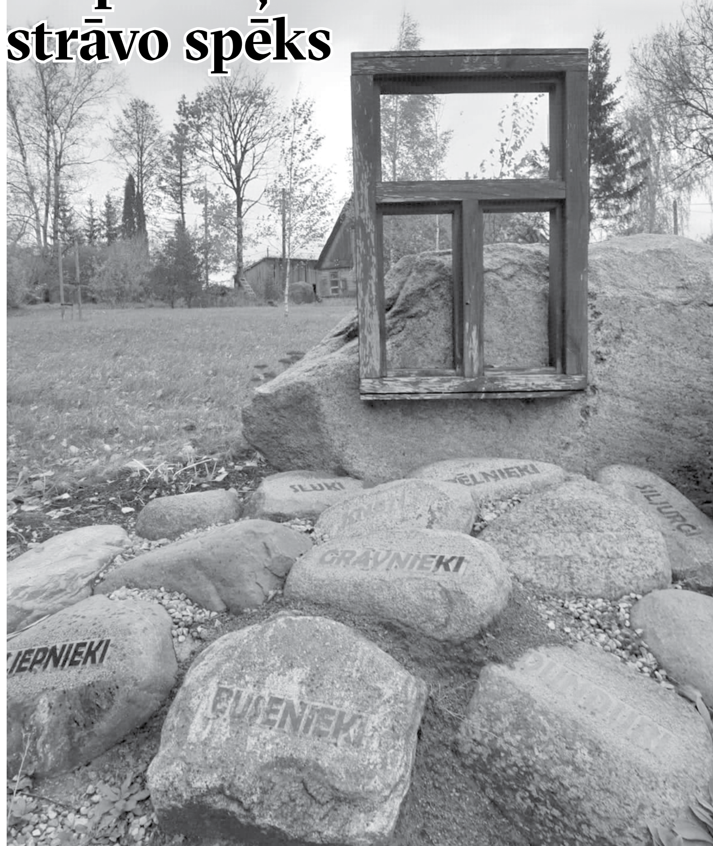
Represēto piemiņas vieta Saldus novada Lutriņu pagastā. Nosauktas visas mājas, no kurām 1991. gada 14. jūnijā un 1949. gada 25. martā deportēja iedzīvotājus.