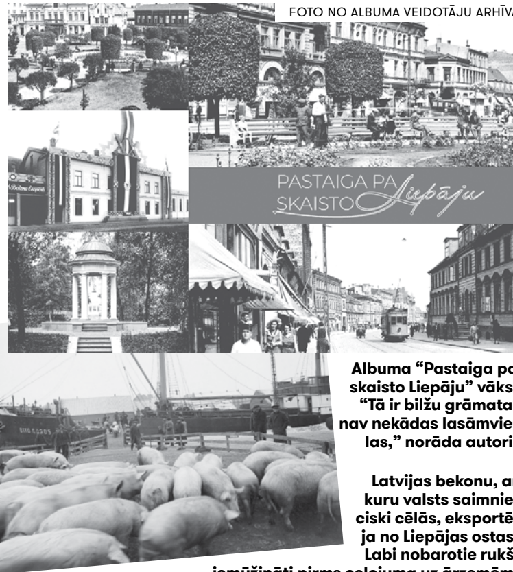
PASTAIGA PA SKAISTO Liepāju

Albuma "Pastaiga pa skaisto Liepāju" vāks. "Tā ir bilžu grāmata, nav nekādas lasāmvielas," norāda autori.