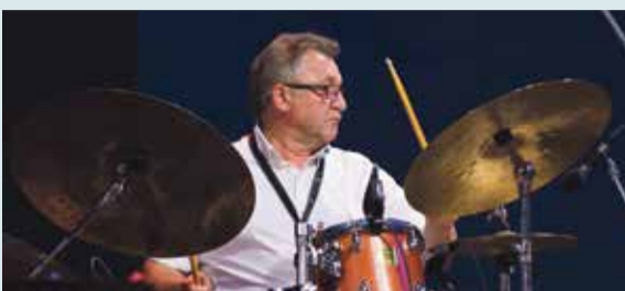
Saulkrasti – pilsēta, kurā visvairāk ir iecienīts džezs!