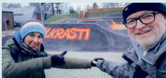
Aizvadītais gads Saulkrastu TIC