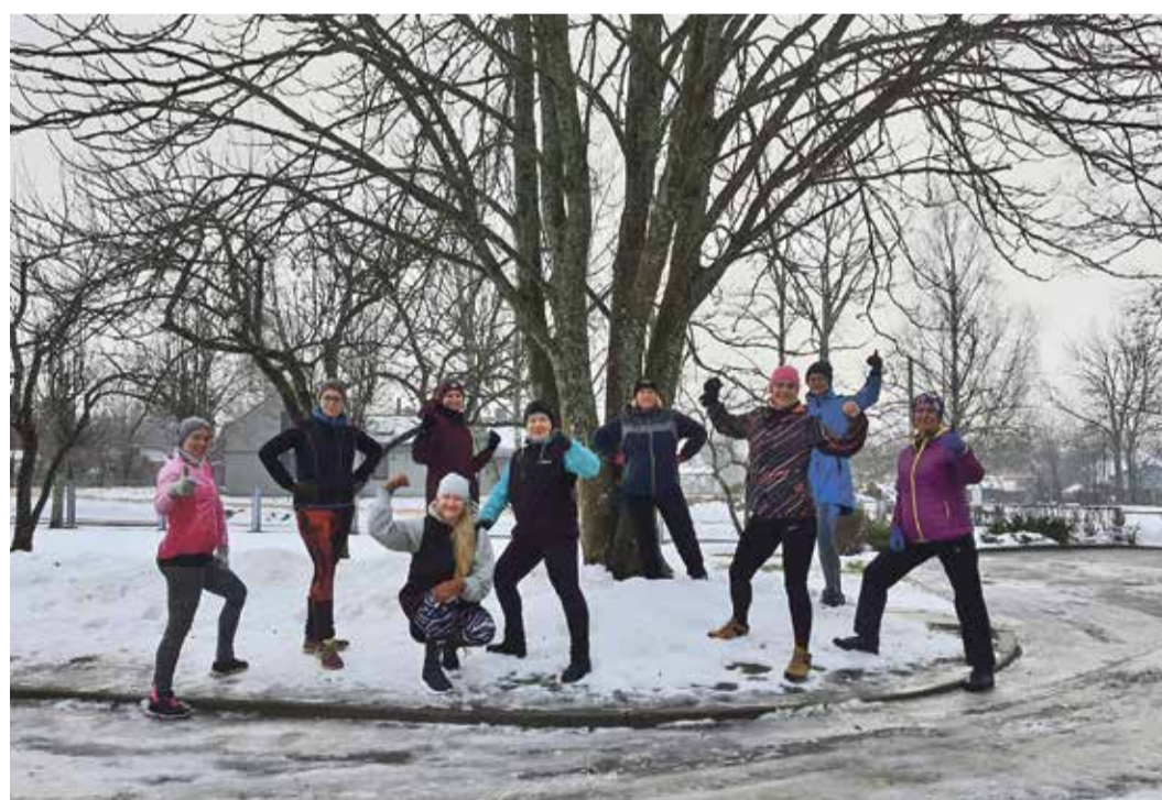
Funkcionālie veselības veicināšanas treniņi tiek aizvadīti svaigā gaisā! Foto: Atis Heinols

Hokeja laukuma noteikumi un grafiks ir izvietots pie laukuma un Sporta un ģimeņu centra ieejas durvīm! Iautājumu un neskaidrību gadījumā lūgums sazināties ar Saulkrastu sporta un ģimenes centru pa tālruni 26600632. Foto: Atis Heinols