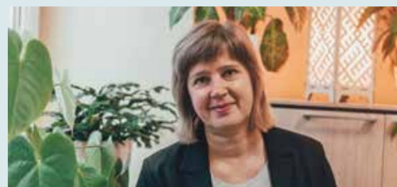
Saulkrastu novada bibliotēka – vieta, kur smelties iedvesmu