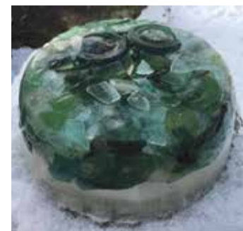
Sniega un ledus dekors.