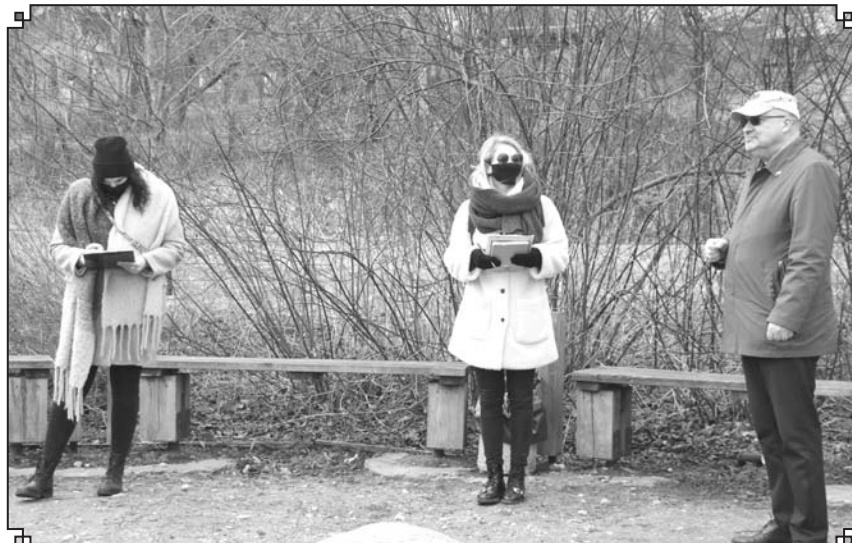
Par šīs publikācijas saturu pilnībā atbild autors un tā neatspoguļo Igaunijas - Latvijas programmas vadošās iestādes oficiālo viedokli. ☞