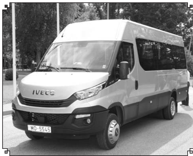
No 2020. gada 1. septembra Valkas pagasta izglītojamais uz skolu ved jauns autobuss. Neskaitot šoferu vietu, autobusā ir 20 sēdvietas.

2018. gadā vasarā tika veikti apkures katlu rekonstrukcijas un katlu māju pārbūves darbi Valkas pagasta Sēļos, kur veco ar malku kurināmo katlu vietā tika uzstādīti jauni automatizēti granulu katli.