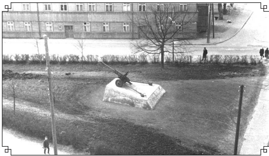
Piemineklis Lielgabals. Fonā Rīgas (tolaik Ļeņina) – Tālavas ielu krustojums un ēka Rīgas ielā Nr. 16 pirms pārbūves. Valka, 1970. gada 20. jūnijs

Vairāki cilvēki atceras dzirdējuši (galvenokārt baumu līmenī), ka reiz stobrs bijis pagriezts citā virzienā. Tas varēja būt noticis 1970. gadu otrā pusē. Visticamāk tas nav noticis politisku motīvu dēļ. Iespējams, to izdarījis kāds «nekaitīgs» 2. pasaules kara veterāns. Viņš mēdzis kāpt augšā pie lielgabala un imitēt kaujas darbības.