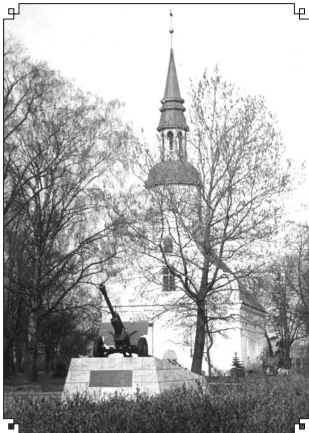
Piemineklis Lielgabals Lugažu baznīcas priekšā. Valka, 1970. gadi.

Šis kaujas ierocis kā magnēts pievilināja zēnus. Viņi tur labprāt spēlējās, lai gan tika raidīti prom.