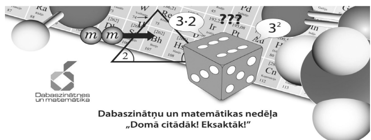
Dabaszinātņu un matemātikas nedēļa „Domā citādāk! Eksaktāk!”