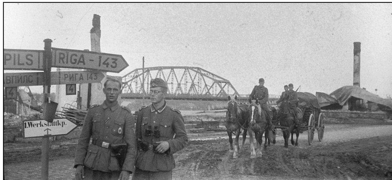
1941.g. uzspridzinātais Jēkabpils-Krustpils tilts.