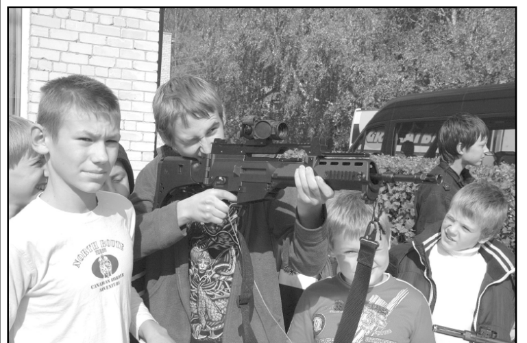
Gan zēni, gan meitenes varēja piedalīties „Vīru spēlēs” - formastērpu un ieroču demonstrējumi sadarbībā ar LR Aizsardzības ministrijas Rekrutēšanas un jaunsardzes centru.