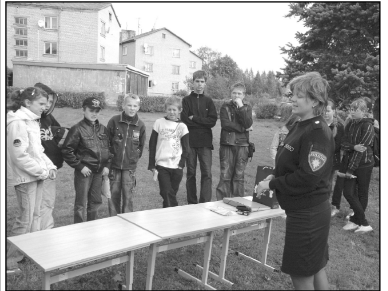
Sadarbībā ar Jēkabpils iecirkņa Kārtības policijas nodaļu pamatskolas skolēni varēja risināt krustvārdu miklas, likt puzzles, pildīt testus un saņemt informāciju „Tava drošība - mana drošība”.