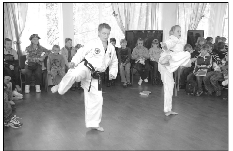
Sākumskolas skolēniem bija iespēja piedalīties „Cīņas māksla drošībai un veselībai”, kur savas prasmes demonstrēja „Tae Kwan - Do” kluba biedri.