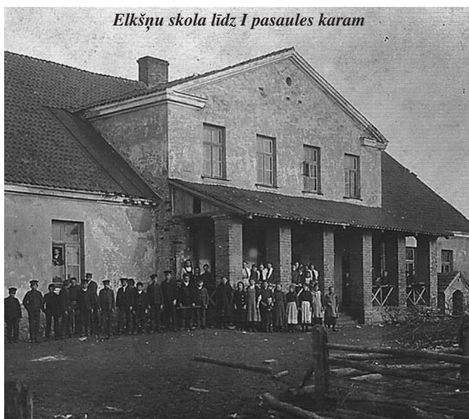
Elkšņu skola līdz I pasaules karam