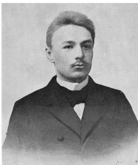
Rakstnieks, dzejnieks Jānis Akuraters (1876. - 1937.) - skolotājs Elkšņu pagastskolā (1898.)