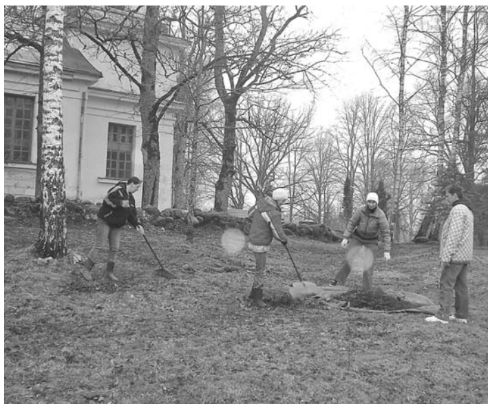
Pie Dižozola vietas sakopšanas tika piesaistīti ne tikai cilvēku resursi, bet arī tehnika