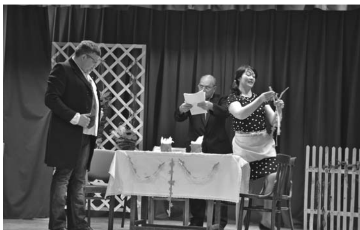
Fragmenti no izrādes „Ministrs no laukiem” teātru festivālā „Āksts” Variešu kultūras namā.

Viesītes kultūras pils amatierteātra režisore A. Rancova