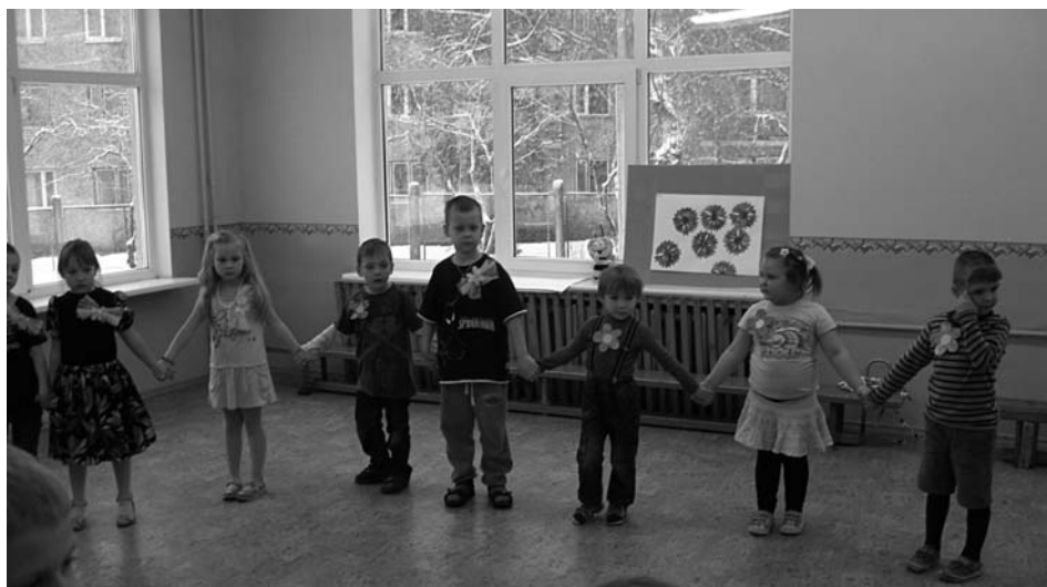
„Bitītes” un „Rūķīši” rudzupuķu pļavā