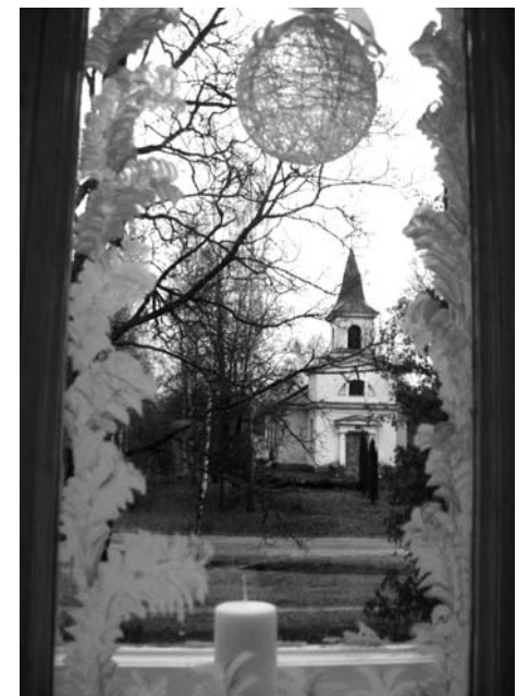
Fotogrāfija: Elkšņu gadu mijā nezināmā krustcelēs.

Aiz maskas tika paslēpti visi trūkumi – kautrīgā kļuva par visdelvērīgākajiem kavalieriem, augumā mazie iztaisījās par Garo cilvēku, tie, kam tukšums kabatā, ģērbās par bagātņiekām. Šobrīd ļoti aktuāls tēls - Jaunais Eiropas lauksaimnieks: skotu svārciņos, latvisku kreklu ar tautiskiem izšuvumiem, pār plecu divas lāpstas sastiprinātas tā, lai var rakt ar abiem galiem... Tādu masku savulaik izdomājis viens Elkšņu zemnieks. Jā, lauciniekiem vēl piemīt humors! Ar to arī dzīvosim Jaunajā gadā!