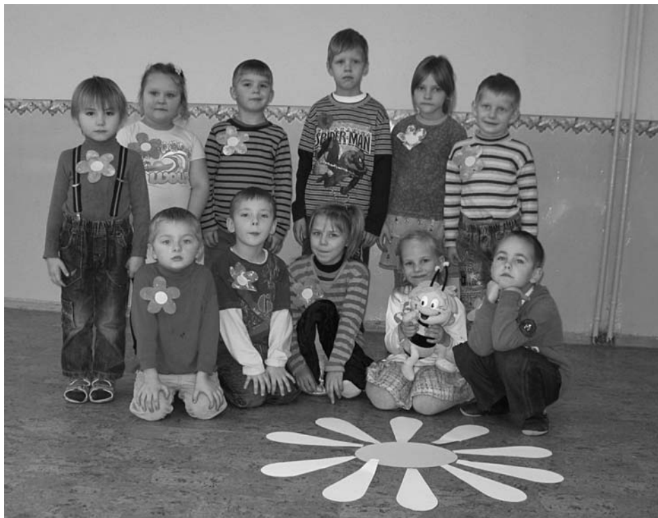
„Rūķīšu” grupas puķītes kopā ar bitīti