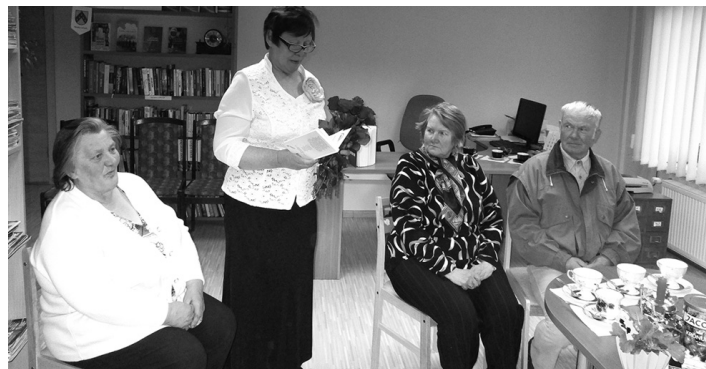
Ikvienam tikšanās dalībniekam dāvanā sarkanā roze