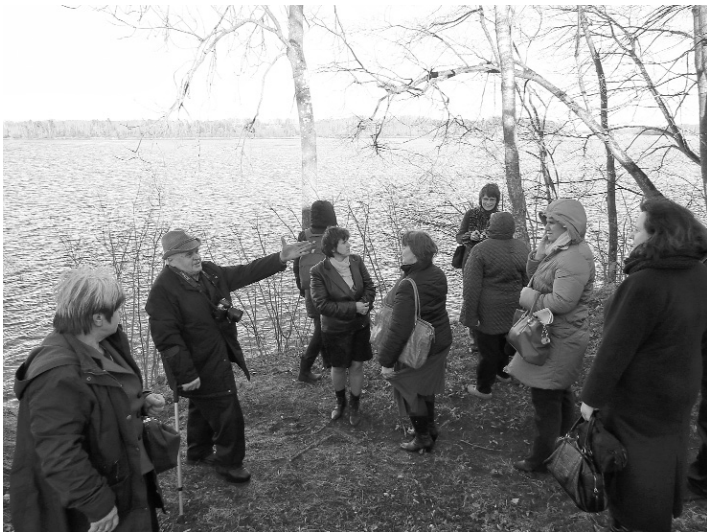
Jaunjelgavas novadā pie Daugavas