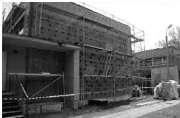
Būvniecības darbi Rites pamatskolā.

Projekta KPMF - 15.2/77 „Kompleksi risinājumi siltumnīcefekta gāzu emisiju samazināšanai Rites pamatskolā” ietvaros SIA „PRO DEV” līdz