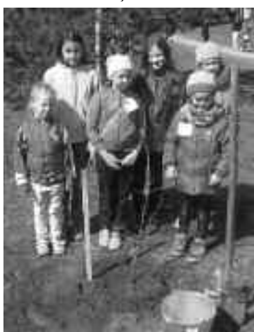
Meitenes stāda ozolus.