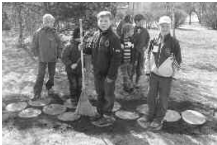
Zēni ierīko klasišu lekšanas laukumu.