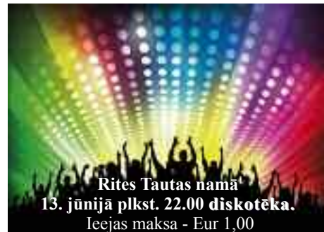
Rītes Tautas namā 13. jūnijā plkst. 22.00 diskotēka. Ieejas maksa - Eur 1,00