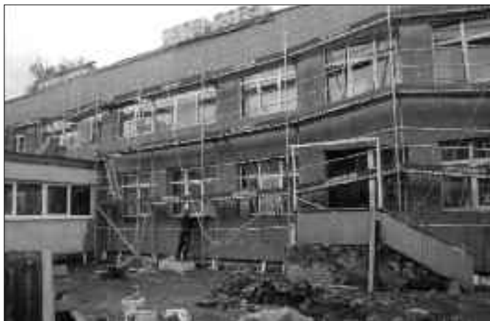
Būvniecības darbi PII „Zilīte”.

šī gada 30. aprīlim ir veikusi daļējus demontāžas darbus, daļēju fasādes sienu siltināšanu, daļēju pagraba pārseguma siltināšanu, daļēju jumta pārseguma siltināšanu un jumta seguma atjaunošanu, daļēju veco logu un durvju nomaiņu, daļējus cokola sienu siltināšanas darbus. Plānoto būvniecības darbu gaitu Rites pamatskolā uzrauga un pašvaldības intereses pārstāv būvuzraugs Arnolds Dalka (SIA „Wars+”), savukārt autoruzraudzību veic Gundega Ābelīte (SIA „Ēkas siltināšana”).