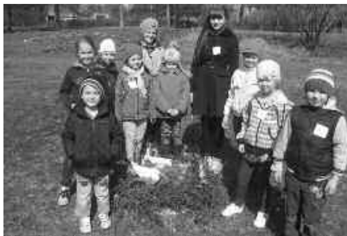
Prieks par paštaisītajiem Lieldienu dekoriem.

projektiem, mazpulcēniem būs iespēja piedalīties SIA „Baltijas dārzeni”, SIA „Amazone” un SIA „Pūres dārkopības pētījumu centrs” rīkotajos pasākumos.