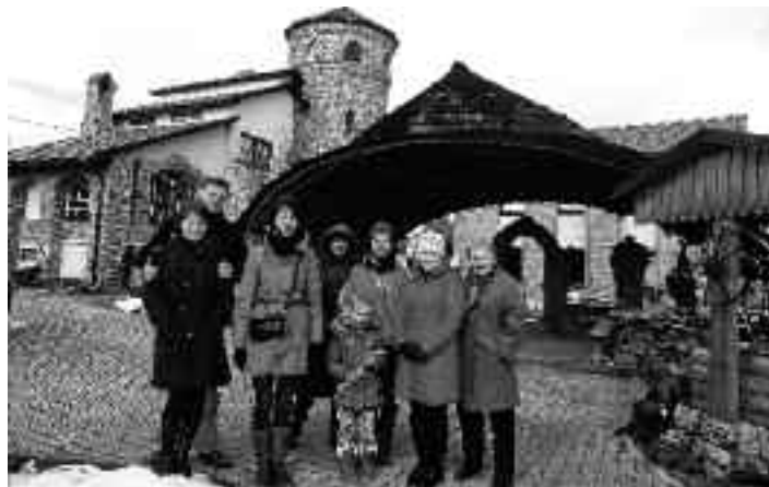
Sirsnīga uzņemšana viesu namā „Pie torņa” Ilūkstē.