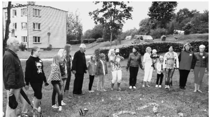
Baltijas ceļa atceres pasākumā.