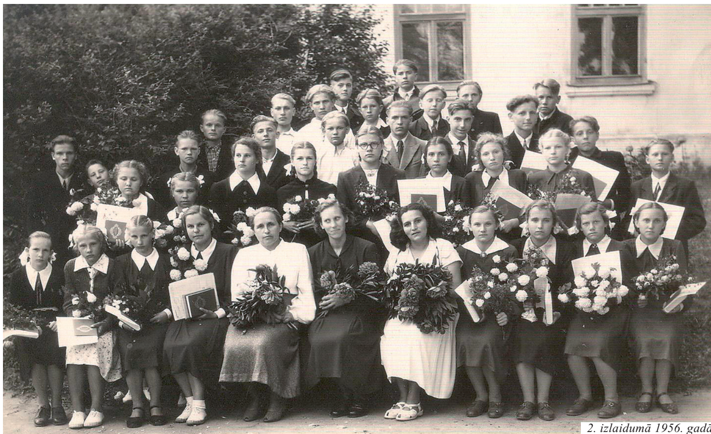
2. izlaidumā 1956. gadā