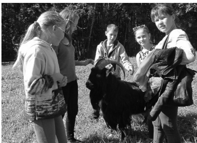
Apmetnē pie Mazormaņu sētas pusaudži sastopas ar draudzīgiem mājdzīvniekiem. Āzītim Miškinam patīk fotografēties kopā ar bērniem.

Kas apmeklētājus saista šajās vietās? Ormaņkalns – augstākā virsotne Sēlijas valnī (167 m v. j. l.), bet pēc relatīvā augstuma (86 m) viens no desmit augstākajiem pauguriem Latvijā. Aizraujoša ir kāpšana augstākajā virsotnē pie Kalna Druvām, bet Līgo kalniņš sajūsmina ar plašiem skatiem uz dūmakā tītājām tālēm un gleznaino Saukas ezeru. Vietējo saimnieku rūpīgi kopta ainava, senču dzīves ziņa un saglabātās pagātnes liecības. Tālivalža gravā plašas izzināšanas iespējas, iepazīstot nogāžu un gravu meža tipu. Dažādi koki, daudzveidīga augu valsts, tai skaitā daudzi indīgie augi. Ekskursantiem piedāvājam aprēķināt dižozola apkārtmēru, paklausīties stāstus par interesantiem veidojumiem un norisēm dabā. Var mēģināt ieraudzīt, kur paslēpies Meža gariņš, noteikt augus pēc to smaržas, garšas, ar taustes palīdzību. Pusaudžiem visaizraujošākie šķiet dažādie virvju šķēršļi – Drosmīgo pāreja, nobrauciens sēdeklītī pāri gravai, Tarzāna lidojums. Pieaugušie nesteidzīgā pastaigā var klausīties meža skaņās, vēju balsīs, strauta burbuļošanā vai izlasīt kādu noderīgu faktu informatīvajās lapiņās, kas izvietotas takas malās. Labiekārtotā apmetnē Mazormaņos var iekurt uguns-kuru, uzvārit tēju, uzcept desinās, ieturēt maltīti. Dažiem šķiet neticami, ka uz āra pavarda var izcept pankūkas! Svaigā gaisā garšo labi. Kad visi paēduši, gribas padraiskoties ar draudzīgiem mājdzīvniekiem - suns Robis labprāt sagaida bērnus un dod ķepu, āzītis Miškins, nesatricināmi cēls un mierīgs, ļauj pakasīt aiz auss.