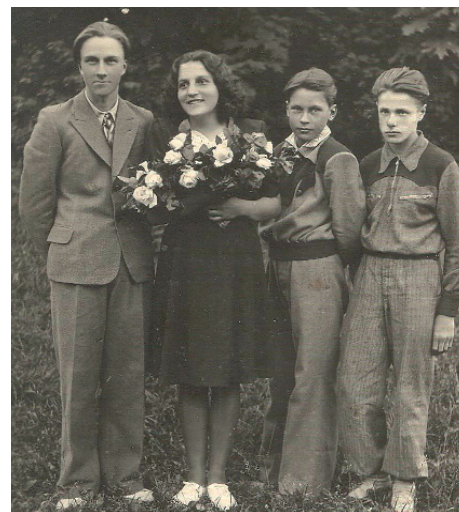
Ar 1. izlaiduma bērniem 1949. gadā