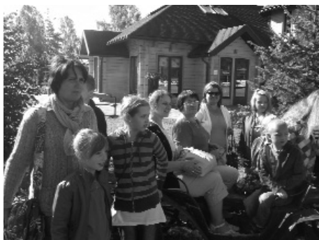
Pie Liepkalnu maizes ceptuves.