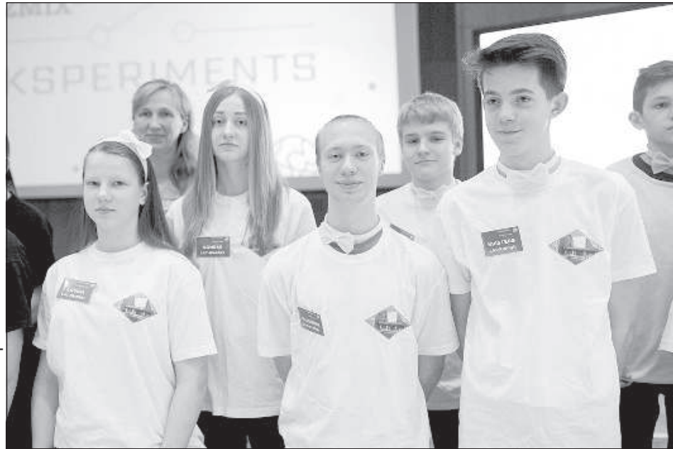
Полуфинал конкурса «Fizmix эксперимент» в Риге, 2017 год. Теперь эти школьники уже студенты первых курсов разных высших школ Латвии.

«Лучше один раз увидеть, чем сто раз услышать!» – считает педагог и отправилась в организованные LFSА поездки посмотреть Чернобыльскую АЭС и коллайдер CERN в Женеве, чтобы потом о них рассказывать своим ученикам.