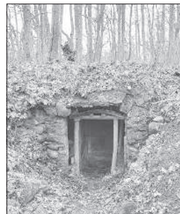
Кое-что осталось со времен помещиков.

рожную станцию (в 1932 году была построена станция «Презма» между «Малтой» и «Пуполи») присылали карету. Во время поездки бросал стоявшим по обочинам дороге крестьянам деньги, поэтому холм недалеко от кладбища прозвали Денежным.