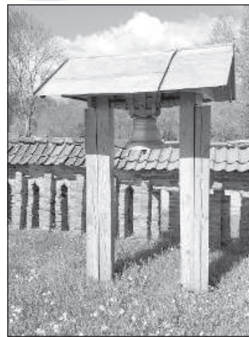
Колокол возле Презмского костела (2020).

тское поселение, поселок Малта был чуть поодаль, возле моста через реку, его в 1937 году переименовали в Силмалу. 16