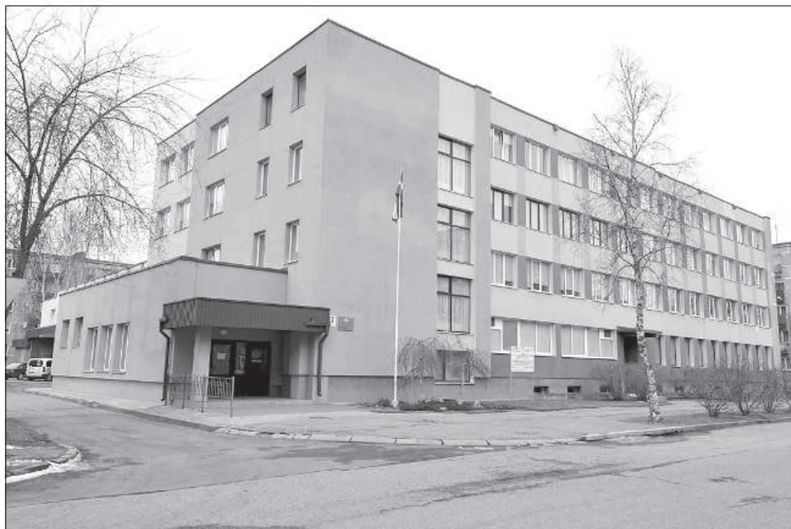
Даугавпилсская Торговая профессиональная средняя школа.

В следующем периоде, при пересмотре критериев ДТПСШ, особое внимание будет уделяться тому, как школы с хорошей инфраструктурой и базой реализуют предложение образования для взрослых, чтобы обеспечить заказы работодателей, и как развивают востребованное на рынке труда обучение. ■