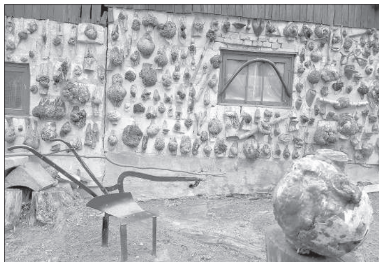
Необычные декорации чагой.