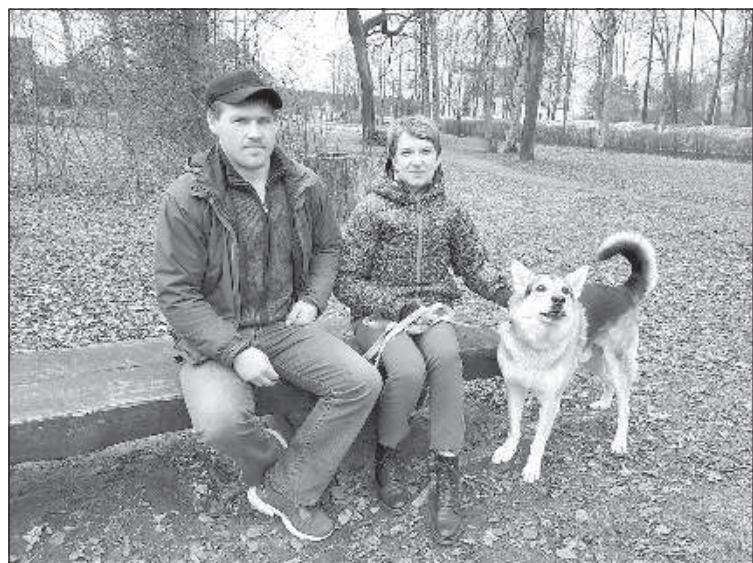
Барон близко не подпустит.

Краслава — очень красивый город, со своим ритмом и шармом, в котором непременно стоит побывать. ■