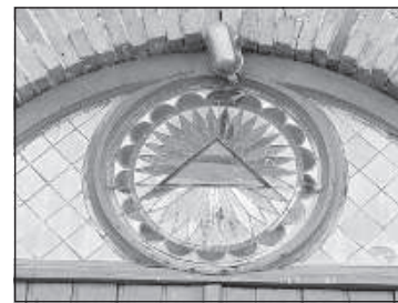
Витраж над главным входом в храм.