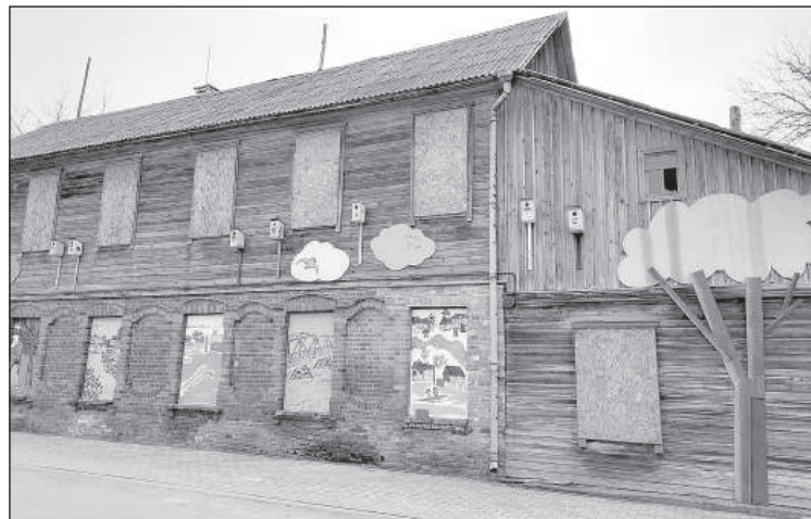
Новая жизнь ветхого здания.