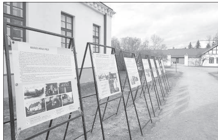
Выставка, на которой не заразишься.