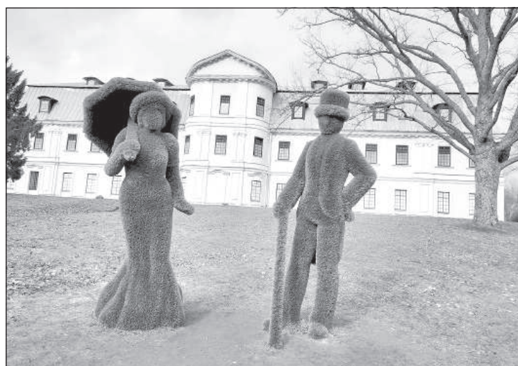
Граф и Графиня рады гостям!