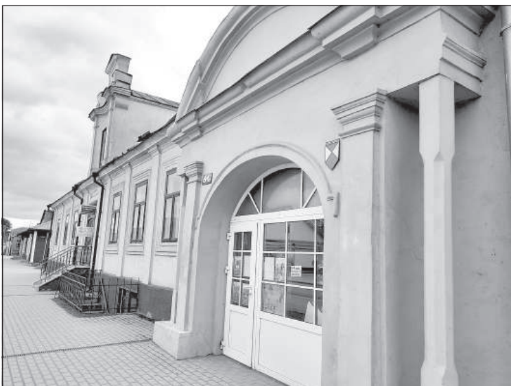
Здания, которые отстоят еще не один век.

История сохраняется, а не преобразуется под современный стиль. Возле Даугавы сохранена старинная каменная дорога. Старые дома часто поддерживаются в первозданном виде. Именно эти факты привлекают в Краславу творческих людей, реализующих свои проекты здесь, в этой местной атмосфере.