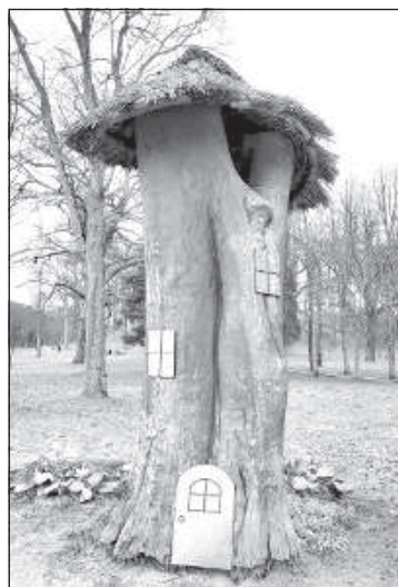
Сказочное настроение живет здесь!