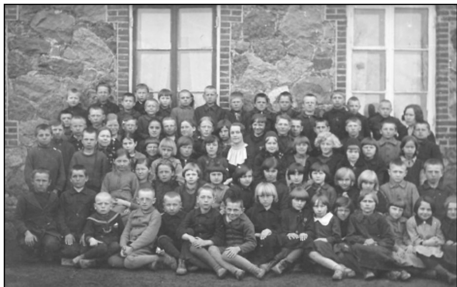
Vīpes sešklasīgās pamatskolas 1. klasē (1. rindā 2. no kreisās) (1937.)