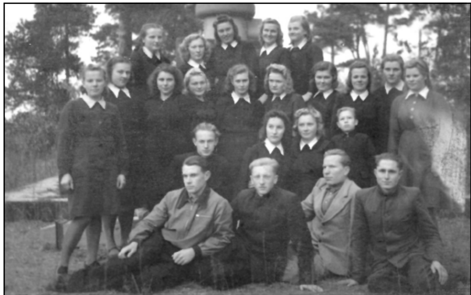
Līvānu ekonomiskā tehnikuma 4. kursa audzēknis. (1944.)