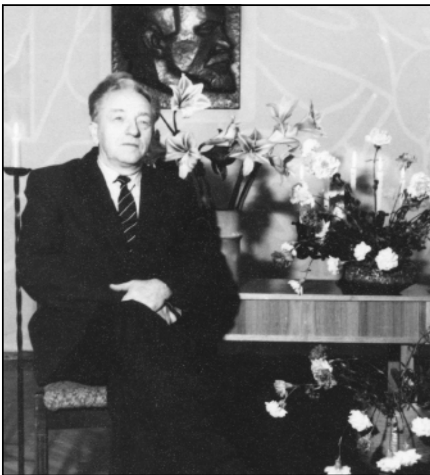
Jēkabpils sovhoztehnikuma direktora vietnieks mācību darbā 60 gadu jubilejā (1988.)