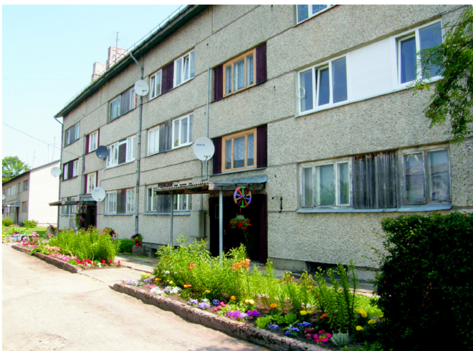
Uzvarētājs daudzdzīvokļu māju nominācijā – „Vārieši”.