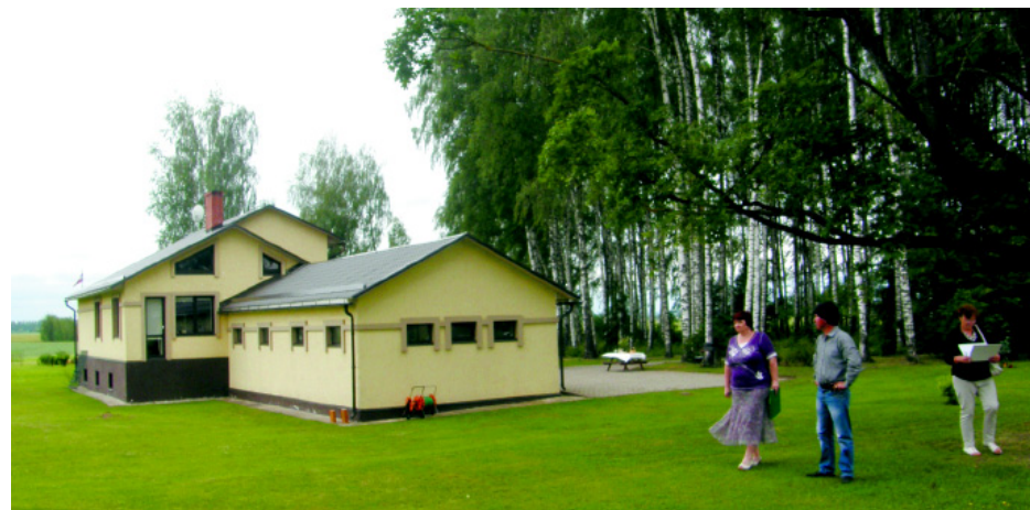
Konkursa uzvarētāja - Kūku pagasta „Ošumāja”.