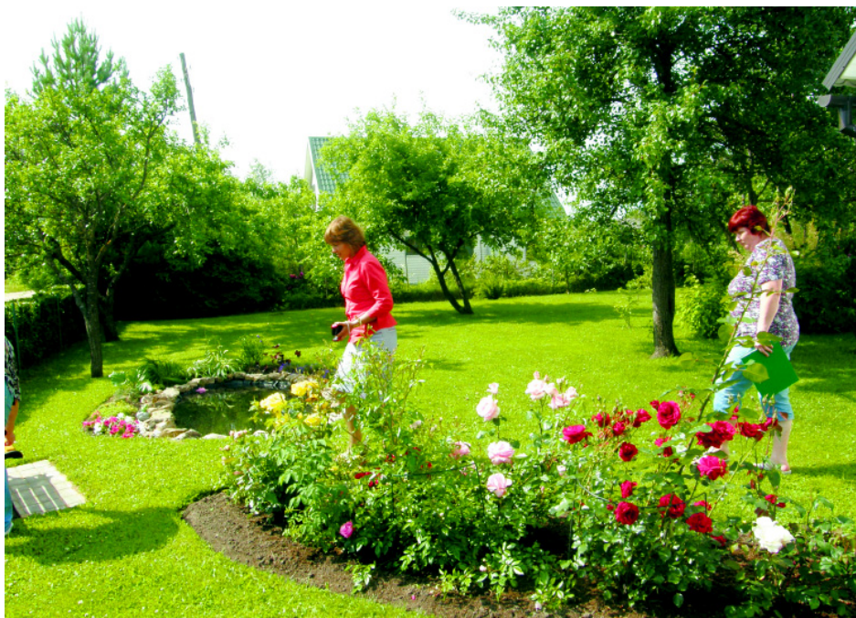
Komisija iepazīstas ar Labāko individuālā māja ciematos - Krustpils pagasta „Veldzes”.