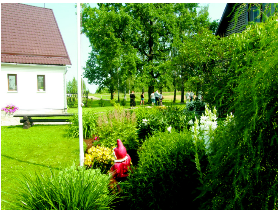
Uzvarētāja Lauku sētu nominācijā - Vāriešu pagasta „Lauri”.