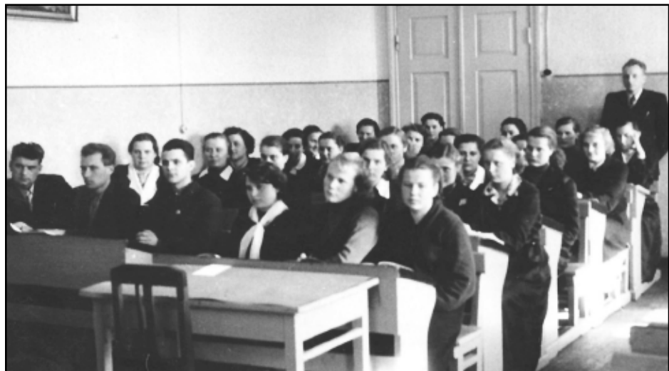
Jēkabpils ekonomiskā tehnikumā pasniedzējs 1. kursam (1960.)