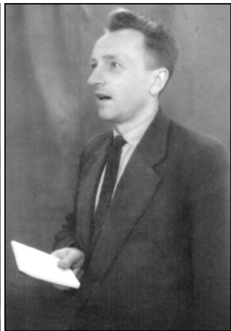
Jēkabpils ekonomiskā tehnikuma direktora vietnieks mācību darbā. Paralēli arī lektors – starptautnieks (1962.)

laikos. Izdevās iepazīties ar inteligentu pēterburdiešu (tolaik Ņeņingradiešu) ģimeni. Vienojāmies par maiņu. Vasarā viņi ar visu ģimeni visu atvaļinājuma laiku – kādu mēnesi, dzīvoja pie mums, bet mēs no viņiem saņēmām viņu pilsētas dzīvokļa atslēgas un to pašu mēnesi nodzīvojām Ņeņingradā. Sabrūkot Padomju Savienībai, šie kontakti zuda. Taču interese par viesu uzņemšanu bija radusies.