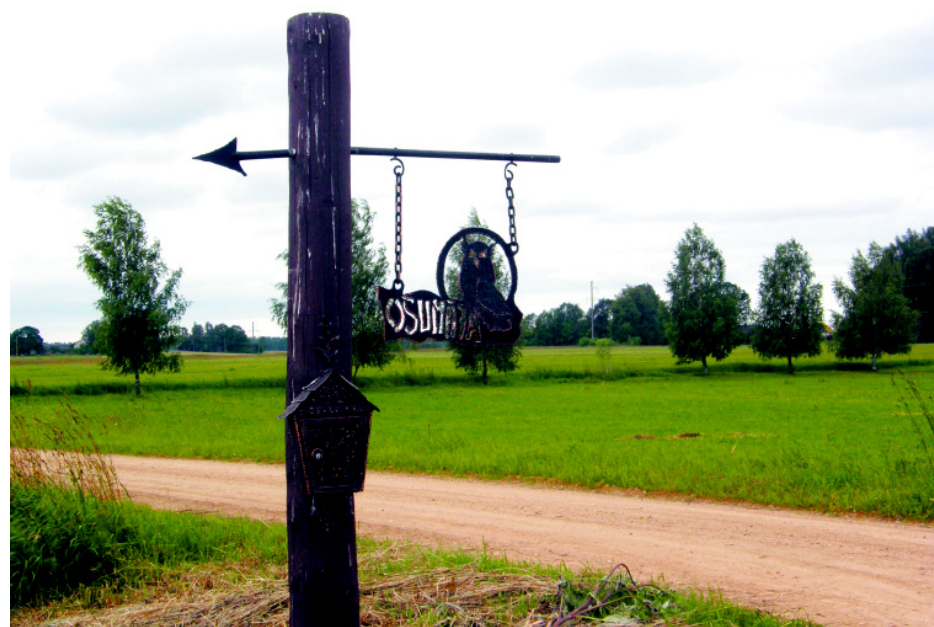
Pagrieziena uz „Ošumāju”.