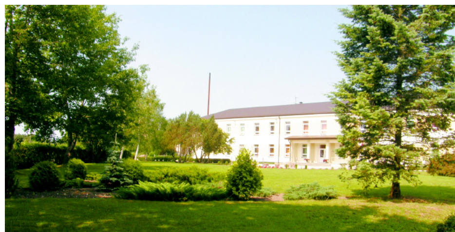
Uzvarētāja Pašvaldības iestāžu nominācijā - Antūžu speciālā internātpamatskola.