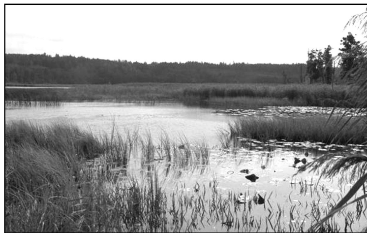
Silabebru ezers

Kopš šī gada pavasara Krustpils novada pašvaldība kā viens no partneriem realizē projektu LLIV – 316 „Protected Areas” jeb pilnajā nosaukumā „Īpaši aizsargājamo dabas teritoriju Zemgalē un Ziemeļlietuvā apsaimniekošanas uzlabošana, radot ilgtspējīgu pamatu dabas teritoriju saudzīgai apsaimniekošanai un dabas vērtību saglabāšanai”, kas tiek ieviests ar Latvijas – Lietuvas pārrobežu sadarbības programmas 2007.-2013.gadam atbalstu.