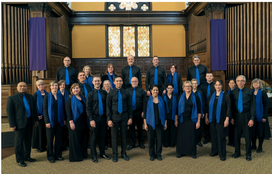
Čikāgas koris Lux Cantorum

Nora Ikstena: “Kultūra mums ļaus iziet cauri šim laikam, kas mūs ir nospiedis uz ceļiem. Gara maize ir vajadzīga tieši tikpat daudz kā dienišķā maize – lai mēs no šīs pandēmijas neizietu kā aprobežoti, nospiesti, savu garīgo neatkarību zaudējuši cilvēki. Ja mums, latviešiem, kāds no malas, no citurienes skaidri parāda, kur ir mūsu spēks, ko mēs varam padarīt, tad kaut kā tomēr noticam un saņemamies... Jā, ir grūti iziet cauri šim laikam, bet, ja cilvēki no tāienes mums pasaka – jūs varat, jūs esat unikāli! – mums vajag to novērtēt un iet uz priekšu.”