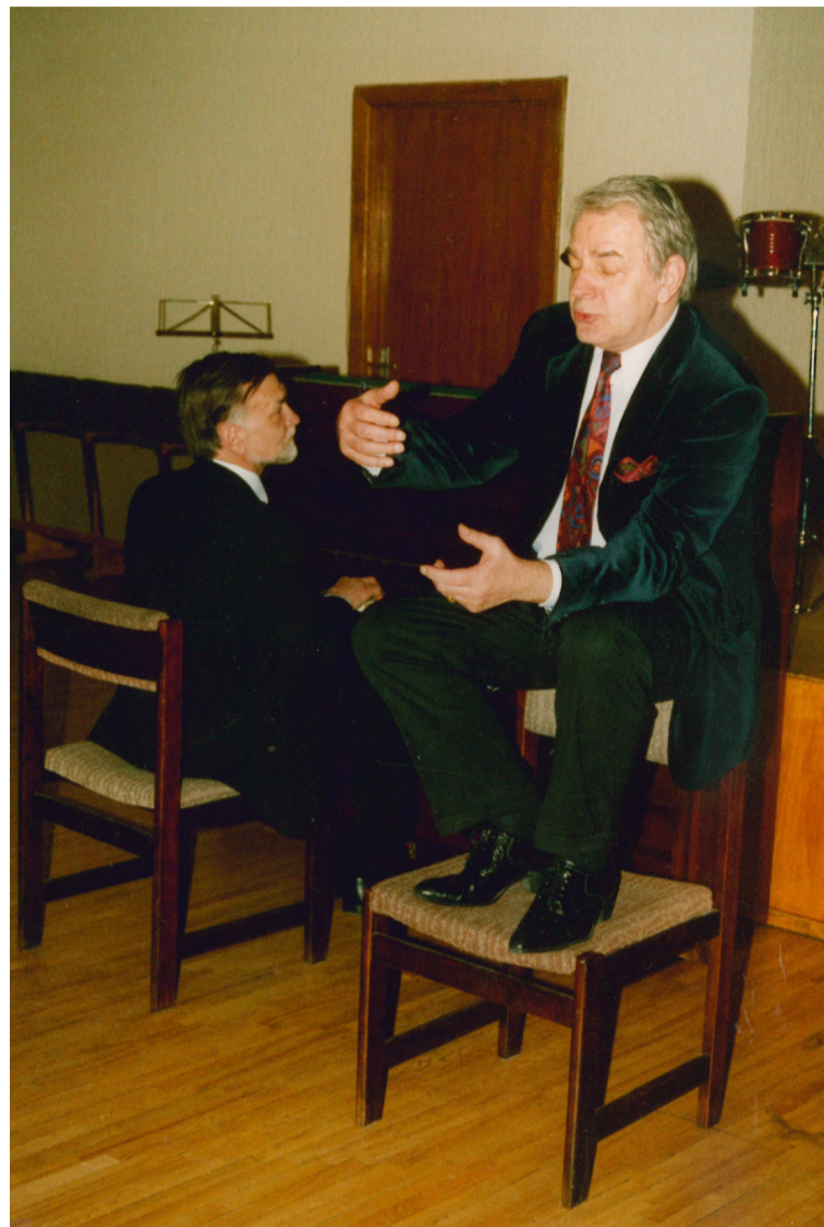
"Tinu nakti un tinu dienu - nu mans kamols ir gadiem biezs..."