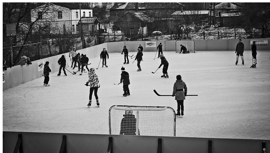
Pateicoties jauniešiem, aizvadītajā gadā Viesītes pilsētā tapis hokeja laukums.

Viesītes novada pašvaldības Sabiedrisko attiecību speciāliste L. Liepiņa Autores foto