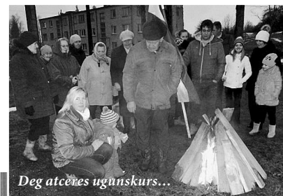
Deg atceres ugunskurs...