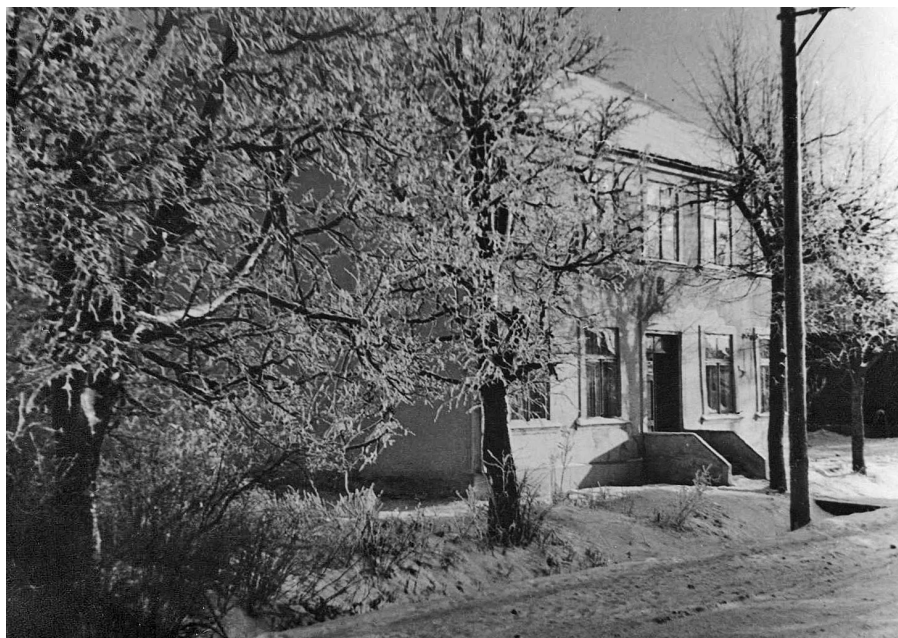
Ambulance Raiņa ielā 39.

slēgta arī pilsēta. Elektrību padeva no plkst. 6.00 līdz 23.00. Arī Viesītes slimnīcas ēka bija pieslēgta pie šī elektrības avota. No 1955. gada Viesīti pieslēdza Ķeguma elektrostacijai, tad elektriskā strāva bija pastāvīga.