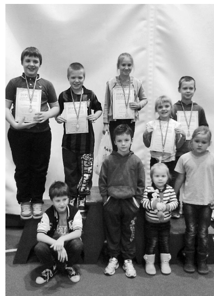
Viesītes Sporta skolas audzēkņi Livānos 26. novembrī.

15. janvārī Jēkabpils 3. vidusskolā norisinājās Jēkabpils Sporta skolas atklātās sacensības vieglatlētikā „C” grupai un atlases sacensības Jēkabpils zonā uz Latvijas čempionātu, kas notiks 1. februārī Rīgas Sporta manēžā. Sacensības notiek četrās zonās - Kuldīgā, Jēkabpilī, Limbažos un Rīgā. Jēkabpils zonā spēkiem mērojās sportisti no