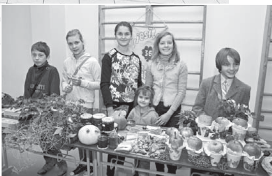
Viesītes mazpulcēni Latvijas novadu forumā Jēkabpilī.

Pie darbiem ar šādiem nosacījumiem pavasarī ķērās Viesītes mazpulcēni. Bērni apņēmas audzēt avenes, sīpolus, magones, ķirbjus, burkānus, labiekārtot mājas pagalmu, pētīt lopbarības sagādi ziemai un piedalīties tās sagatavošanā. Šogad vasara