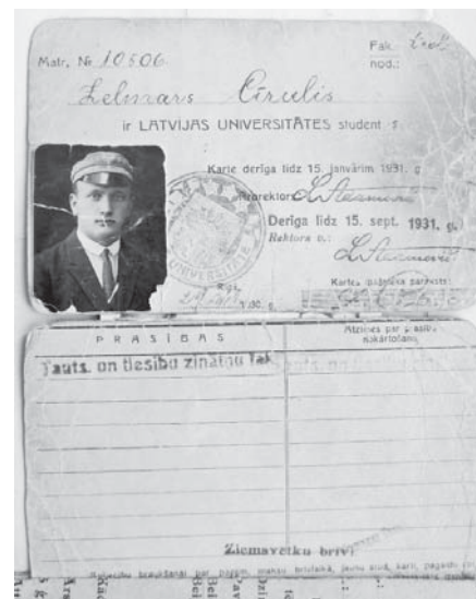
Zelmāra Cīruļa LU studenta karte.