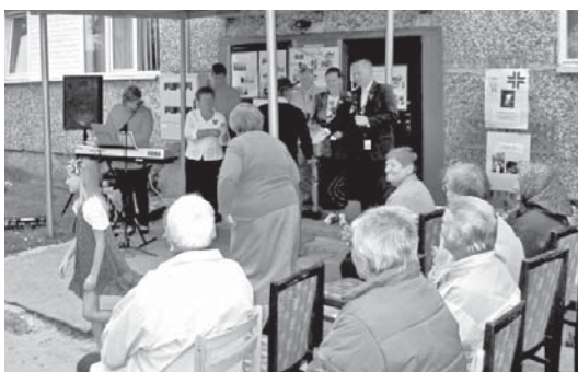
Pašreiz bibliotēka atrodas ciematiņa dzīvojamajā mājā Nr. 3 – 7