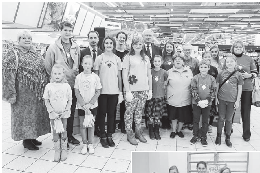
Mazpulcēnu tikšanās veikalā MAXIMA Rīgā.

„Darbā cilvēks varens top” – tā teikuši gudri cilvēki. Kas tad ir šī teiciena pamatā? To katru rudenī cenšas noskaidrot mazpulcēni, izvērtējot savus padarītos darbus. Pavasara apņemšanās ir nopietns pieteikums čaklam, neatlaidīgam un arī grūtam darbam visas vasaras garumā. Ja tu esi mazpulcēns, tas nozīmē, ka uzsāktais darbiņš jāpadara līdz galam, rūpīgi plānojot un organizējot savu laiku, mācoties gan teorētiski, gan praktiski apgūt vajadzīgās zināšanas un iemaņas. Svarīgi par savu veikumu mācēt pastāstīt citiem, izanalizēt veiksmes un arī neveiksmes darbā, izdarīt secinājumus.