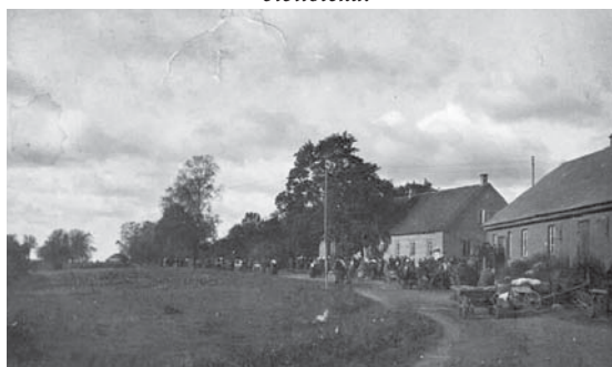
1931. gads. Pirmā ēka no labās Patērētāju biedrības māja, otrā Saukas pagastmāja.

raidījumus. To visu arī izmanto bibliotēkas lietotāji. Prieks, ka ir ģimenes, kur visi ir lasītāji – gan vectētiņš, gan vecmāmiņa, gan tētis, māmiņa, bērni, mazbērni... Paldies ikvienam dāvinātājam, kas bibliotēkai dāvina žurnālus, grāmatas! Paldies visiem, kas atbalsta, palīdz, ziedo!