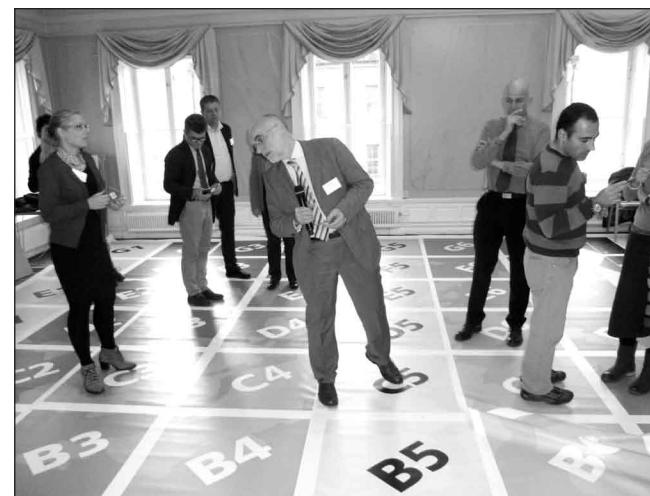
Pilsētas spēle.

Projekta "Daudzliemeņu pārvaldes veicināšanas izpēte Eiropa 2020 stratēģijas atbalstam" mērķis ir identificēt pārvaldības procesu veiksmes faktoros, kas izraisa augstas kvalitātes politisko un administratīvo pārvaldību visos līmeņos. Projekts fokusējas uz divām ar "Eiropa 2020" saistītām prioritātēm – energoefektivitātes veicināšana un sociālā iekļaušanās. Projekta ietvaros ir izvēlēti 8 labie pārvaldības piemēri, katrā no minētajām tēmām. Strenču novada dome kopā ar Vidzemes plānošanas reģionu ir iesaistījies projekta daļā, kas pēta sociālās iekļaušanās tēmas labās prakses piemērus no Zviedrijas (Stokholmas reģions), Polijas (Pomorskas reģions), Rumānijas (Timišoaras pilsēta) un Lielbritānijas (Liverpūles pilsēta). Katra prezentētā labas pārvaldības piemēra pieredze atspoguļoja elementus un pieejas, kas minētās tēmas risināšanā būtu saistoši daudzām Eiropas Savienības pašvaldībām, reģioniem. Stokholmas reģiona pārvalde prezentēja interesantu projekta rezultātu, proti, spēli "Urban Game" (Pilsētas spēle), kas norisinās uz telpiski liela spēļu laukuma, tās dalībniekiem