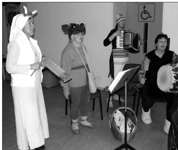
Folkloras kopa "Mežābele" māca saulgriežu tradīcijas