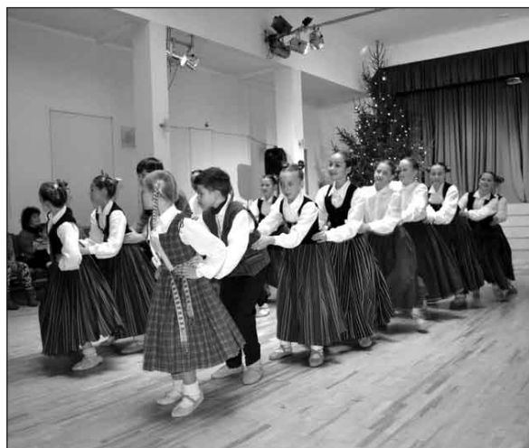
Koncerts "Pirms Ziemassvētkiem"