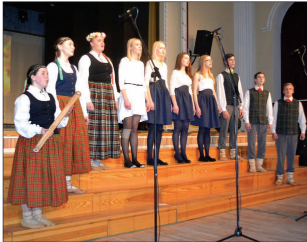
Ansamblis koncertā Valkā

Marta beigās noslēdzās vokālā konkursa BALSIS vēsturisko novadu II kārtas skates. Labākie kolektīvi visu novadu kopvērtējumā pēc žūrijas lēmuma tika izvirzīti fināla konkursam Rīgā š.g. 9.maijā.