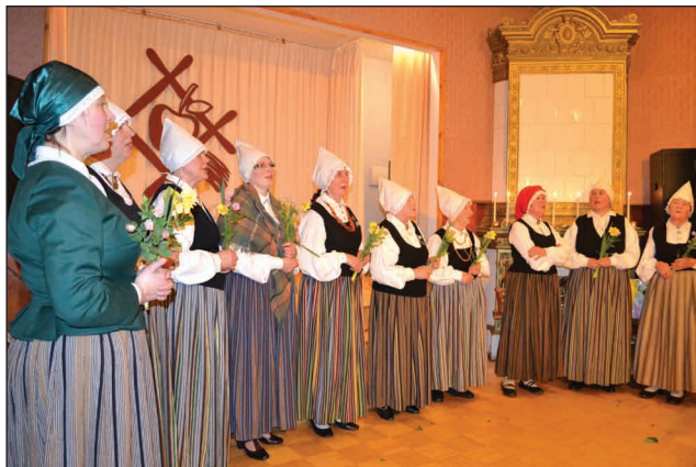
Folkloras kopa "Mežābele" 30 gadu jubilejā