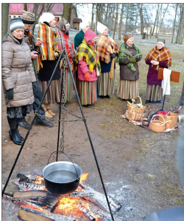
Lielā diena Jērcēnmuižā