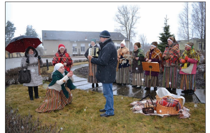
Lielās dienas tradīciju mācīšana Sedā