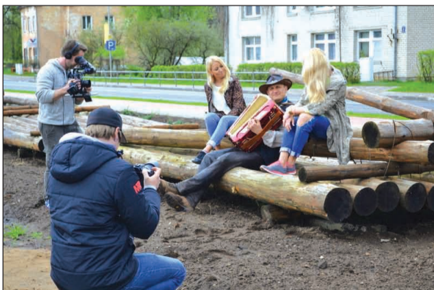
LNT brokastīs - Plostnieki