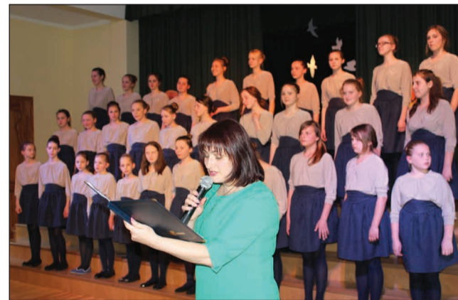
Koncertā "Pats skani, līdz skani"