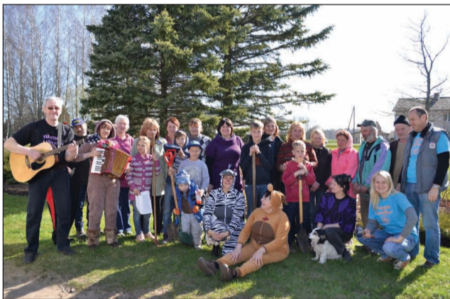
Talcinieki Plāņu pagastā

izsaka visdziļāko līdzjūtību aizgājušu tuviniekiem