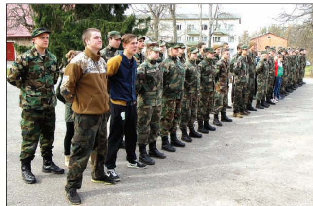
Jaunsargu sacensības Jērcēnmuižā