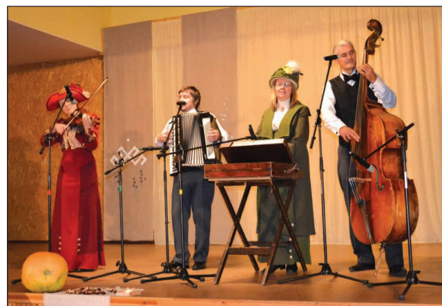
Apkūlību ballē Plāņos muzicē kapela "Hāgenskalna muzikanti"