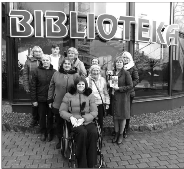
Bibliotekāri pie Limbažu bibliotēkas