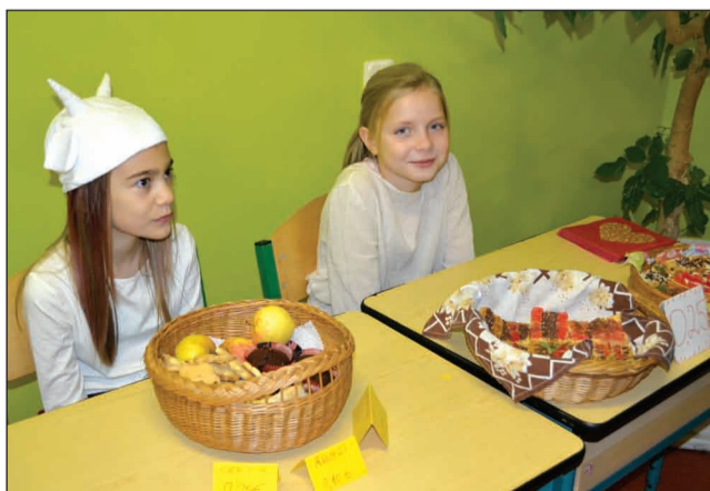
Mārtiņdienas tirdziņā Strenču novada vidusskolā