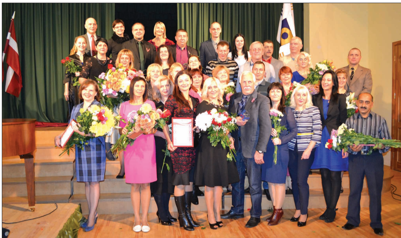
Strenču novada GADA CILVĒKI 2015

Silvijai tuvas ir latviešu tautas tradīcijas un folkloras, savu brīvo laiku viņa pavada darbojoties folkloras kopā "Mežābele". Daudz laika tiek veltīts arī bērniem un maz-