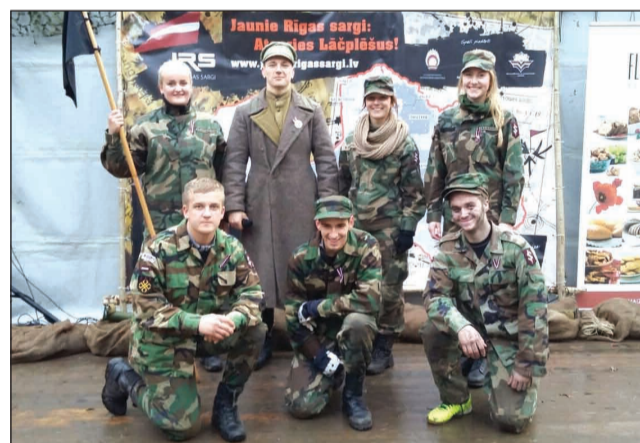
Komanda "Strenču kadeti" piedzīvojumu spēlē "Jaunie Rīgas sargi: Atceries Lāčplēšus!"