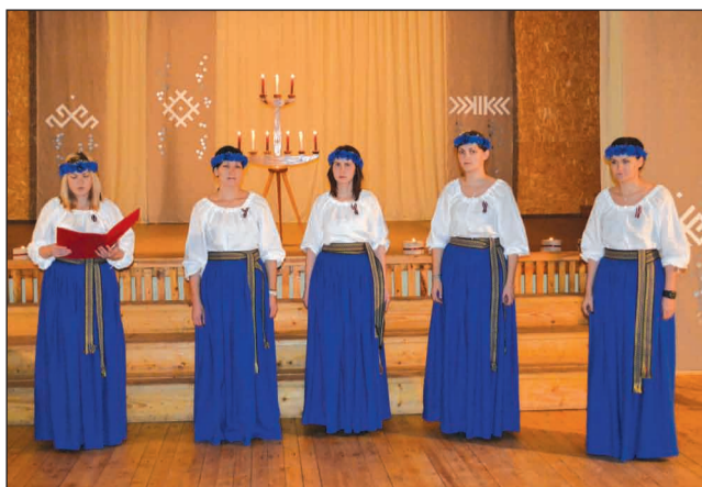
Valsts svētkus Plāņos ieskandina ansamblis "Ēveles meitenes"