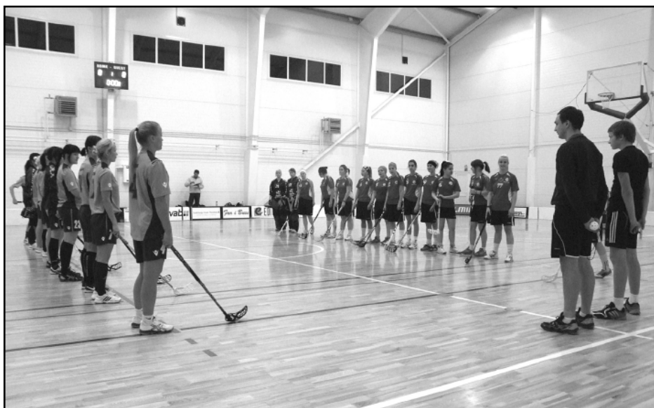
Mājas spēle ar “Rīgas Lauvām”.