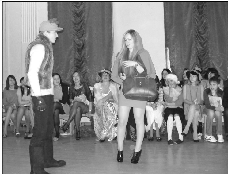
Ziemassvētku pasākums "Cīmos pie pasakas".