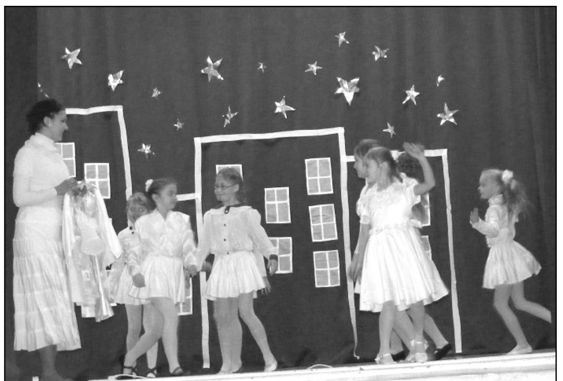
Svētrīts „Dāvā man zvaigzni”.