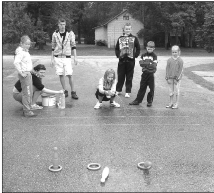
Sporta diena „Aizraujošās mācības”.

Skolotāju dienas pasākuma organizēšana un stundu vadīšana jaunāko klašu skolēniem daudzām 12. klasēm ir bijis nopietns pārbaudījums un pat lūzuma