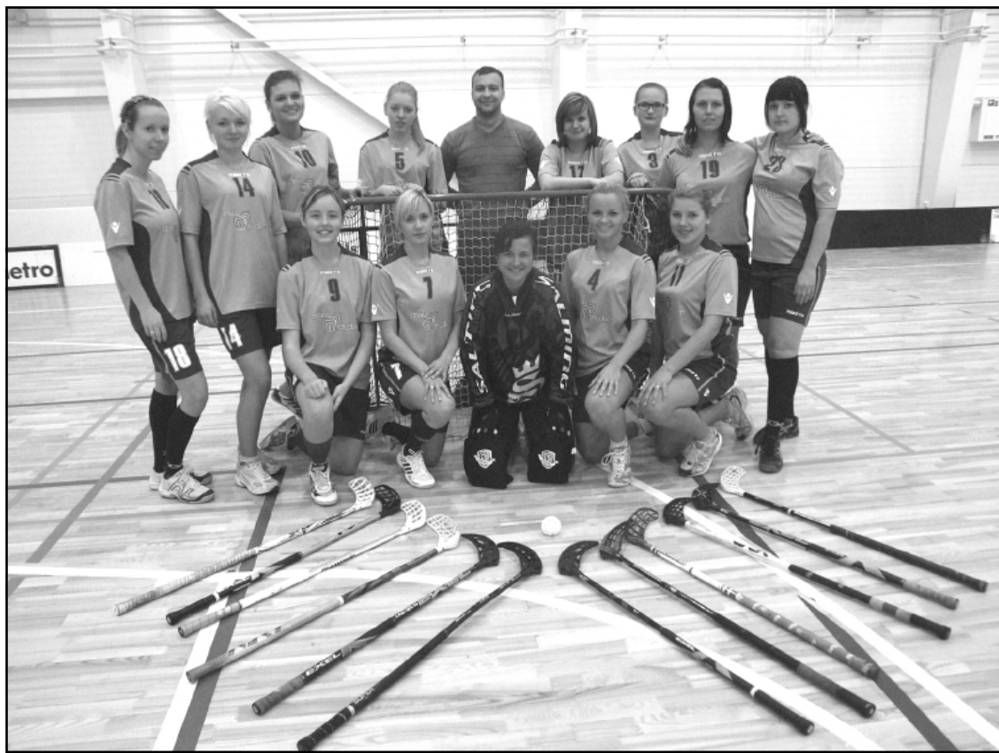
Sieviešu florbola komanda.

Pārstāvēt Krustpils novadu Latvijas Florbola čempionāta sieviešu 1.līgā komandai palīdz SIA „Brēķu studenti” un SIA „Ramda C”, par ko komanda izsaka lielu pateicību, jo šis sporta veids