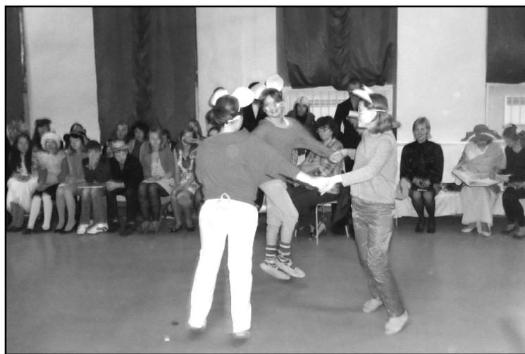
Aina no Ziemassvētku pasākuma.

Tomēr šie vēl nav visi pasākumi, kuros mūsu skolēni pieda-