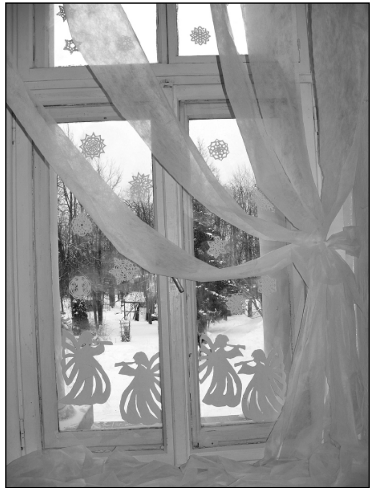
Skolas logi Ziemassvētku noskaņās.

20. decembrī visi pulcējāmies skolas zālē uz svētrītu „Dāvā