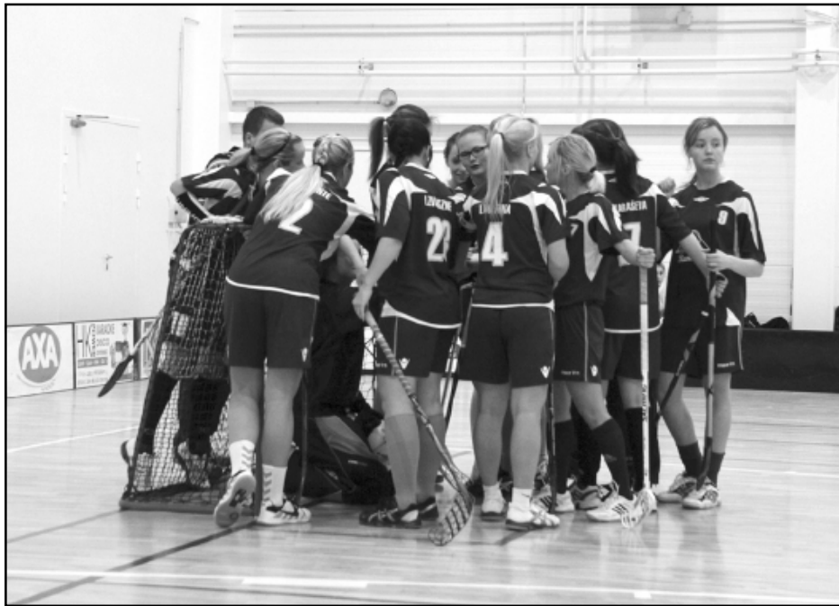
Mājas spēle ar “Coyotiem”.