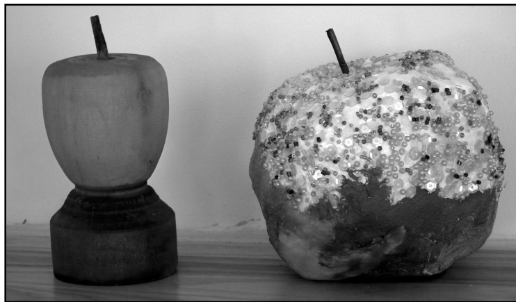
7.kl. un 8.kl. skolēnu izgatavotie āboli.