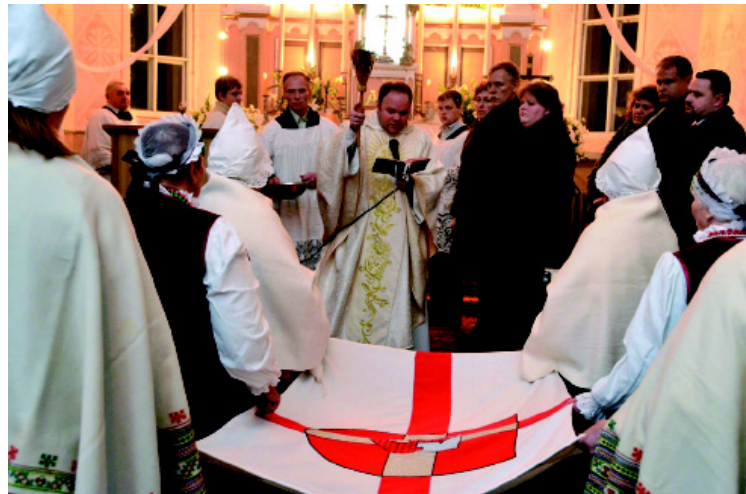
Iesvētot Krustpils novada karogu.