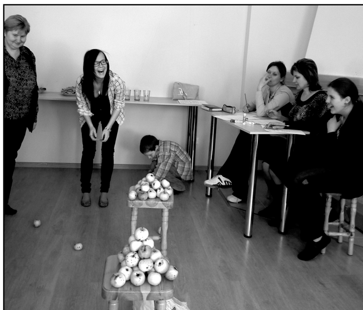
Ābolu piramīdu celšana.