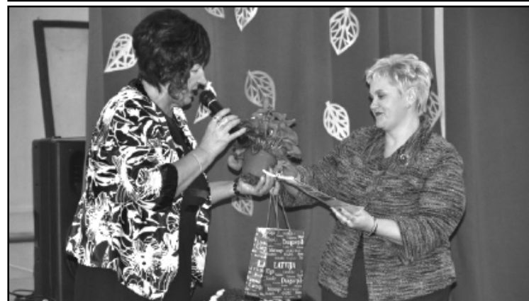
Foto no Krustpils pamatskolas karoga iesvētīšanas pasākuma