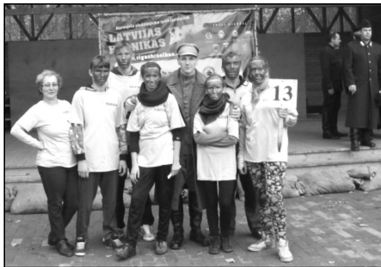
Svarīgākais - mēs to paveicām!

jūs tiksiet apmācīti šī uzdevuma veikšanai pieredzējušu instruktoru vadībā un tad dosieties pildīt misijas uzdevumu.”