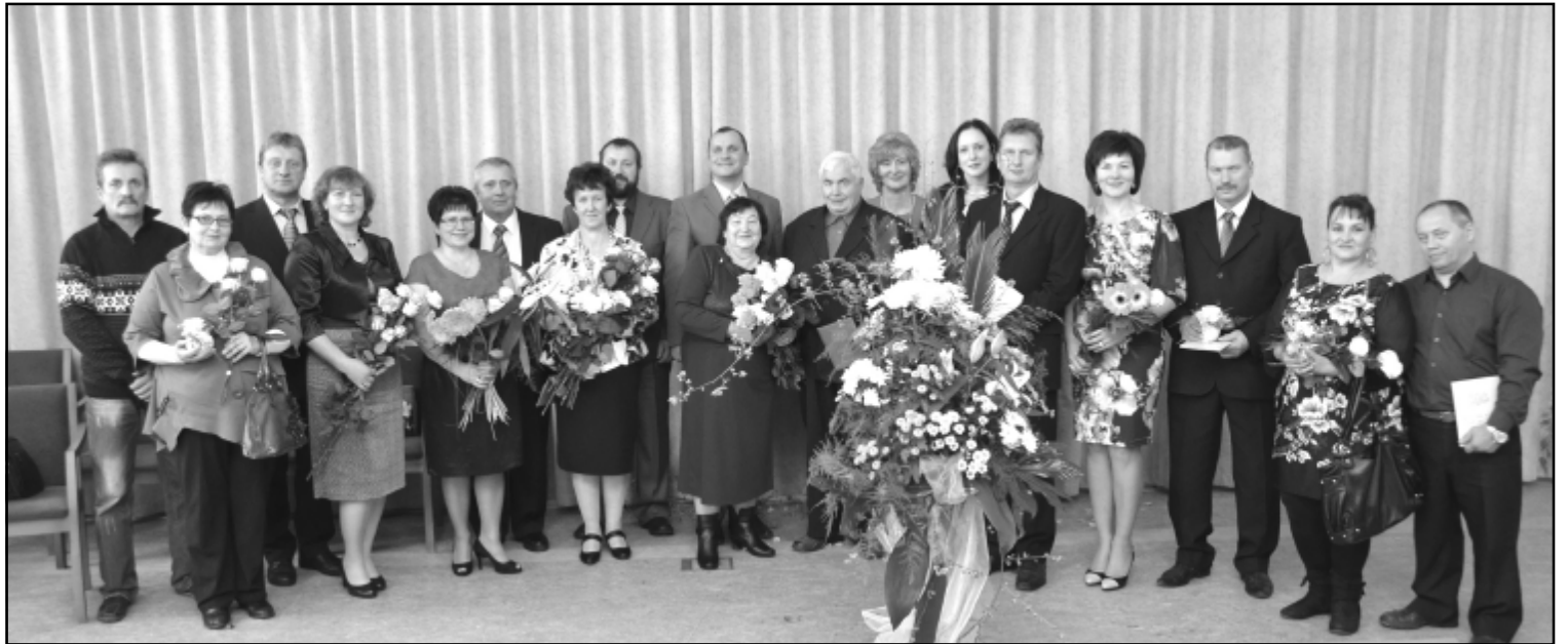
Stipro ģimeņu saiets.