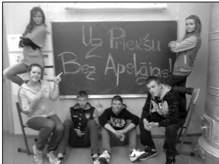
Komandas pieteikums spēlei.

Ar lielu nepacietību gaidījām rezultātus, jo klātienē spēlē piedalās tikai 20 komandas. Neviltots un priekā pilns „Urrrāā!” atskanēja, kad saņēmām apstiprinājuma pavēsti, ka mūsu komandai 25.oktobrī pulksten 8.30 jāierodas mobilizācijas punktā Jelgavā un jāstājas komandanta rīcībā. Citāts no mobilizācija pavēstes: „Esam saņēmuši informāciju par Bermonta armijas aģentu tīklu Jelgavas apkaimē, kas vāc informāciju par Latvijas armijas plāniem. Mums būs vajadzīga jūsu palīdzība šī tīkla atklāšanā. Vispirms