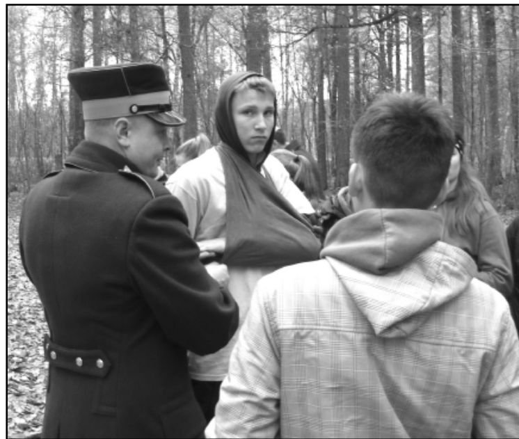
Pirmās palīdzības apmācība.

mācība, atklāšanas parāde un to laikā, kā arī vēlāk visas dienas garumā bez ierunām bija jāpakļaujas komandieru pavēlēm un uz jautājumu „vai sapratāt?” un uz citiem jāatbild ar mundru „Tieši tā!” Apgūstot dažādas iemaņas jauniesaucamo apmācībās, mēs ieguvām daudz jauna – mācījāmies, kā tika izcīnīta Latvijas brīvība, kā sniegt pirmo medicīnisko palīdzību lauka dzīves apstākļos, kā orientēties pēc dažādām kartēm un kompasas, kā maskēties un pārvietoties slepus, kas jāievēro, komplektējot ekipē-