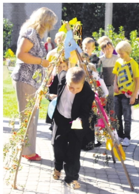
Salas sākumskolas pirmajam skolas zvanam skanot, 1. septembra gaviļnieki iziet caur gudrības jeb burtiņu arku

būs koncerts, uz kuru tiks aicināts ikviens interesents.