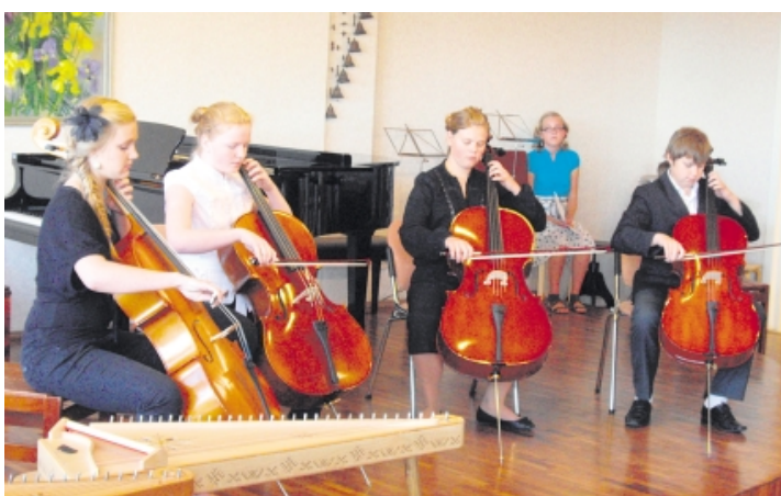
1. septembra priekšnesums Babītes mūzikas skolā