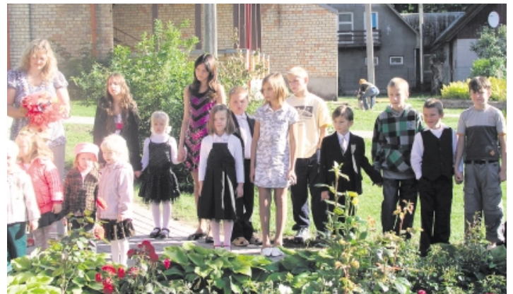
Salas sākumskolas 1. klase

Pēc veiksmīgi aizvadītajiem svētkiem un pasākumiem vasarā Babītes vidusskolā septembrī