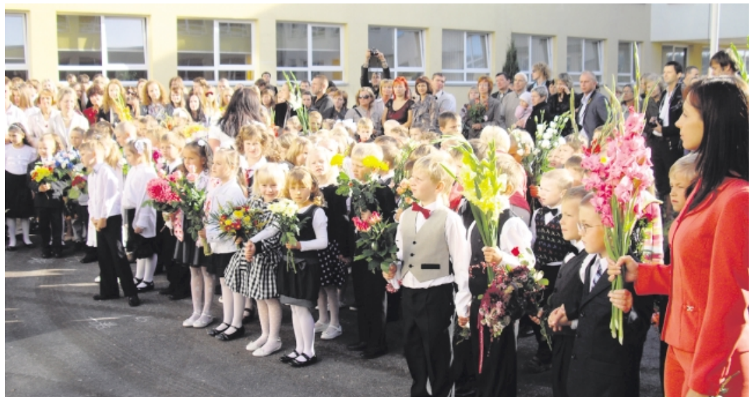
Babītes vidusskolas 1. klašu audzēkņi

1. septembra svinīgajā pasākumā Babītes vidusskolā, Salas sākumskolā un Babītes mūzikas skolā Babītes novada pašvaldības domes priekšsēdētājs Andrejs Ence, vēlot svinīgus vārdus skolēniem, viņu vecākiem un skolotājiem, pasniedza arī Valsts prezidenta Valda Zatlera pateicības rakstus par prieku, dvēseles spēka un skaistuma piestrāvotajiem X Latvijas Skolu jaunatnes dziesmu un deju svētkiem 5. - 9. klašu korim (vad. Sandra Sestule), 1. - 4. klašu tautas deju kolektīviem (vad. Linda Plostniece), Babītes mūzikas skolas koklētāju ansamblim Dzītarīni (vad. Valda Bagāta), kā arī Babītes vidusskolas akadēmiskās zīmēšanas pulciņam (vad. Ineta Kona). Prezidenta pateicības raksts tiks pasniegts arī tautas deju kolektīvam Saimīte (vad. Dace Veide). Izglītības un zinātnes ministrijas, Valsts izglītības satura centra un Pierīgas Izglītības, kultūras un sporta pārvaldes atzinības un pateicības rakstus piešķirā visiem svētku dalībniekiem, kolektīvu vadītājiem, novada pašvaldības domes priekšsēdētājam A. Encem, izglītības iestāžu vadītājiem no Babītes novada. Īpašu apbalvojumu saņēma Babītes vidusskolas 5. - 9. klašu meiteņu koris, kas valsts līmeņa koru finālkatē saņēma zelta diplomu.