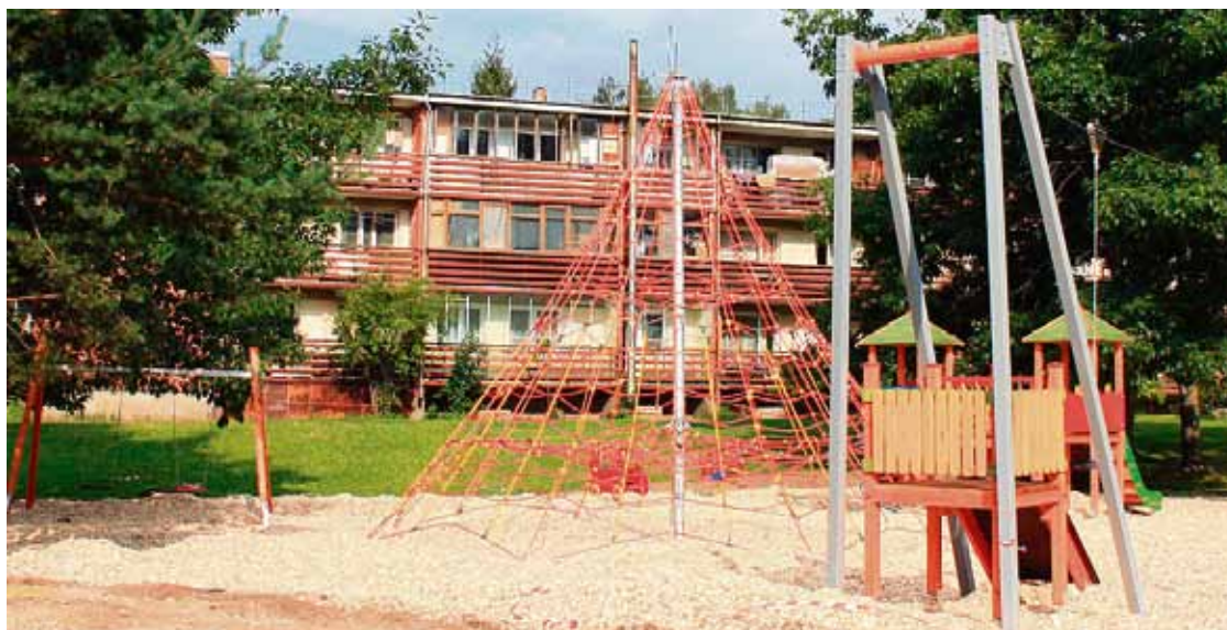
Jaunais rotaļu laukums Salas pagastā.

ar Lauku atbalsta dienesta Lielrīgas Reģionālās lauksaimniecības pārvaldes 2012. gada 16. februāra lēmumu Nr. 04.3/2-11/375 "Par projekta iesnieguma apstiprināša-