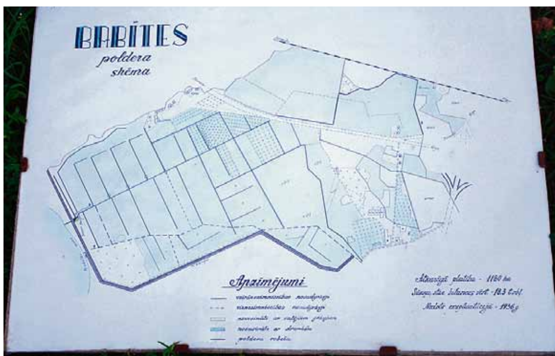
Babītes novada vēsture – 1936. gadā izstrādātā Babītes poldera shēma.

Babītes poldera sistēma saimniecisko darbību tagadējā veidolā sāka aptuveni 1963. gadā. Babītes poldera aizsargdambis ir vairāki kilometrus garš. Taču sākuma variantā tas izbūvēts 1938. gadā, līdz ar to Babītes poldera sūkņu stacija ir pirmā šāda veida sūkņu stacija Latvijā. Nostātos dzirdēts, ka par valsts un apkārtējo zemnieku naudu sāka sūkņu stacijas celtniecība pie Nerīņas upes ietekas Babītes