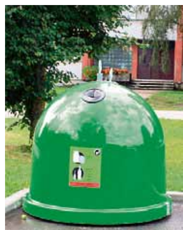
Stikla atkritumu konteiners laukumā pie Babītes vidusskolas.