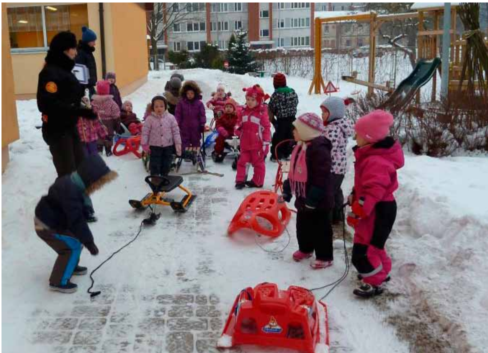
Ragavu diena PII "Saimītē".