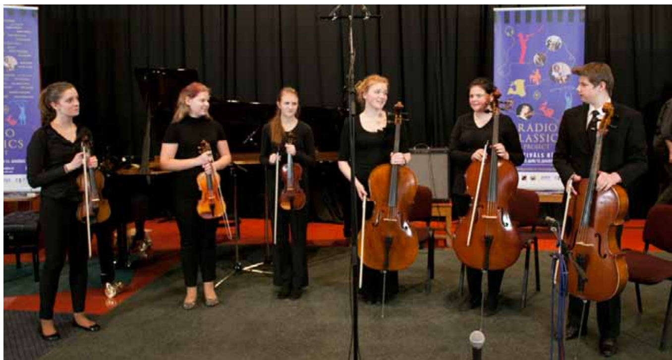
Babītes mūzikas skolas stīgu ansamblis.

Mūziķi, kuri piedalījās koncertā Rīgā projekta "Jauniešu iesaistīšana profesionālajā klasiskajā mūzikā" ietvaros, ir no Aizputes, Babītes, Engures, Ventspils, Cēsu, Gulbenes, Rīgas un Igaunijas mūzikas skolām un šī bija lieliska iespēja jaunajiem talantiem gan spēlēt profesionālā skaņu ierakstu studijā, gan sadraudzēties ar citiem mūziķiem.