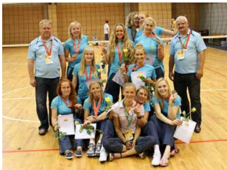
Sporta kluba "Babīte" sieviešu volejbola komanda.

Devītais sabraukums norisinājās Voru pilsētā Igaunijā 25.–27. janvārī, kur Latvijas komandas tikās ar Igaunijas komandām. SK "Babīte" komanda izcīnīja maksimālo punktu skaitu, uzvarot visā trijās spēlēs, kas ļāva mūsu komandai apsteigt turnīra tabulā "Jelgavas/LU" komandu par vienu punktu un ieņemt piekto