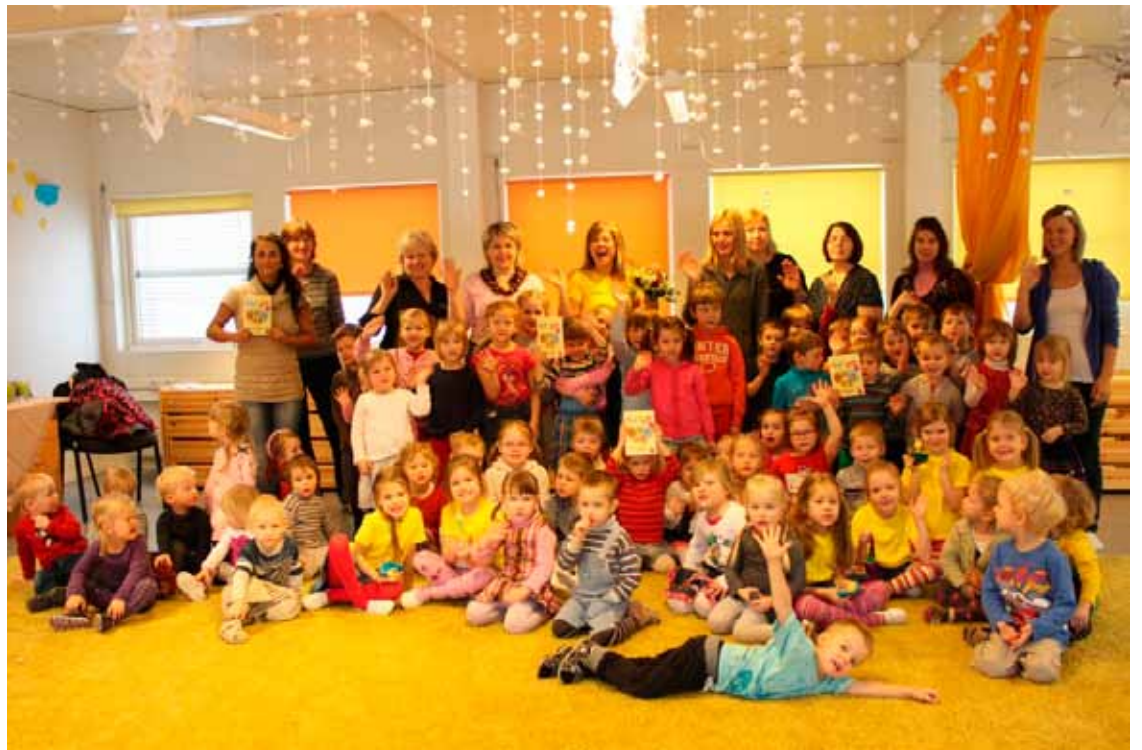
"Dziesmas, rotaļas, dejas bērniem" grāmatas prezentācija Babītes novada bērnudārzā.

Iedziedātais materiāls izmantojams arī grupas skolotāju rīta