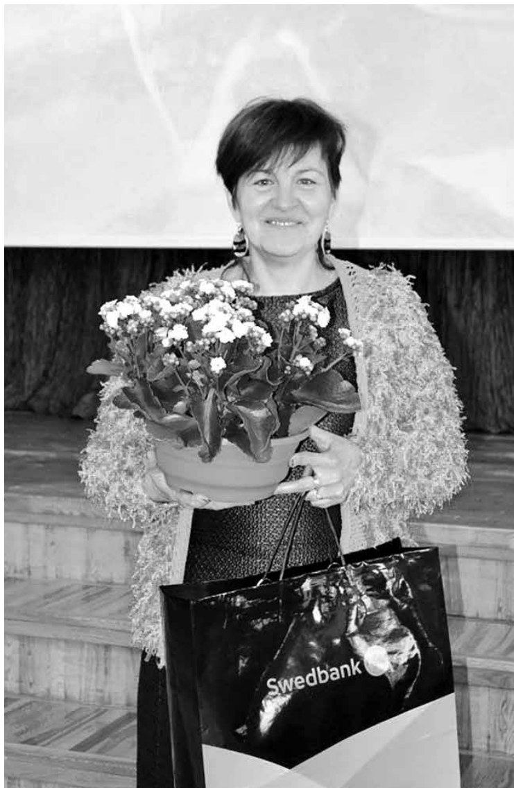
"Swedbank" dāvana – labākajai skolotājai

LIZDA konkursā piedalījās 29 izglītības iestādes, kurās viesojās žūrija, lai novērtētu pedagogu sociālo drošību un darba koptīgumu, darba organizāciju, infrastruktūru, darba kvalitātes veicināšanu un personīgās izaugsmes iespējas, darba drošību, aizsardzību, mikroklimatu un savstarpējās attiecības, reputāciju, atalgojumu.