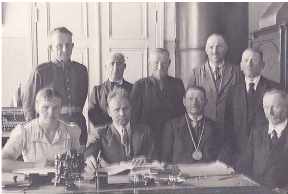
Attēlā redzamās personas ir Salas pagasta valdes locekļi. Lūgums atsaukties personas, kuras var pastāstīt vairāk par šiem cilvēkiem.