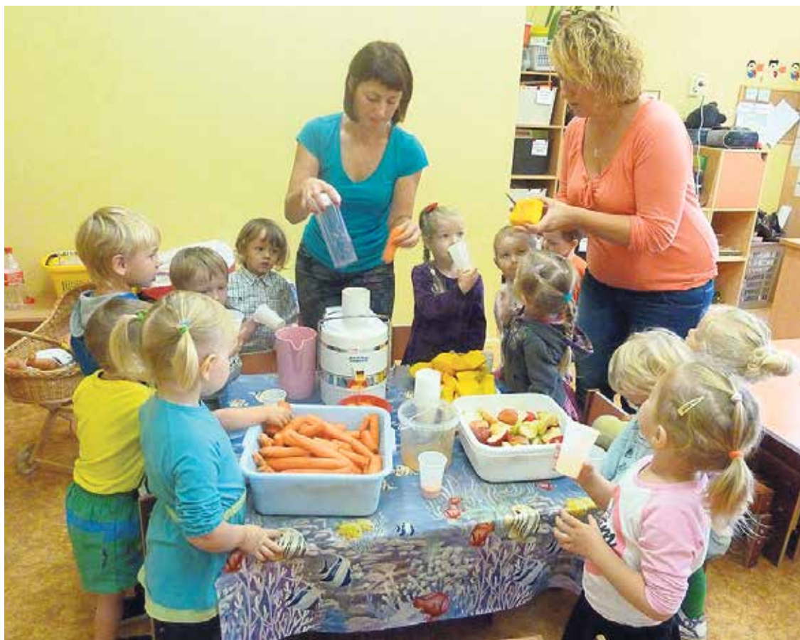
Tiek gatavotas veselīgas rudens sulas.