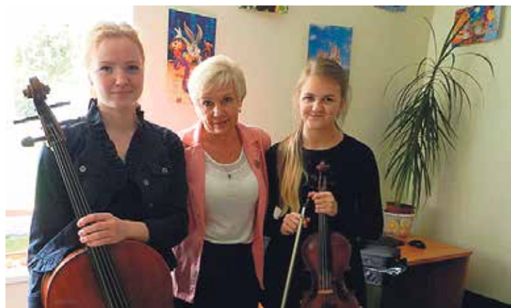
Babītes Mūzikas skolas pārstāvji.

Aicinām dāmas apmeklēt Dāmu interešu klubu daudzfunkcionālajā sociālo pakalpojumu centrā Piņķos (Centra ielā 3) otrdienās plkst. 12. Līdzī neimt labu garastāvokli!