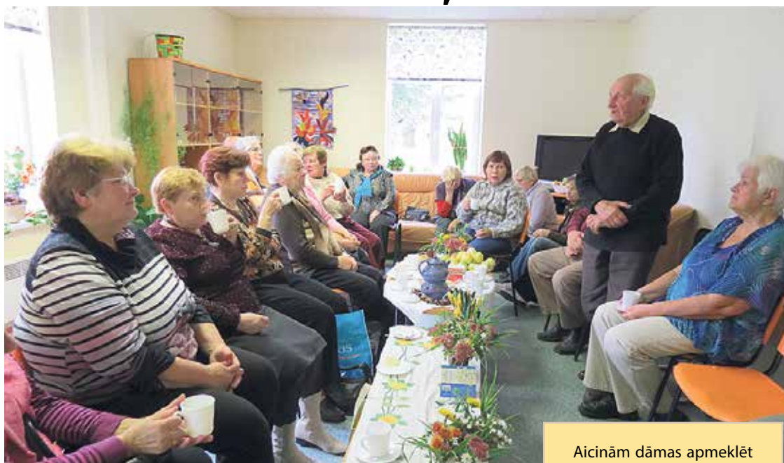
Sarunas pie kafijas tases.

audzēkņu koncertu daudzfunkcio- nālajā sociālo pakalpojumu cen- trā Piņķos. Pie kafijas tases tika apspriesti aktuālākie jaunumi un pārrunātas idejas, sagaidot rudens atnākšanu. “Esam gandarīti, ka mūsu mazajās centra telpās ir sanākuši tik daudz cienījamā ve- cuma novadnieku. Redzot smaidu viņu sejā, saprotam, ka šī ideja – atzīmēt Veco ļaužu dienu – jātur- pina arī nākamajā gadā,” gandarī- tas stāsta centra darbiniece.