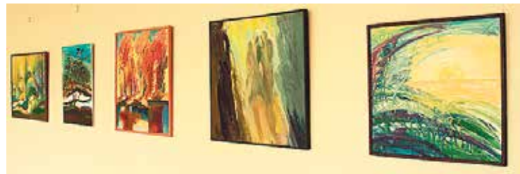
Izstāde Babītes vidusskolas 2. stāva vestibulā būs apskatāma līdz decembrim.

Zane Siliņa, pašvaldības sabiedrisko attiecību speciāliste