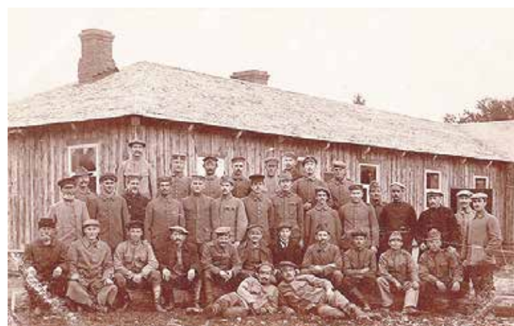
Kur Salas pagastā atrodas šī nometne?