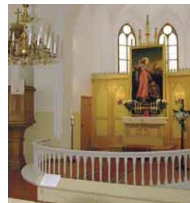
Piņķu Sv. Jāņa baznīcas altāris.

Jau minēts, ka baznīca kopš pirmsreformācijas laikiem saukta Svētā Ni-