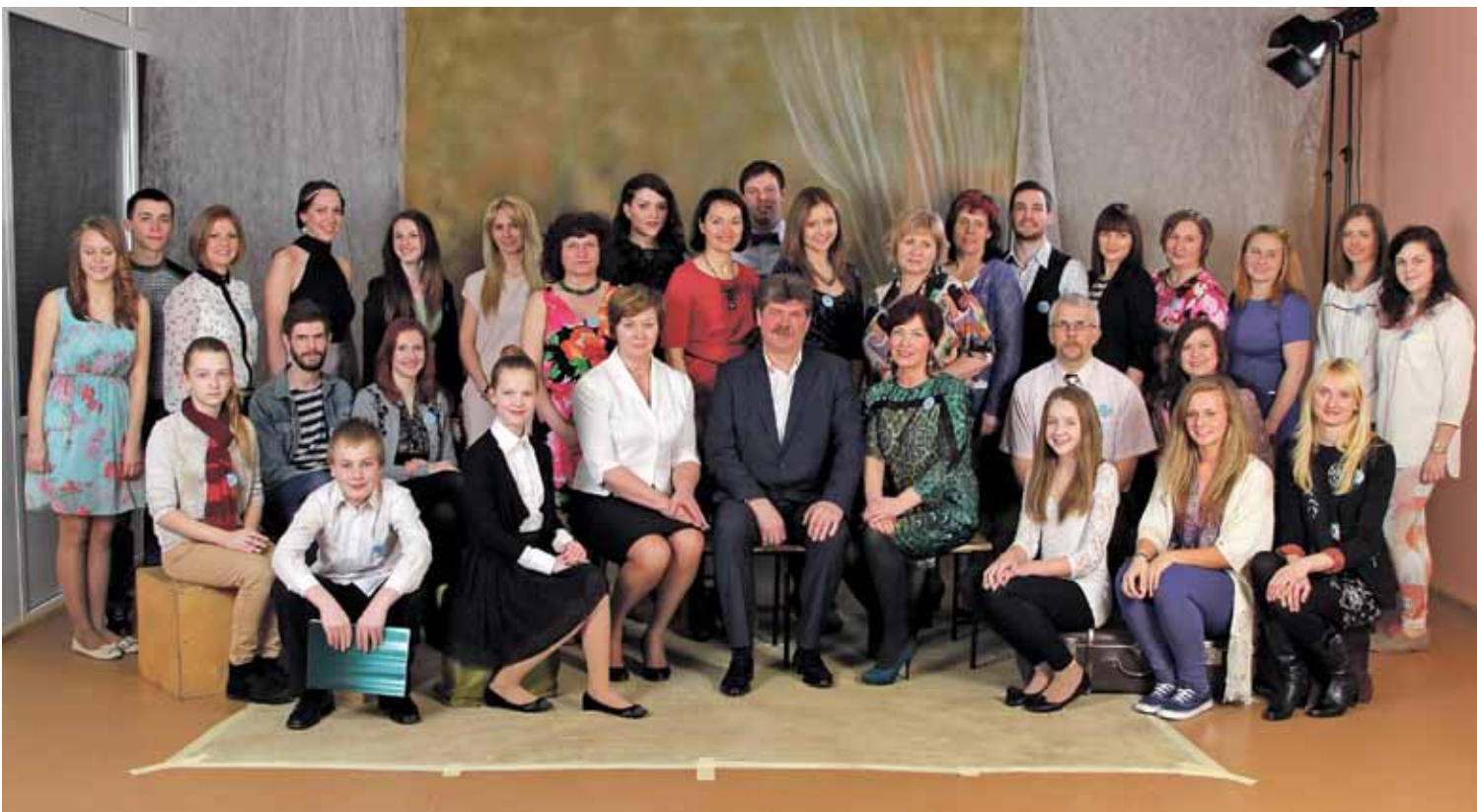
„Kalambūrs” savā 15 gadu jubilejas pasākumā kopā ar draugiem un atbalstītājiem.

Ilze Valpētere, pašvaldības bibliotēkas vadītāja