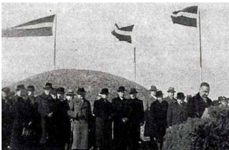
Pieminekļa vieta Piņķos mēnesi pirms tā atklāšanas; 1939. gads.

Lēmums par latviešu nacionālo vienību un tobrīd latviešiem draudzīgo vācu landesvēra vienību ģenerālo uzbrukumu Rīgai, lai atbrīvotu to no lielniekiem, tika pieņemts 1919. gada 20. maija vakarā. Uzbrukuma plāns noteica, ka