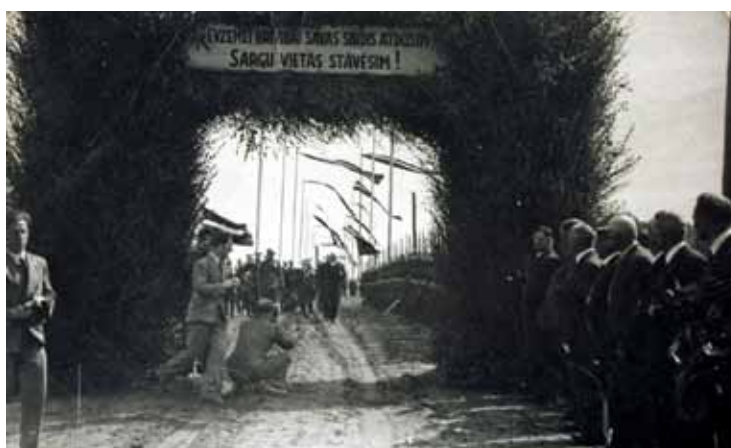
Goda vārti „Tēvzemei, brīvībai, savas sirdis atdosim, sargu vietās stāvēsim!” Pieminekļa atklāšana 1939. gada 23. maijā (foto no vēstures arhīviem).

Kā ļoti būtiska rīcība Piņķu kaujas laikā minama arī latviešu karavīru drosme, dzēšot Bulduru