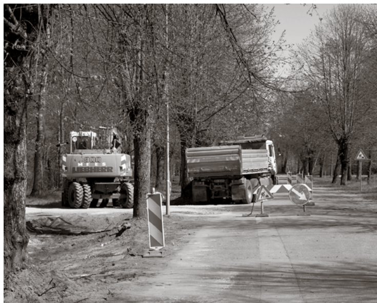
Liepu alejas rekonstrukcijas darbi

Ainārs Skudris, sabiedriskās kārtības sargs