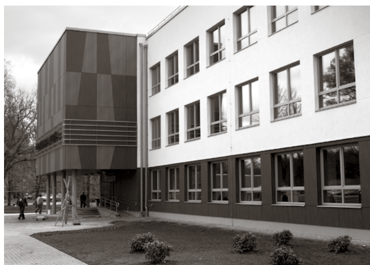
Kultūrizglītības centrs Piņķos

Izpilddirektore atgādina arī par citiem iepirkumiem, kas ir noslēgušies un kā rezultātā ir noslēgti līgumi par to izpildi: