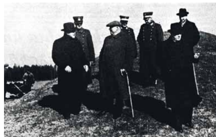
Prezidents K. Ulmanis un ģenerālis J. Balodis Piņķos apskata piemineklim izbūvēto laukumu 1939. gada 17. aprīlī (foto no vēstures arhīviem).

koka tiltu, kuru atkāpjoties bija aizdedzinājuši lielnieki. Kaujas laikā lielnieki tika atsisti uz Spil-