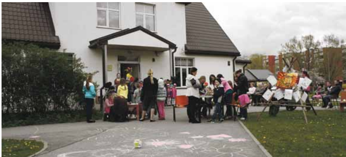
Ģimenes diena daudzfunkcionālā sociālo pakalpojumu centra pagalmā