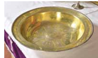
Trauks ar 1874. gada gravējumu.

kolaja – Miras pilsētas bīskapa – vārdā (270–343). Interesanti, ka tieši no Sv. Nikolaja vārda cēlies Santa Klauza vārds un tēls. 1939. gada 23. maijā valsts prezidents Kārlis Ulmanis pārsvētīja baznīcu apustuļa un evaņģēlista svētā Jāņa vārdā, ko lietojam vēl šodien.