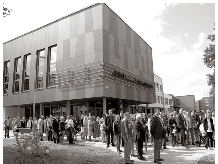
Babītes Mūzikas skolas fasāde

Ilze Latkovska, Babītes Mūzikas skolas direktores vietniece izglītības jautājumos