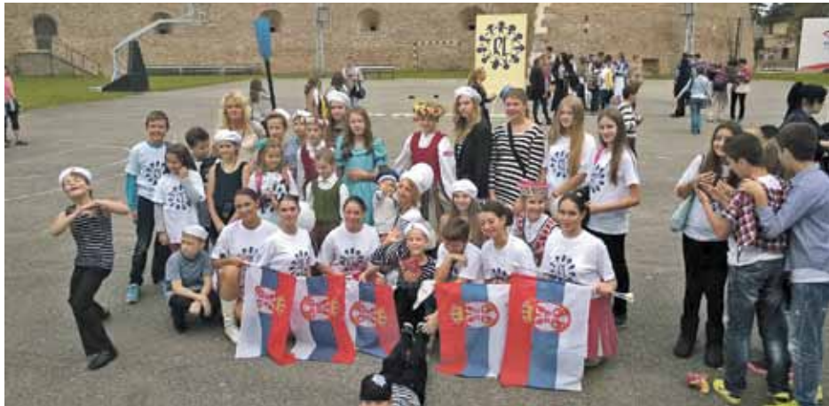
Latvijas delegācija kopā ar serbu bērniem atklāšanas koncertā

Festivālā „Joy of Europe 2014” šogad piedalījās vairāk nekā 17 valstu pārstāvji no Eiropas un Skandināvijas. Lai piedalītos