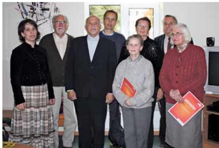
Septiņi 2014. gada septembra datorapmācību absolventi un pasniedzēja

Lelde Drozdova-Auzāne, sabiedrisko attiecību speciāliste