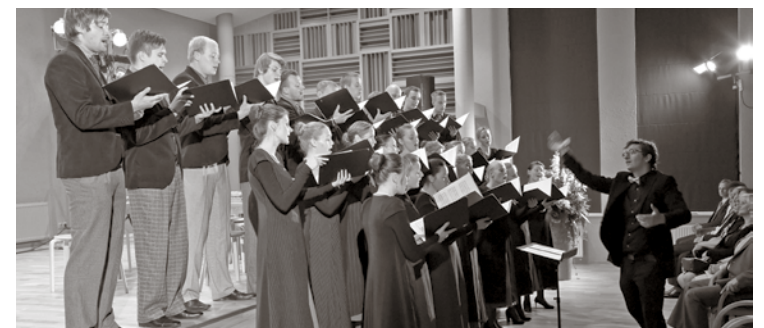
Jauniešu koris „Maska”

Uz tikšanos koncertā! Babītes novada jauniešu koris „Maska”