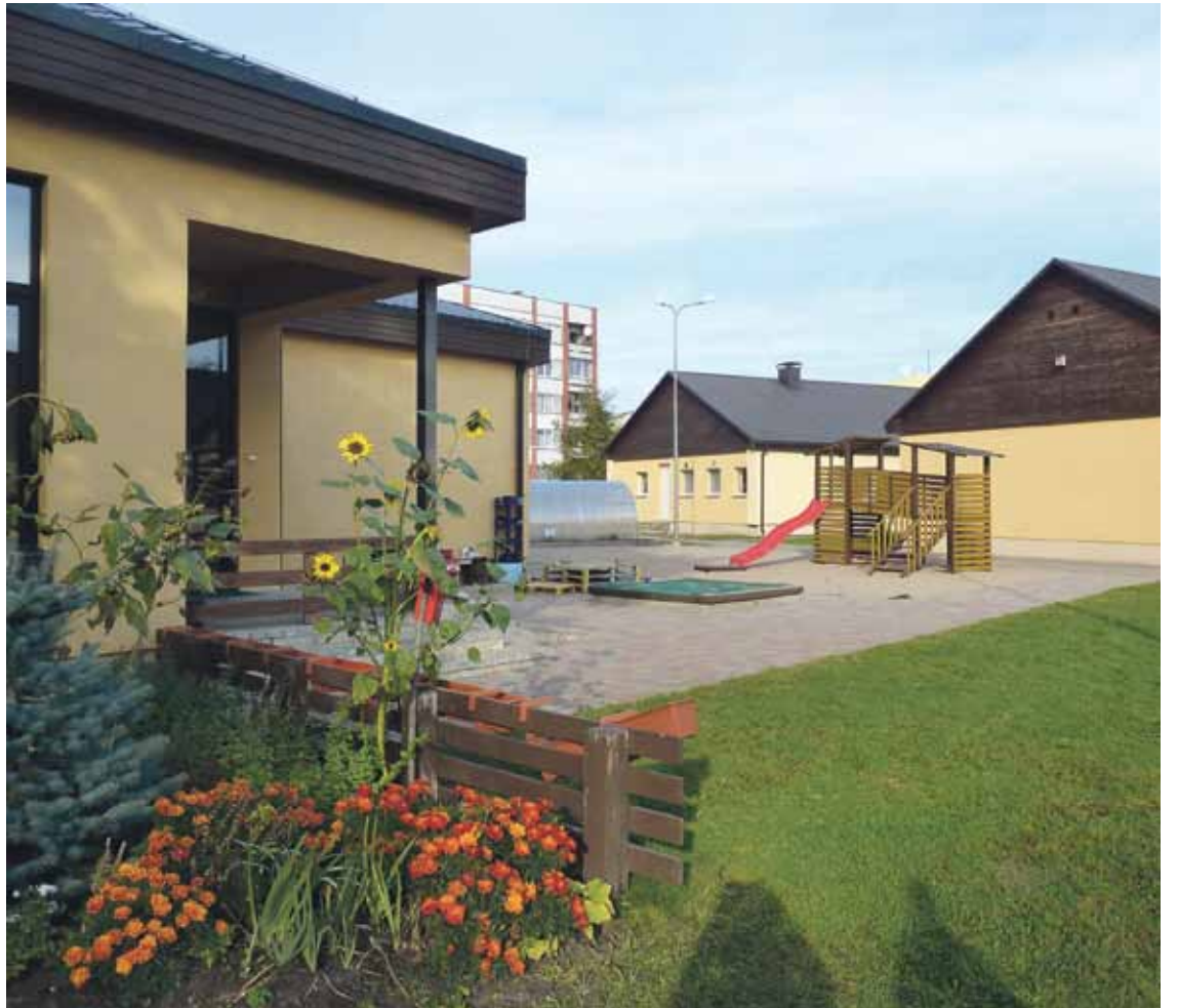
PII „Saimīte” 2014. gada rudenī

Reaģējot uz Babītes novada iedzīvotāju skaita straujo pieaugumu, kas veicina arī dzimstību un pieprasījumu pēc vietām bērnudārzā, Babītes novada pašvaldība septembrī uzsāka jauna korpusa izbūvi pašvaldībai piederošai pirmsskolas izglītības iestādei (PII) „Saimīte”, lai jau nākamā gada pavasarī iespēja to apmeklēt būtu 40 visjaunākajiem novada iedzīvotājiem.