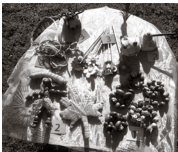
Bērnu pašu darinātās lietas Miķeļdienas gadatirgū

Kā jau istā gadatirgū, neiztika bez dančiem, dziesmām un rotaļām, uz kurām aicināja rudens rūķis Miķelis un viņa draugi Lācis un Ezis.