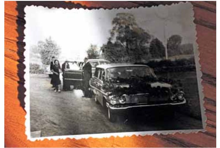
Kamergraužu kāzu limuzīns