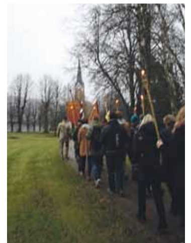
Lāčplēša dienai veltītais lāpu gājiens uz Piņķu kapiem