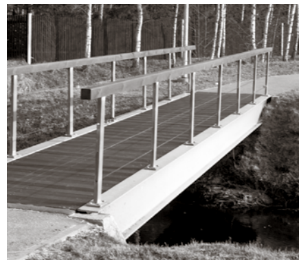
Gājēju tiltam pār Nerīnas upi Brīvkalnos ir atjaunots dēļu klājs, tā gādājot par cilvēkiem ērtu un drošu došanos ikdienas gaitās.