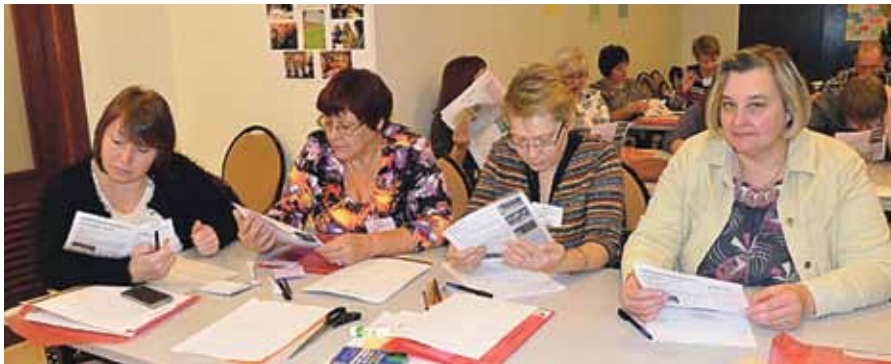
Babītes vidusskolas komanda nodarbības laikā