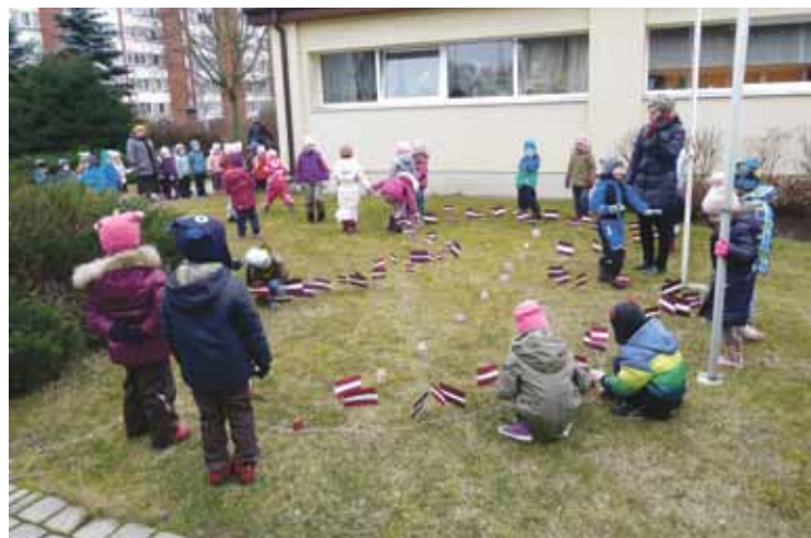
„Saimītes” bērni no pašu gatavotiem karodziņiem veido Latvijas kontūru

Mēs savai valstij novēlam, lai ir vairāk ģimeņu, kas vēlas dzīvot Latvijā un dziedāt, jo dziesmā ir spēks!