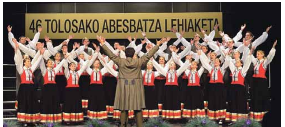
Tolosas kora konkursa organizatoru publicitātes foto