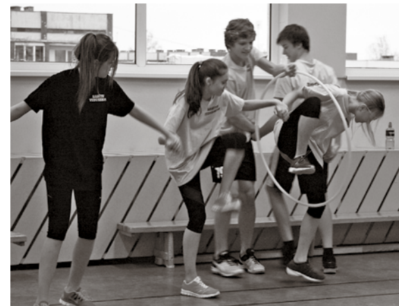
Babītes vidusskolas audzēkņi, cīnoties par sportiskākās 7. klases titulu