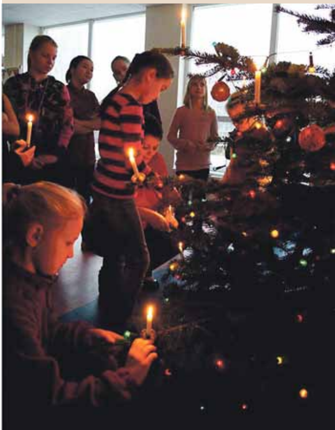
Babītes vidusskolas svētku egles iedegšana

16. decembrī no plkst. 18 Babītes vidusskolas skolēni un pedagogi aicina ģimenes uz Ziemassvētku pasākumu „Piparkūku namiņā dzīvo Kraukšķītis”. Pasākumā būs iespēja piedalīties radošajās darbnīcās, rotaļās, klausīties koncertu un aplūkot izstādes.