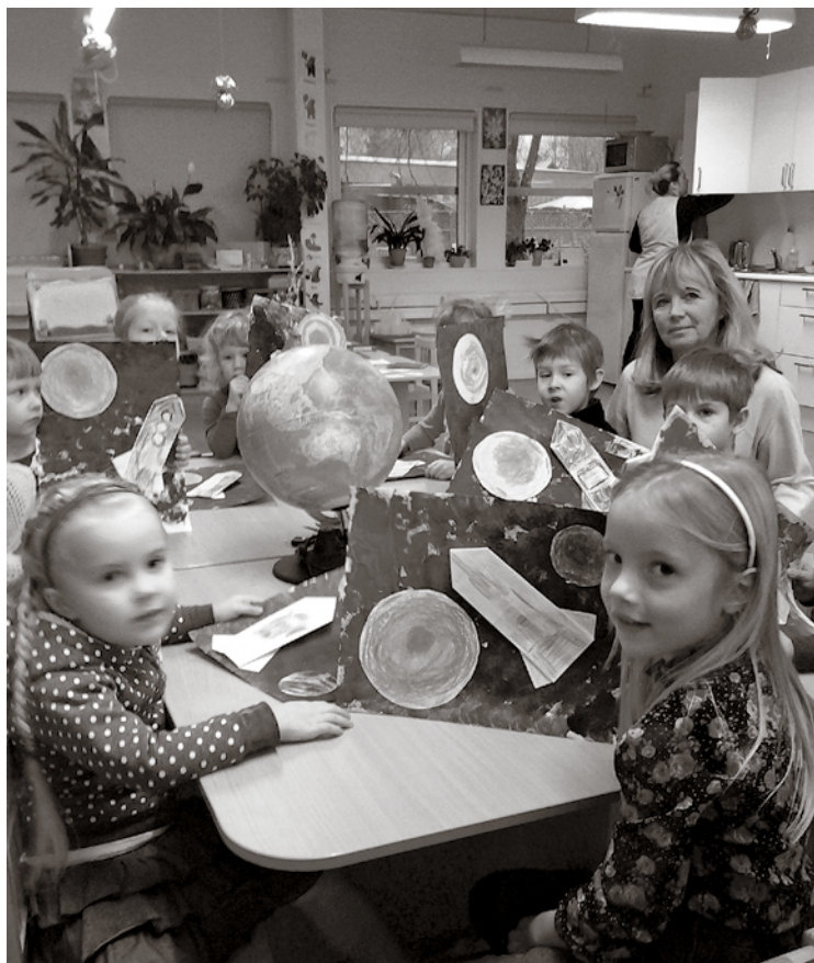
Babītes PII bērni mākslas darbos atklāja savu redzējumu par kosmosu

Ziņkārība un zinātkāre ir Babītes pirmsskolas izglītības iestādes bērnu un pedagogu raksturīgākā iezīme. Lai uzzinātu, kas slēpjas plašajās debesīs, lai ieskatītos pēc iespējas tālāk un ieraudzītu pēc iespējas tuvāk, ir nepieciešamas tumšas, skaidras debesis un liels teleskops!