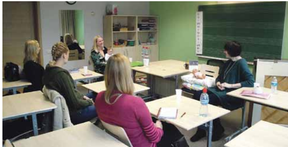
Pirmā daudz bērnu ģimeņu biedrības organizētā lekcija topošajiem un jaunajiem vecākiem

Lai veicinātu daudz bērnu ģimeņu interešu aizsardzību, sadraudzību, izglītību un tradicionālo ģimenes vērtību popularizēšanu sabiedrībā, 24. novembrī Piņķos tika nodibināta Babītes novada daudz bērnu ģimeņu biedrība „Babītes ģimenes”.