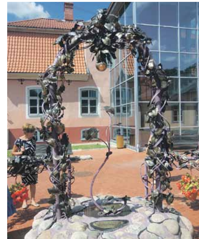
Burtnieku kvartāla īpašais objekts Limbažos – Milas un draudzības vārti.