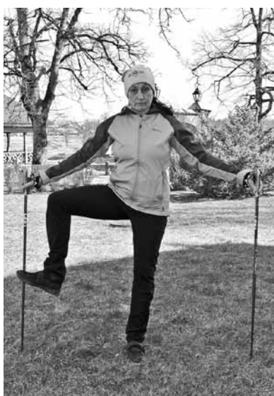
Apļojot jāiesilda gūžas locītavas.