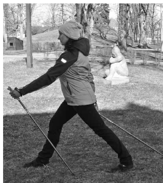
Roku un kāju pozīcija nūjojot.