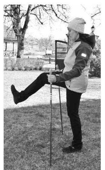
Tāpat jāiesilda ceļi.