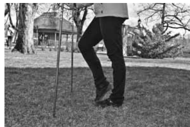
Apļojot iesilda pēdu locītavas.