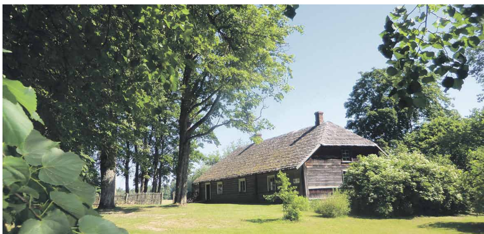
Dzejnieka Friča Bārda Rumbiņi savā vietā joprojām kopš 19. gadsimta vidus.