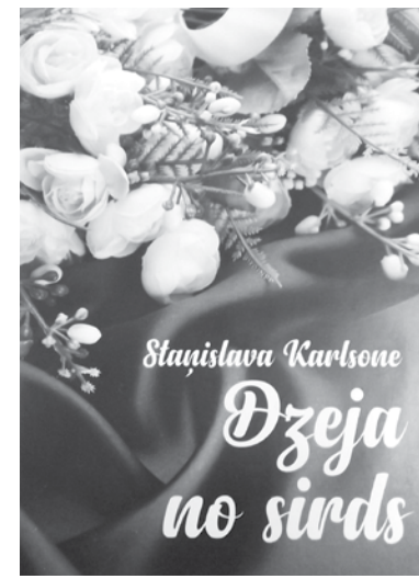
Autores pirmā dzejoļu burtnīca.