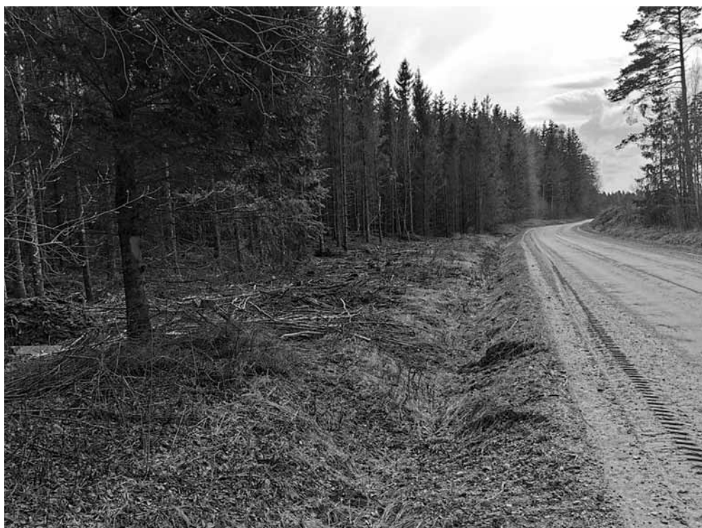
Ceļā no Ēdoles gar Zvirgzdu ezeru uz Gudeniekiem iezīmētie koki vēsta, ka tie tiks nozāgēti, jo drīzumā te būs remonts.