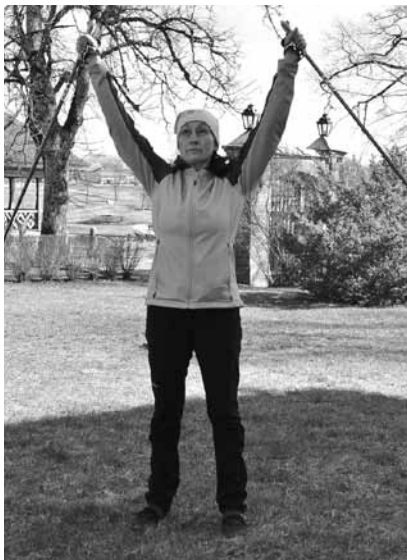
Dinamiska elpošana. Rokas ceļot augšā, notiek ieelpa, laižot lejā – izelpa.