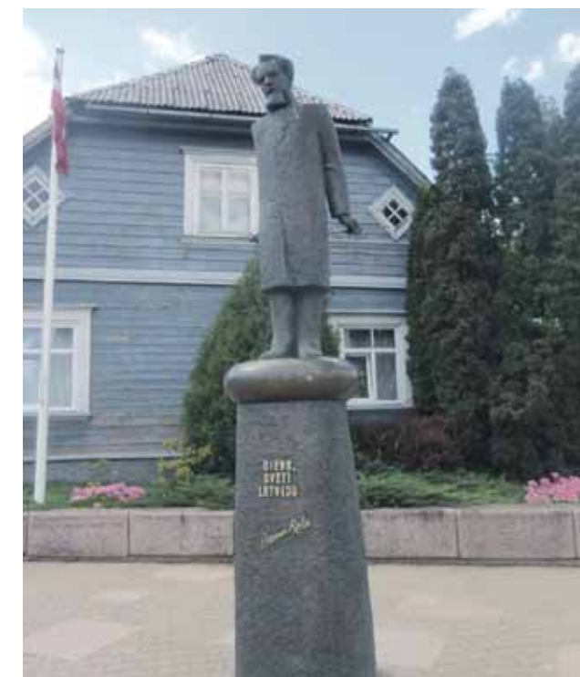
Baumaņu Kārļa pieminēklis Limbažu centrā.