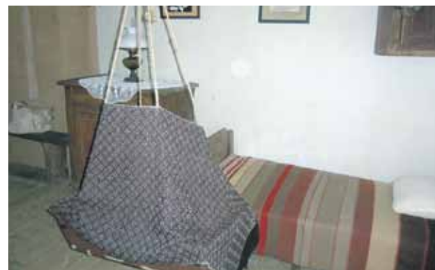
Rumbiņu lielajā istabā viss kā senāk, saglabājies pat vecais šūpulis.

Ierasts, ka no ceļojuma mājās jāatved kāds ciemkukulis, un šoreiz vārda tiešajā nozīmē – apstājami pie maiznīcas Lielezers veikala nedaudz pirms Limbažiem, jo, kā sacīja kāda grupas biedrene, no Limbažiem neviens nebrauc bez Lielezera maizes un bulkām. Iepirkšanas nevar atlikt uz vēlāku laiku, jo darba laiks ir 7.00–15.00 ik dienu, svētdienās nestrādā (tikko lasīju jaunāko informāciju, ka svaiga maizīte nopērkama jau no 6.00), bet atpakaļceļā būs jau pavēla pēcpusdiena. Tikai viena bēda – kā lai no plašā klāsta izvēlas īsto!