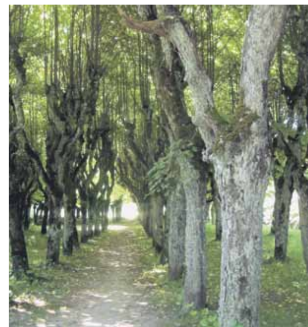
Katvaru parka divainās liepas.