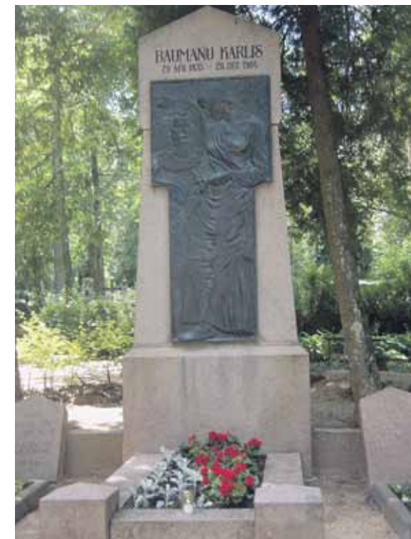
Baumaņu Kārļa atdusas vieta Limbažu kapos.