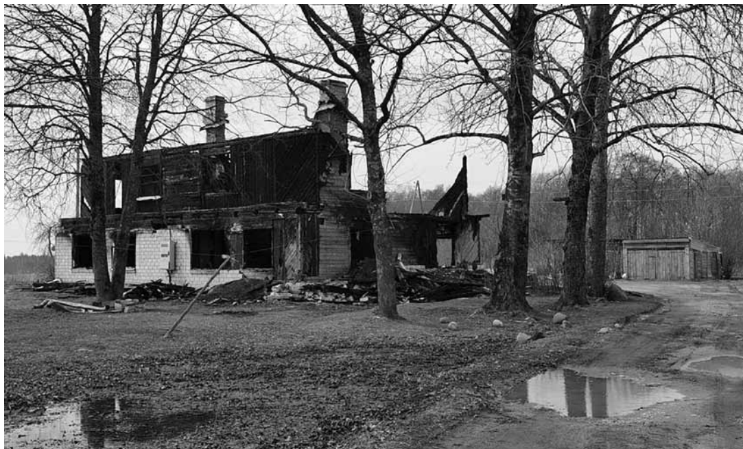
Vairāku dzīvokļu māju Krasti bija iecerēts pārdot izsolē, bet nu nodedusi ēka tiks nojaukta.