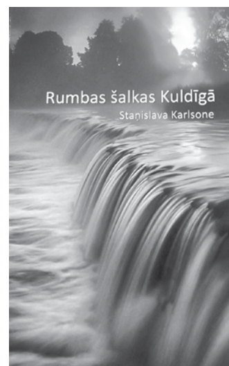
Dzejas krājums Rumbas šalkas Kuldīgā dienasgaismu ieraudzījis gada sākumā.