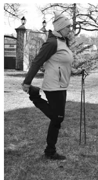
Augšstilba priekšējā muskuļa stiepšana.