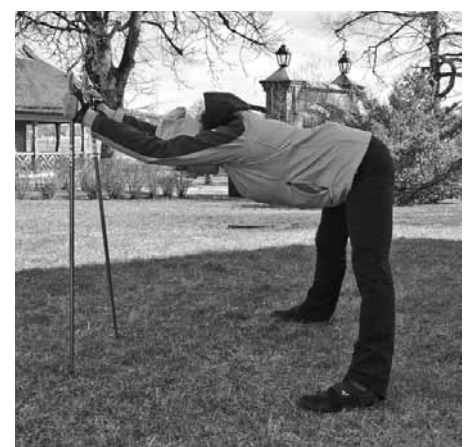
Muguras, rokas muskuļu, aizmugurējā kāju muskuļu stiepšana. Pēc tam jānoliecas uz priekšu un ar plaukstām jāturas pie pirkstgaliem. Beigās 3–5 reizes liela izelpa.