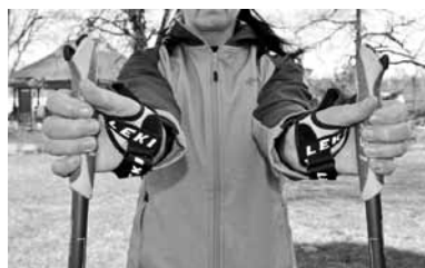
Jāsagatavo plaukstu locītavas, tās saliecot uz iekšu un atpakaļ.