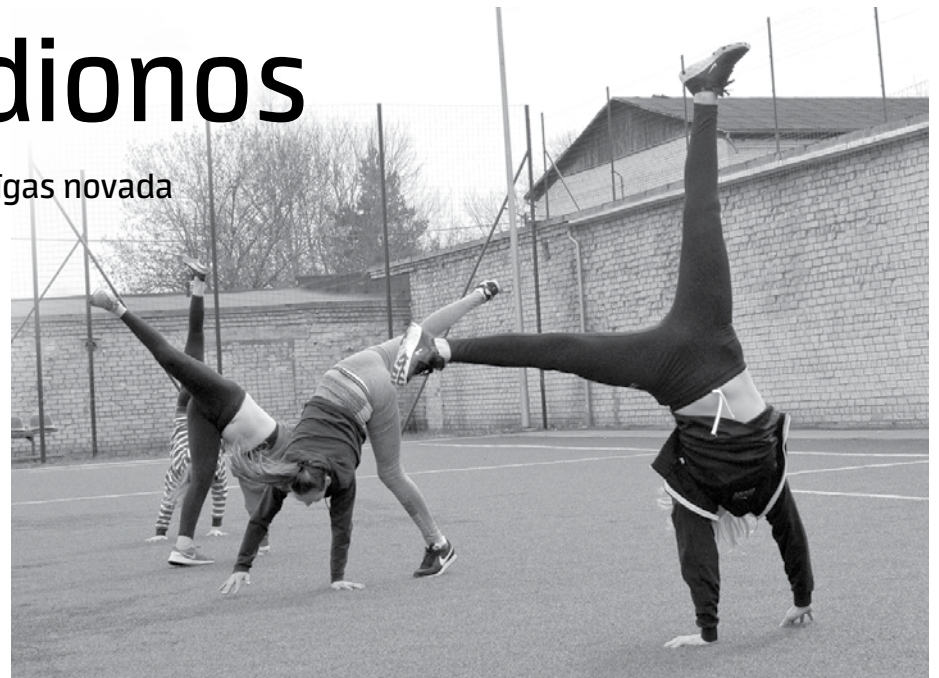
Akrobātikā jāmācās arī mest ritentiņus.