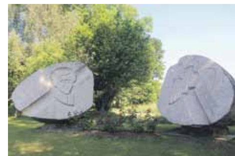
Kādreizējais saimniecības ēkas vietā kopš 1992. gada Viļņa Titāna veidots pieminēklis Fricim Bārdam.