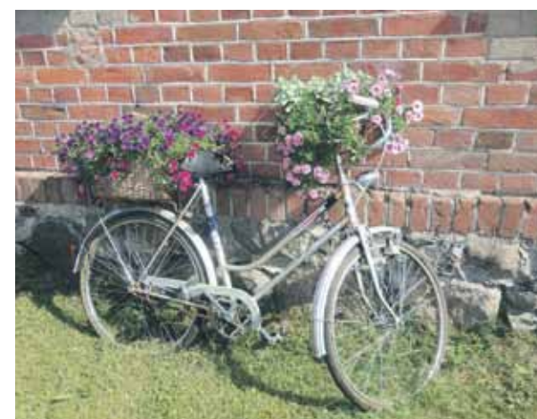
Melngaiļa sētā dujritenis (tiesa, ne paša Emiļa Melngaiļa) pārtaps krāšņā dekorā.