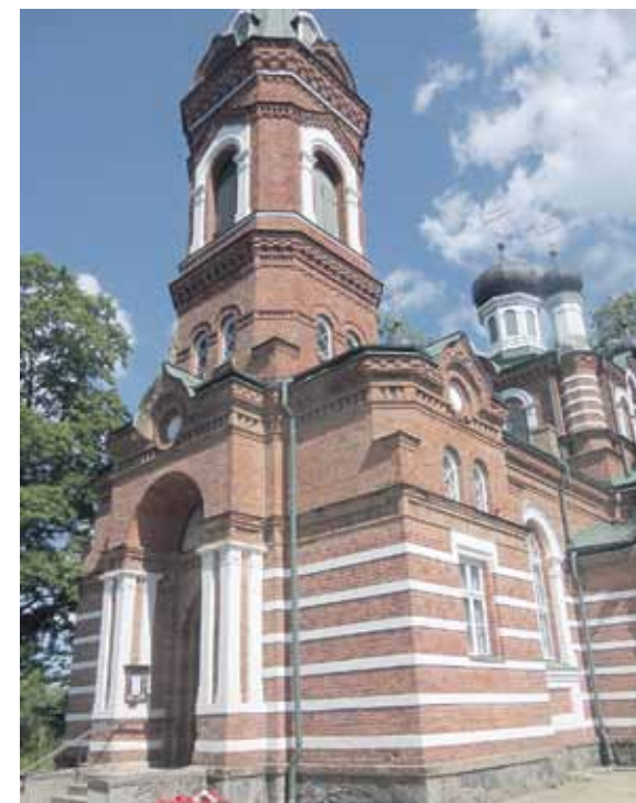
Stalta un kopta slejas Limbažu Kristus apskaidrošanās pareizticīgo baznīca.