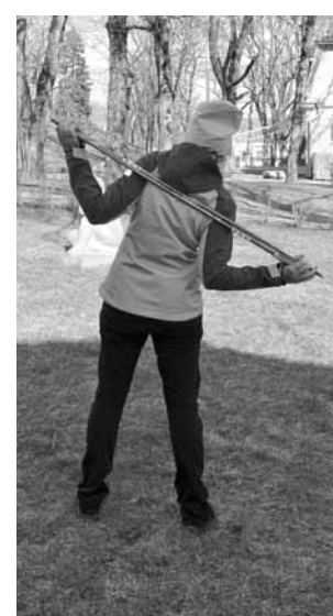
Jāsagatavo sānu muskuļi, noliecoties pa labi un pa kreisi.