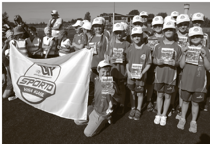
„Sporto visa klase” 3. vietas ieguvēji – Ķekavas vidusskolas 3.b klase

Tajā pašā laikā Māmiņu telti notika īpaša vingrošana gan jaunajām, gan topošajām māmiņām treneres