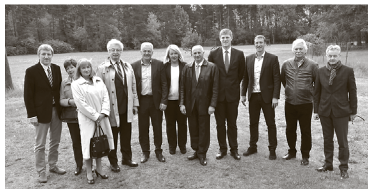
Vieta, kur nākotnē varētu tapt Ķekavas stadions.