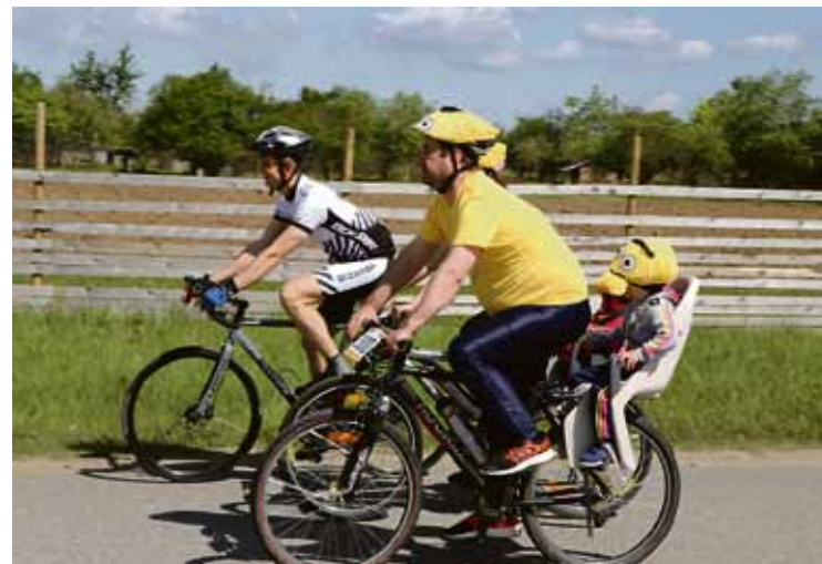
Ģimenes distanču dalībnieki bija padomājuši arī par oriģinālu tēlu.