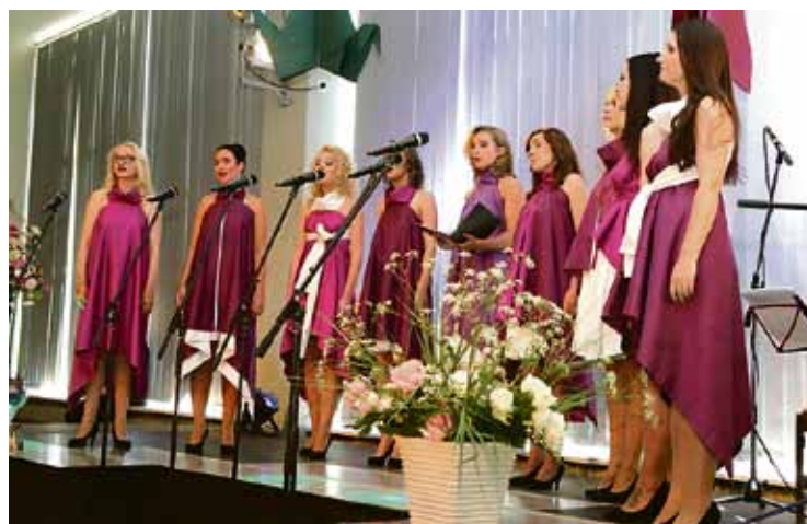
Mirkļis no ansambļa „Jūti” desmit gadu jubilejas koncerta.