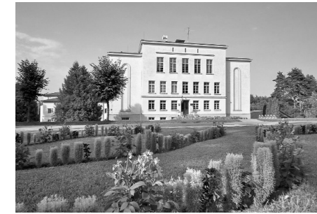
Dāvja Ozoliņa Apes vidusskolas kolektīvs

Mudiniet savus klasesbiedrus, skolasbiedrus uz pasākumu, lai tas izdotos jautrs un atmiņām bagāts!