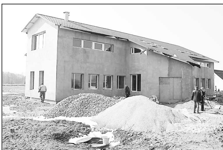
Красивое и современное – таким будет здание территориального самоуправления Силюкалнской волости.

Напомним, что работы по реконструкции административного здания территориального управления Силюкалнской волости проводит фирма SIA «Latspas», с которой установле-