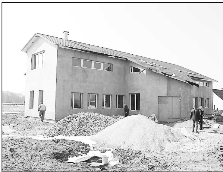
Skaista un moderna – tāda būs Siļukalna pagasta teritoriālā pārvalde.

Jāatgādina, ka Siļukalna pagasta teritoriālās pārvaldes administratīvās ēkas rekonstrukcijas darbus veic firma SIA «Latspas», ar ko tika nodibinātas līgumsaistības. Līgumā paredzēto darbu izpildes summa – 206 035,22 latu, plus 18% PVN jeb