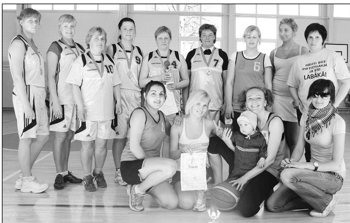
Stabulnieku un Riebiņu sieviešu basketbola komandas.

Novada basketbola čempionātā šogad piedalījās piecas vīriešu komandas (Stabulnieki, Rušona, Riebiņi, Galēni un Siļukalns) un divas sieviešu vienības (Stabulnieki un Riebiņi). Aizraujoša sieviešu komandu dueli arī šogad par novada basketbola čempionēm tika kronēta Stabulnieku ko-