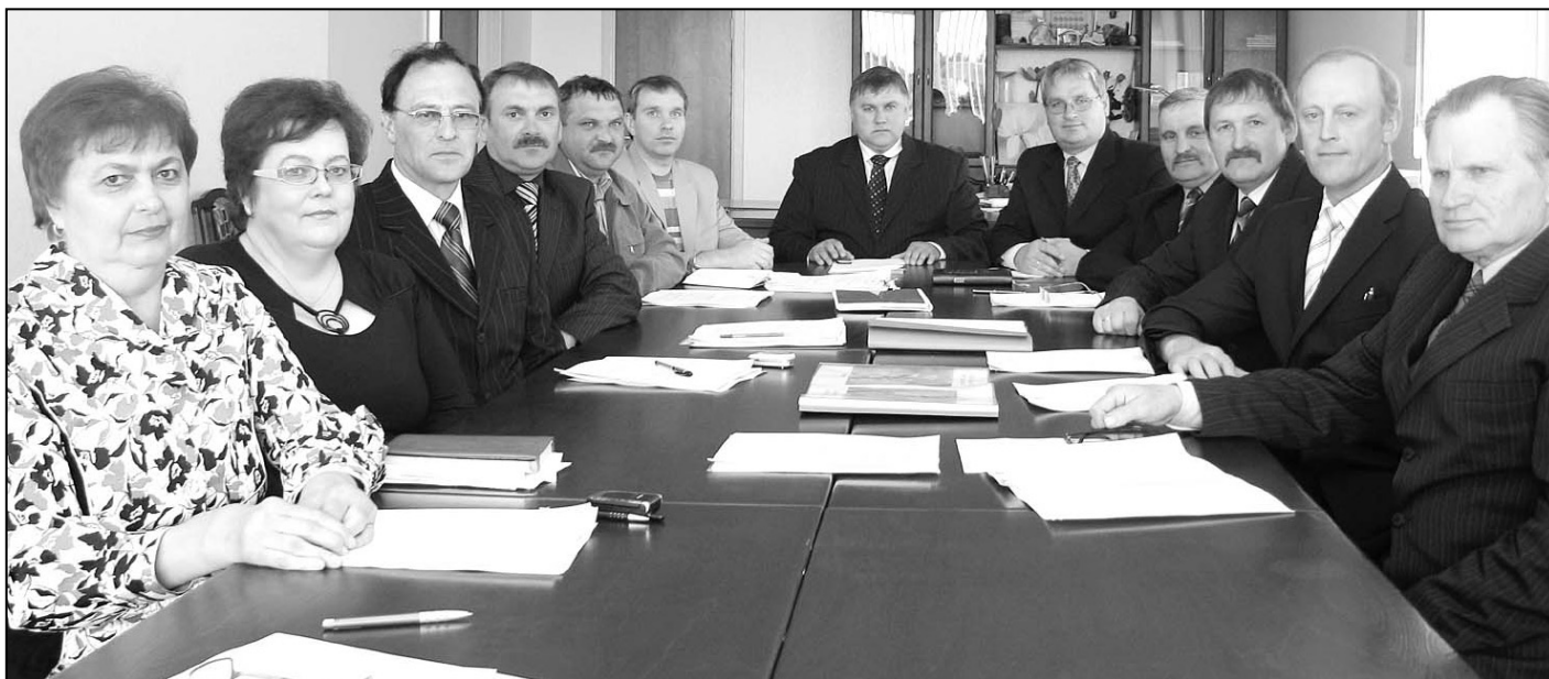
Riebiņu novada domes deputātu fotogrāfija pirms šī sasaukuma pēdējās domes sēdes 12. maijā. Jau 6. jūnijā startēs 2009. gada pašvaldību un Eiroparlamenta vēlēšanas. Riebiņu novadā šī gada pašvaldību vēlēšanās kandidē 70 deputātu kandidāti no pieciem sarakstiem.

6. jūnijā, vēlēšanu iecirkņi būs atvērti no pulksten 7.00 līdz 22.00.