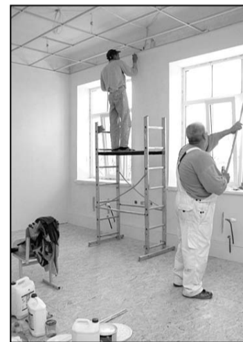
В помещениях общественного центра скоро закончатся ремонтные работы и будет установлено приобретённое в рамках проекта оборудование.